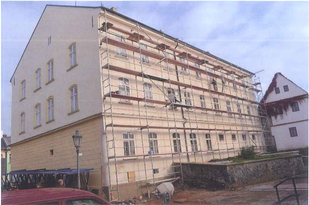
Dokončovací práce na jižní straně budovy úřadu