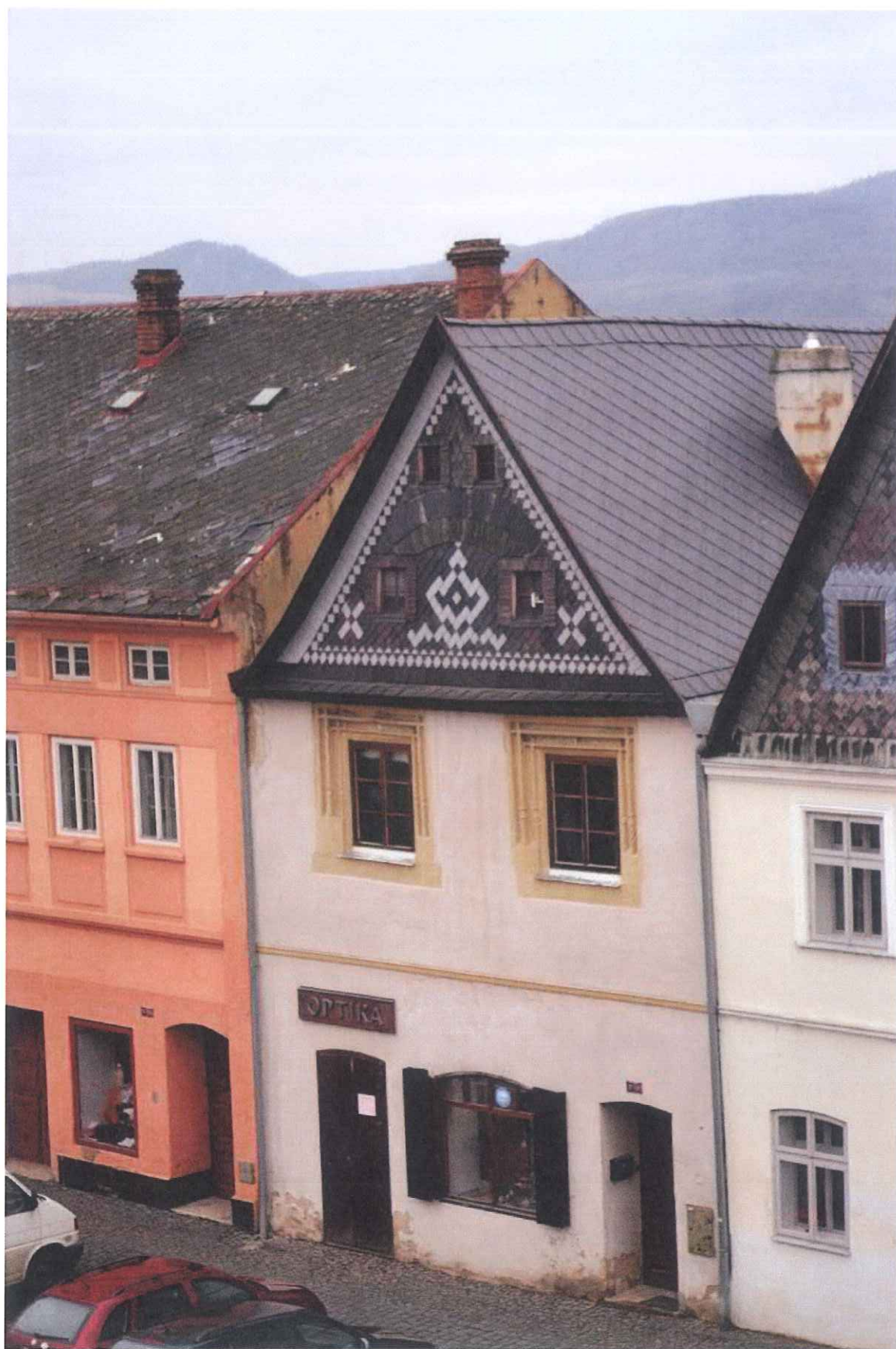
Stav po opravě