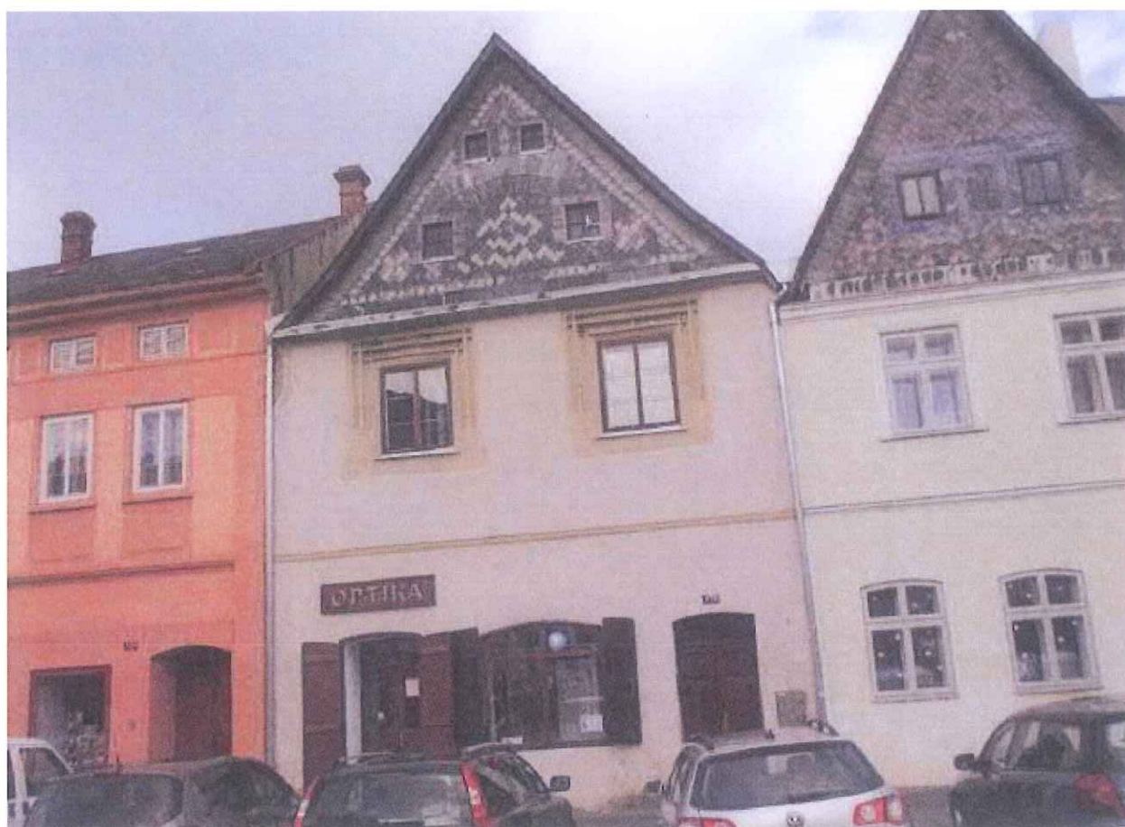
Stav před opravaou

Při obnově byla provedena oprava břidlicového štítu uliční strany objektu s výměnou oplechování římsy pod štítem a další související práce.