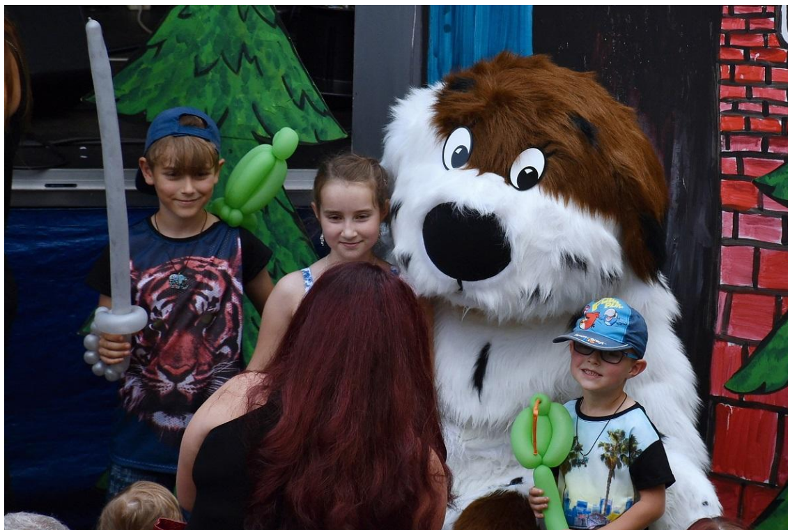
Rockfest, 25. 6. 2016