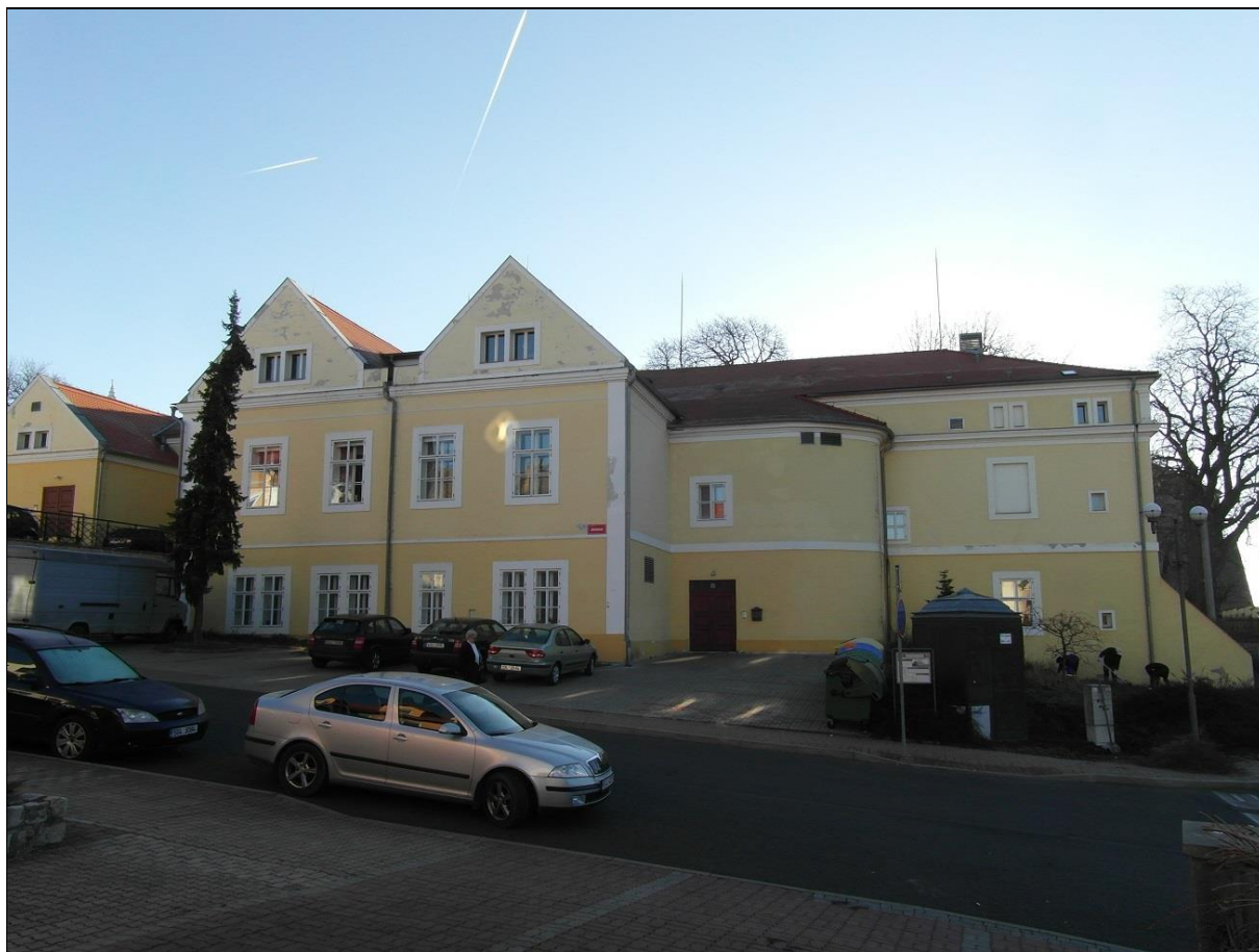
Kadaň, objekt čp. 147 (Střelnice) - oprava fasády