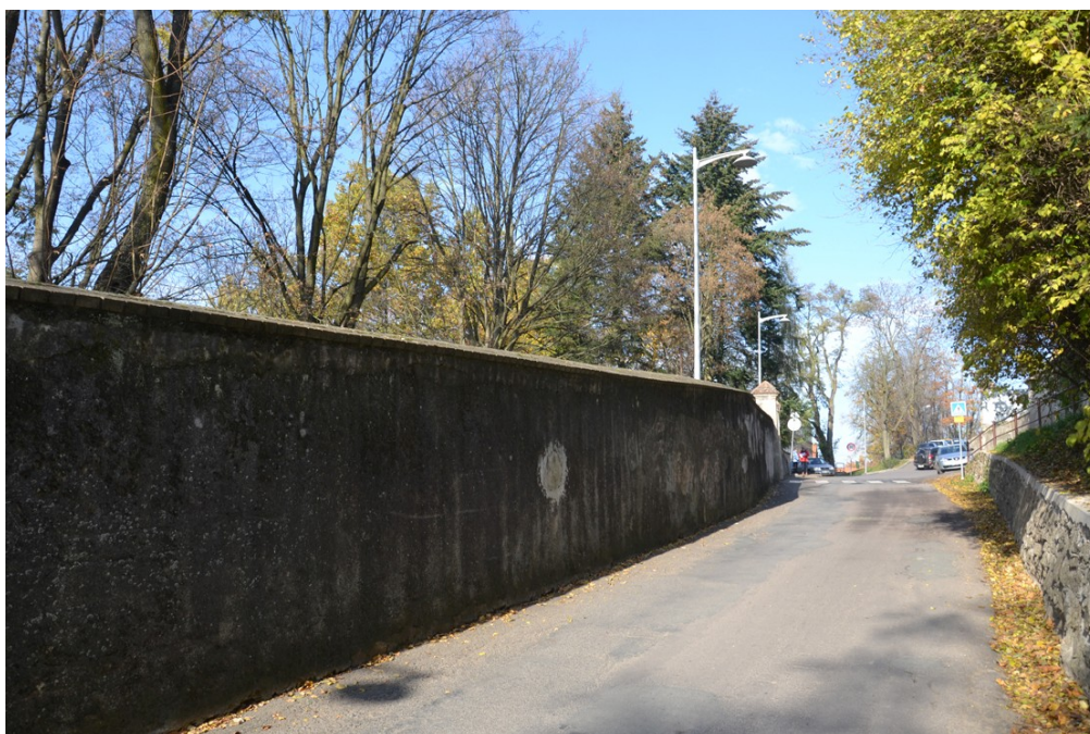
Severní část ohradní zdi bývalé zámecké zahrady navrhované k demolici, pohled od jihu k severu.