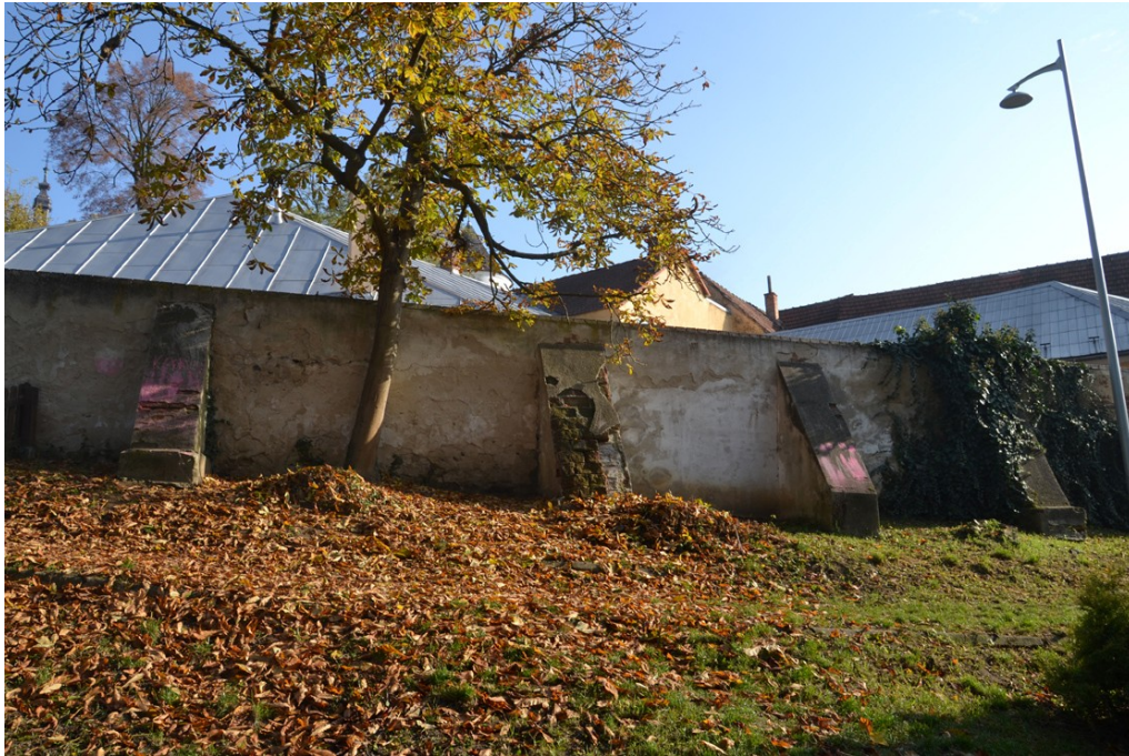
Opěrný systém jihozápadní části zdi, pohled směrem ze zámku.