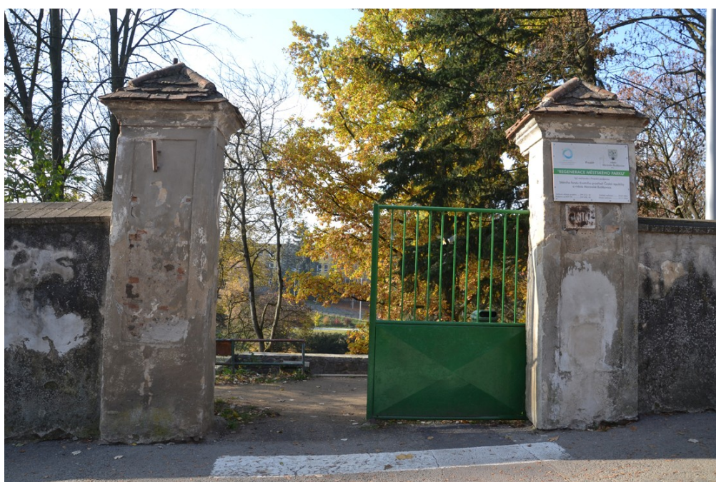
Vstupní brána do spodní části zámecké zahrady.