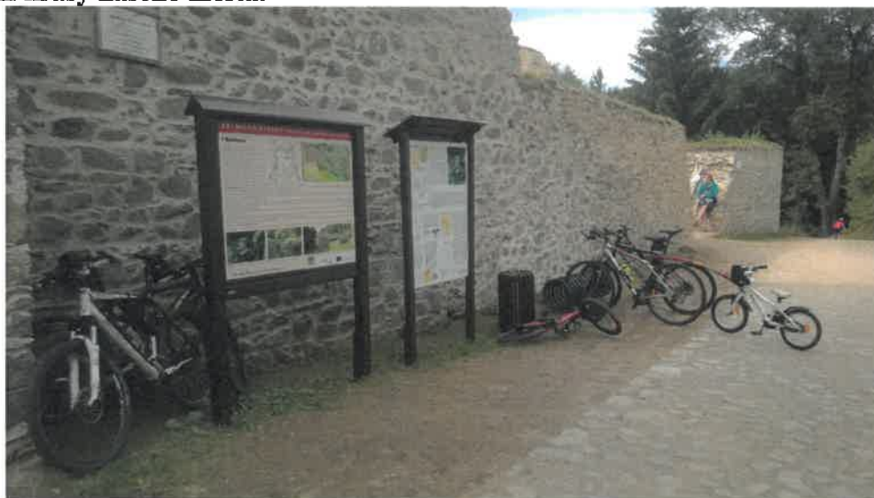
Brtnická stezka – zastavení u Rokštejna

Cílem projektu je propojit přírodní krásy s historickým jádrem Brtnice a přiblížit tak turistům krásy našeho města.