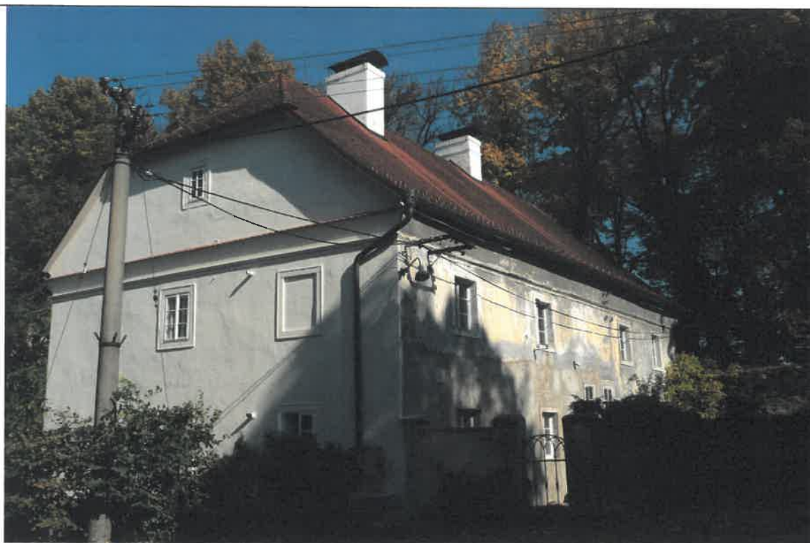
Dům č. p. 3 po I. etapě obnovy omítek, nátěru fasády a výměny oken