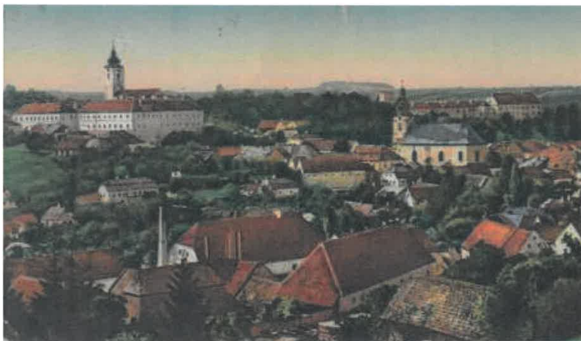
Pohled na Brtnici roku 1918

Obec Brtnice je poprvé zmiňována v písemných pramenech v polovině 13. století (první písemná zmínka je v listině markraběte Přemysla, datovaná 31. října 1234). Její celkové utváření je dáno geografickou polohou včetně existence řeky a historickým vývojem a také stálými vlivy politickoekonomického vývoje. První osídlení souviselo se starými středověkými obchodními stezkami (Znojensko-Jihlavsko), na níž byla Brtnice důležitou zastávkou.