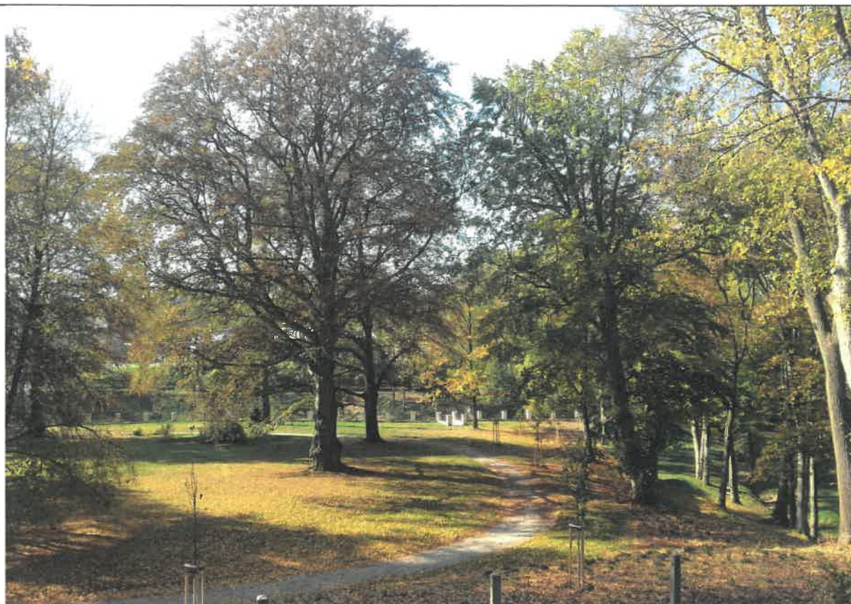
Revitalizace anglické zahrady a úvozu spolu s ohradní zdí a obnoveným schodištěm (v pozadí) – pohled od zámku do anglické zahrady