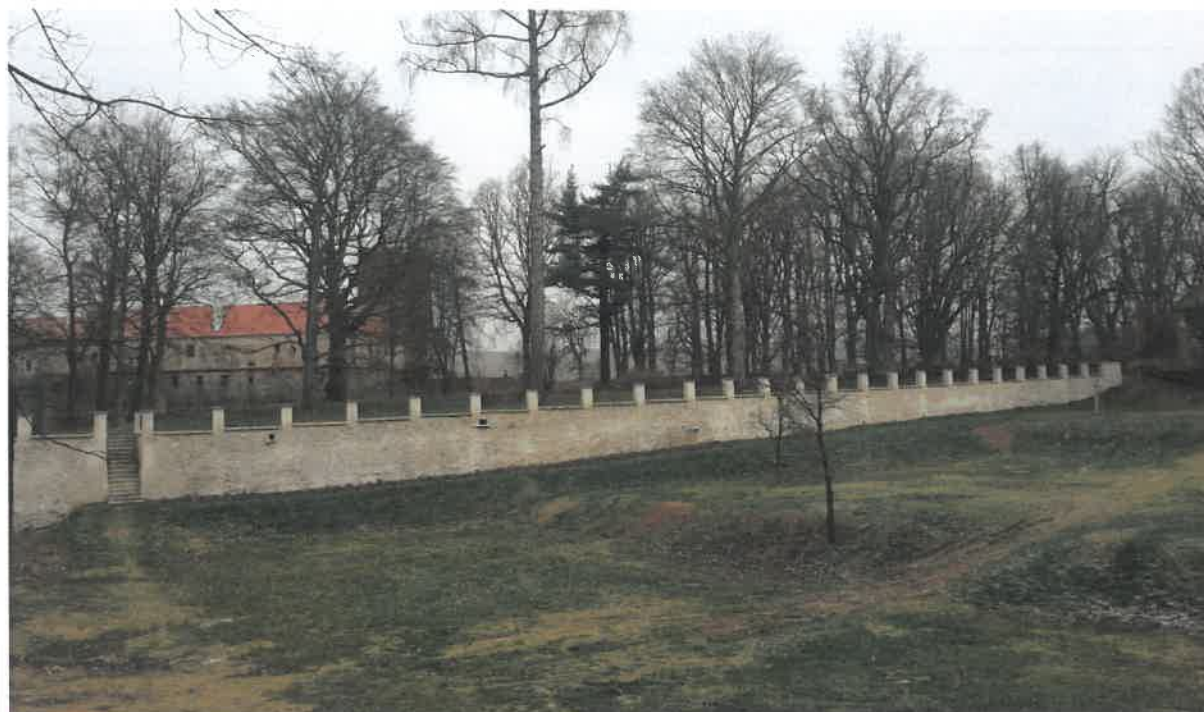
Revitalizace anglické zahrady a úvozu (pohled od silnice na úvoz s obnovenou ohradní zdí a schodištěm)