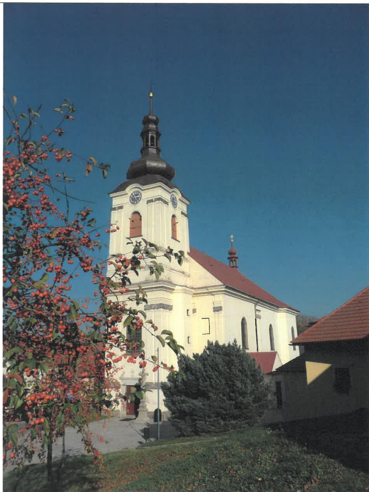
Kostel sv. Jakuba Většího po obnově střechy věže kostela