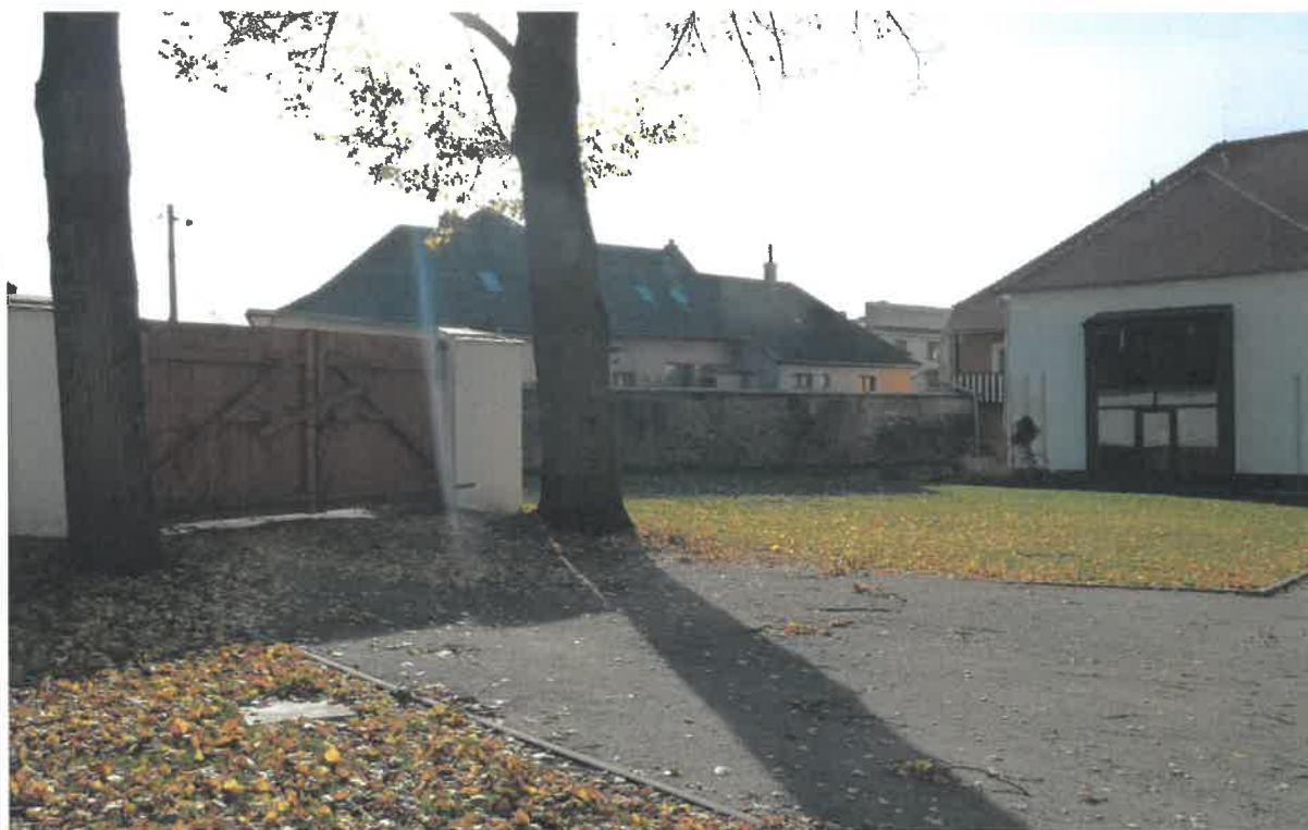
Dvůr Rodného domu J. Hoffmanna po odstranění nepůvodní budovy ze dvora