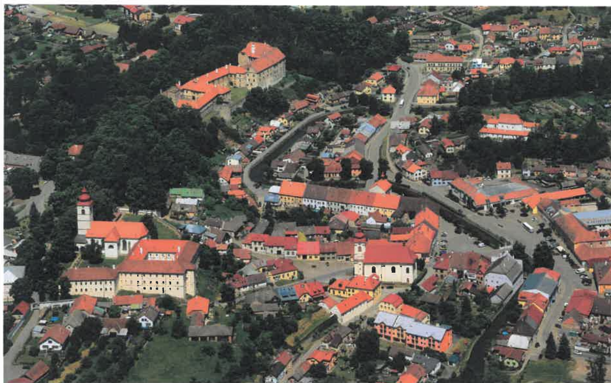
Celkový pohled na památkovou zónu .....v podzimních barvách