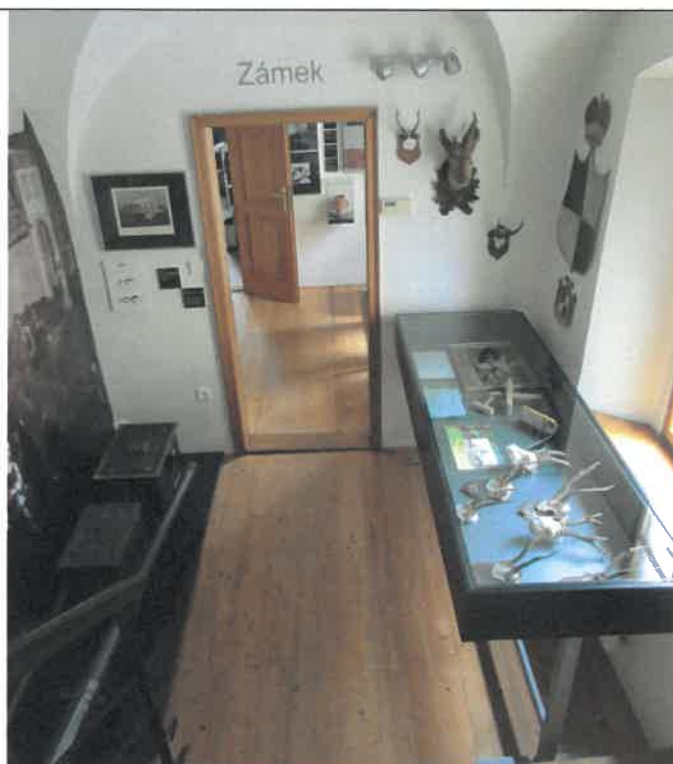
Část muzejní expozice v budově informačního centra