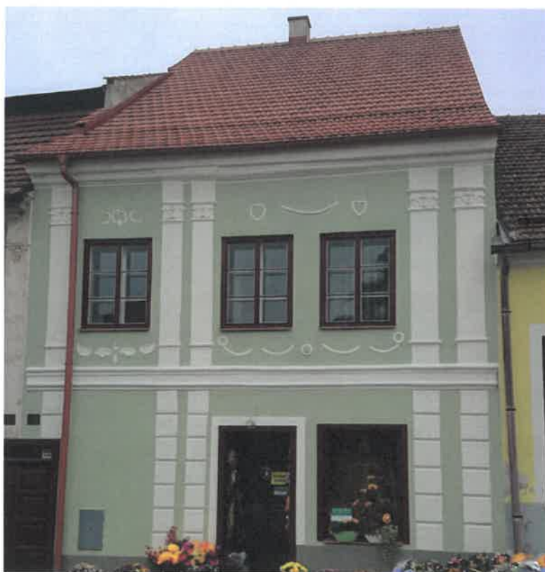
Měšťanský dům č. p. 222