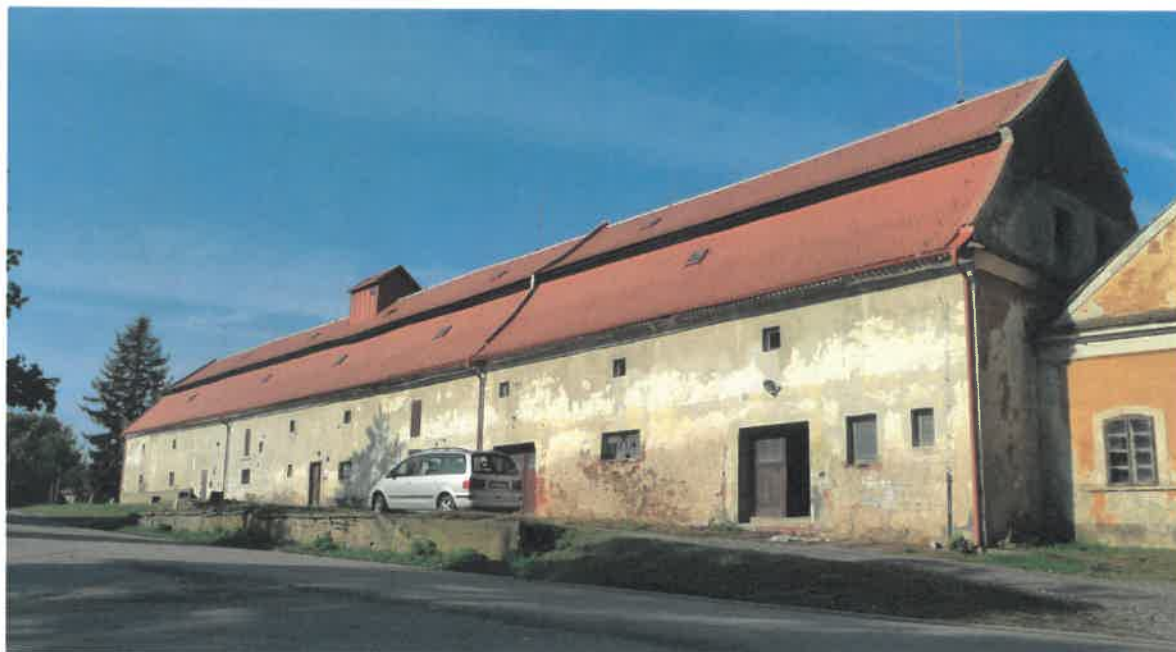
Bývalá panská sýpka č. p. 63