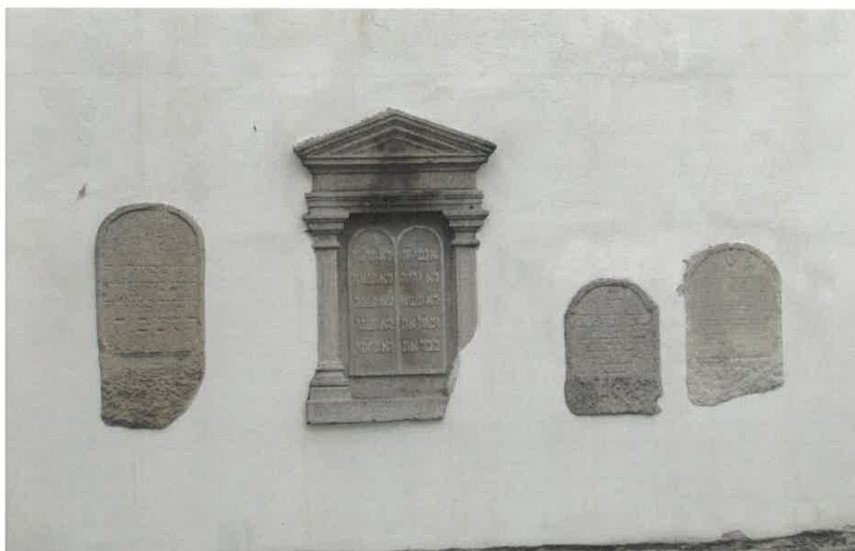
Kamenné desky ze zrušené židovské synagogy ve dvoře infocentra