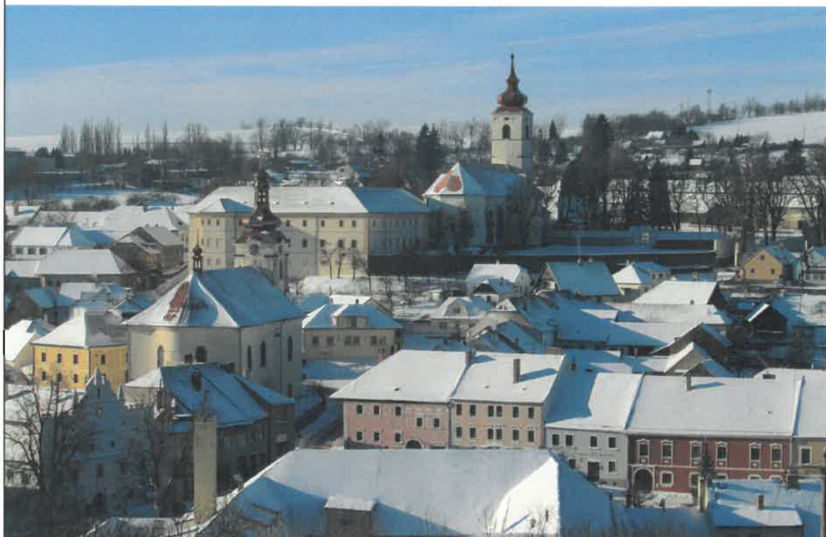
..... v zimě