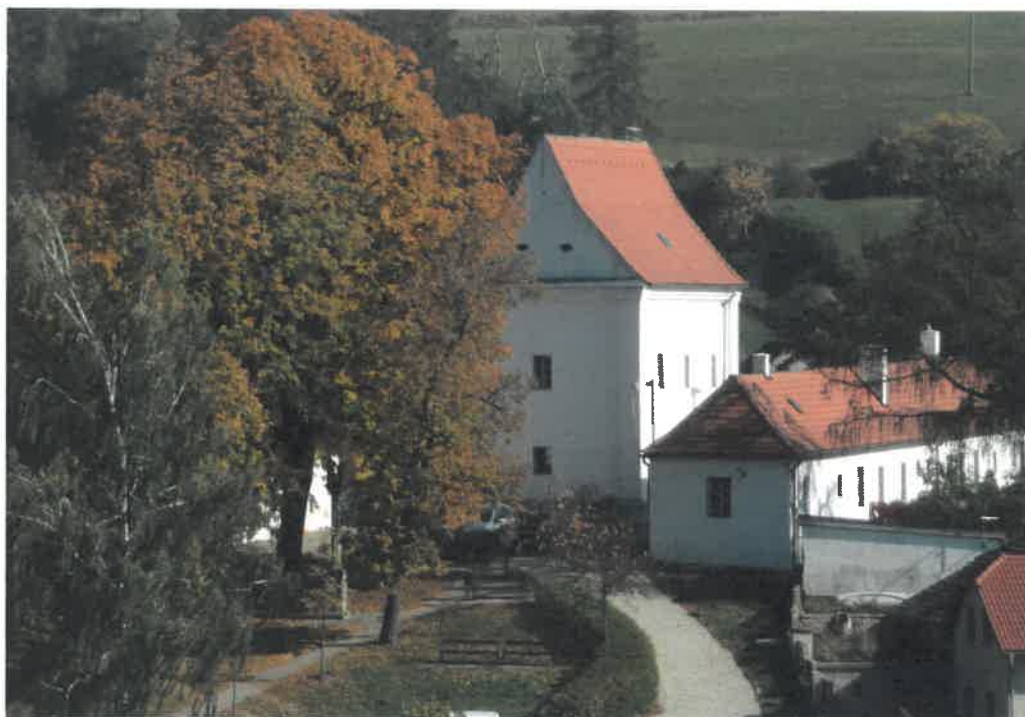
Kaple P. Marie Pomocné