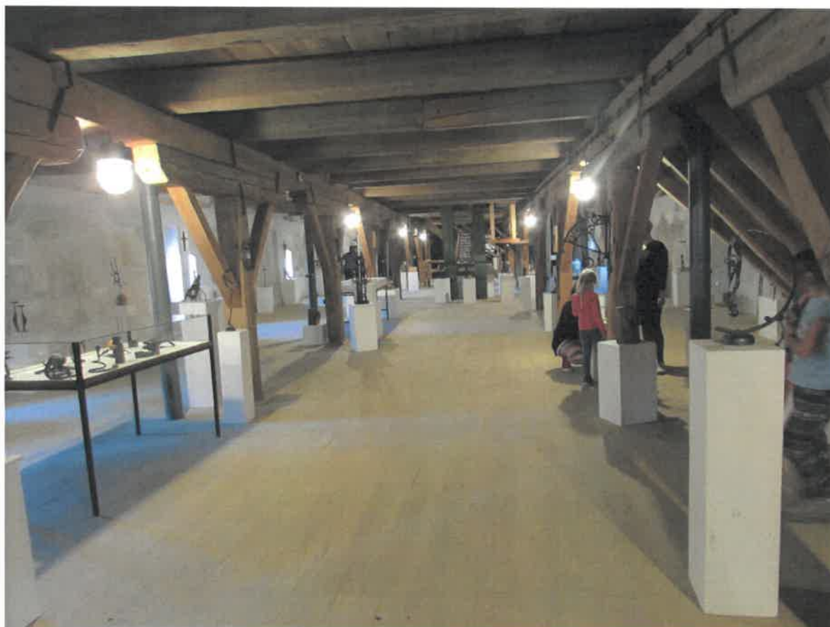
Výstava kovářských prací v objektu panské sýpky (obnovené dřevěné podlahy)