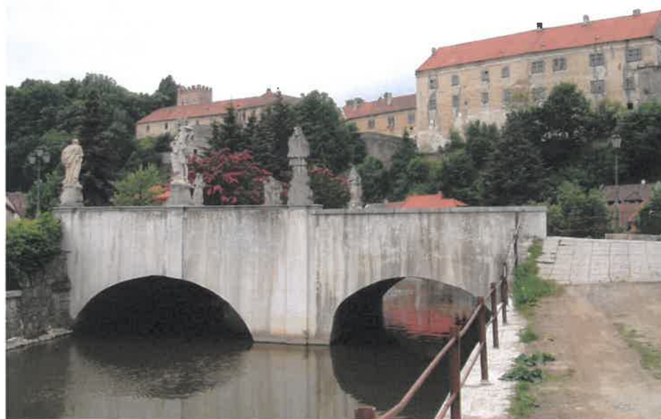
Zámek v popředí s barokním mostem