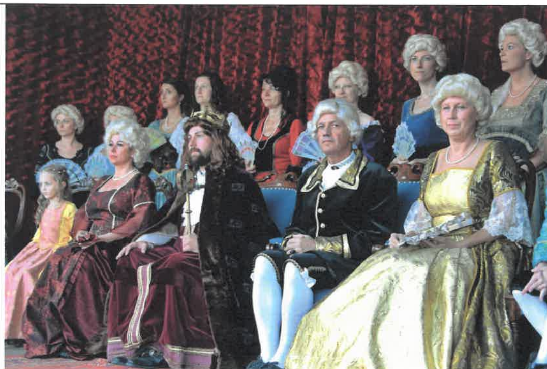
Den pro starou Brtnici a scénka „Příjezd Karla VI. s družinou do Brtnice“

E.2. Akce, které se vztahují k akcím obnovy kulturních památek z Programu regenerace MPR a MPZ, nebo využívají a rozvíjejí místní tradice (trhy, soutěže, setkání rodáků, poutě, oslavy místních svátků atd.).