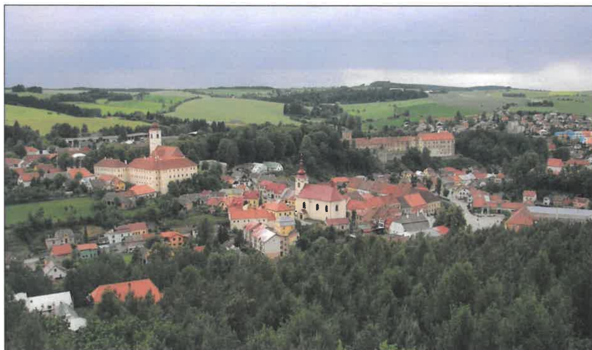
.....a v létě