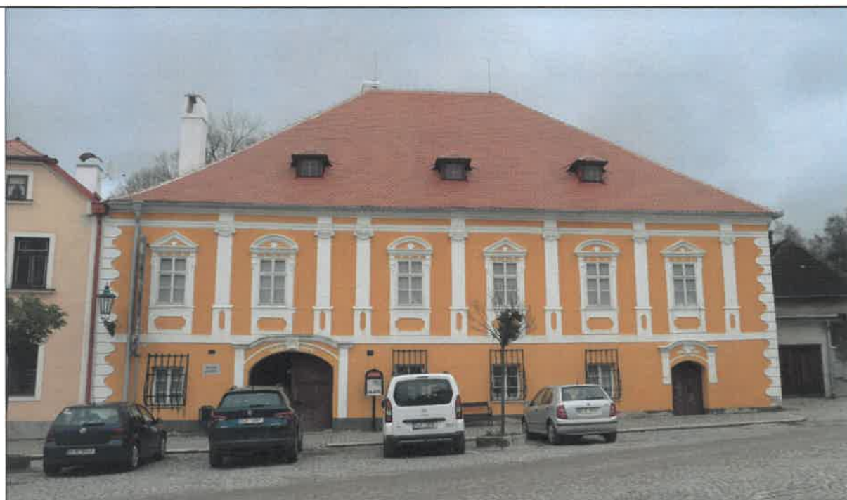
Rodný dům Josefa Hoffmanna po obnově střechy