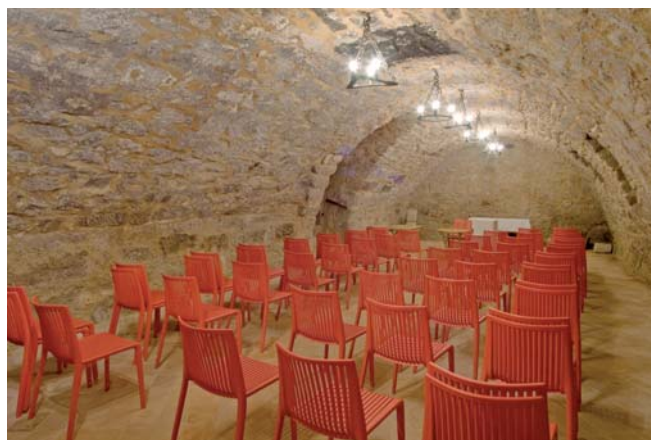
Historické sklepení domu U Zlatého slunce