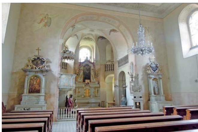
Svojšíň, kostel sv. Petra a Pavla. Pohled v lodi směrem do presbyteria