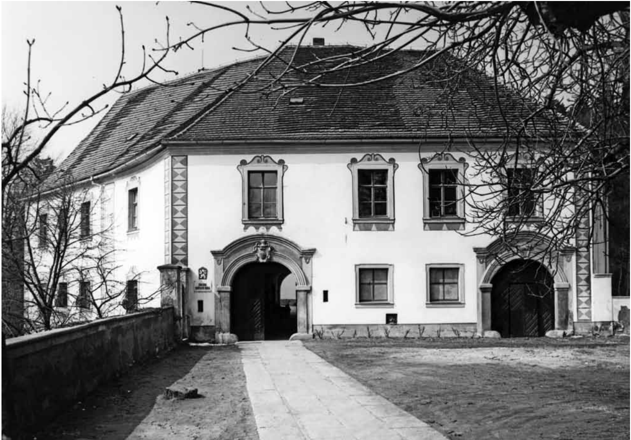
Obr. 1. Chanovice (okr. Klatovy), zámek. Hlavní průčelí.

Jednou z klíčových partií knihy je kapitola Vývoj panského sídla na základě stavebně historického průzkumu a archeologického výzkumu , na které se autorsky podílejí J. Anderle ( Předpoklady a úroveň poznání vývoje budovy zámku ), J. Hůrková ( Popis a interpretace archeologických situací, Stavební a technická keramika ) a M. Tetour ( Stavební materiály ). Přestože jsou uvedené tři části striktně odděleny autorsky i graficky, jejich obsah se částečně prolíná. Relativně stručný nástin vývoje objektu od J. Anderleho, prováděný zásadními analytickými plány v úrovni suterénu, přízemí a prvního patra, se na mnoha místech odvolává na výsledky archeologického výzkumu; v menší míře je tomu opačně u partie napsané J. Hůrkovou. Ta na rozdíl od stavebněhistorického průzkumu prezentuje důsledně veškeré komponenty výzkumu archeologického – po jednotlivých sondách tak uživatele publikace seznamuje s jednotlivými řezy i půdorysy, s detailním popisem evidovaných vrstev a výčtem nálezů v nich a s maticemi stratigrafických vztahů. V partii věnované stavební