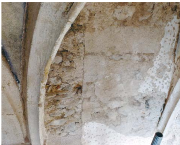
Obr. 6. Staré Sedlo, kostel Nanebevzetí Panny Marie. Spára zjištěná ve zdivu severního pole závěru sakristie, v ploše čelního oblouku paprscité žebrové klenby.

Portál byl ze žuly, sedlový, měl jednoduše okosená ostění, rovný překlad podpíraly v koutech konkávně projmuté kamenné konzoly. Typologicky a výtvarně nálež odpovídá gotické kamenické práci nejdříve v polovině 14. století a v době pozdější, v 15. století nebo ještě na počátku 16. století. – Na opačné straně zdi, v severozápadním koutu sakristie, byla kromě toho zjištěna a odhalena hrana a část omítaného ostění středověkého průchodu mezi sakristií a presbyteriem.