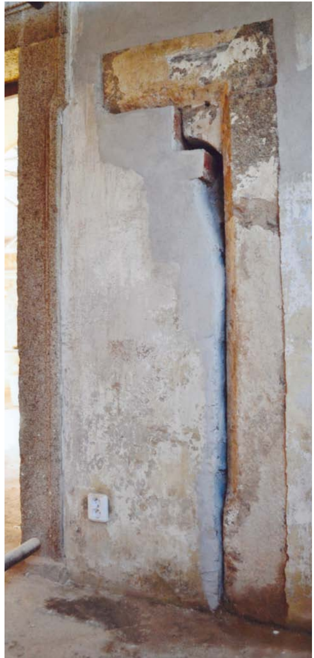
Obr. 5. Staré Sedlo, kostel Nanebevzetí Panny Marie. Nález torza gotického sedlového portálu z presbyteria do sakristie. (Foto J. Kaigl, 4/2012)

Povrch klenebních konzol a žebrování v sakristii byl restaurátorem v roce 2012 očištěn místy až na kámen. Ukázalo se při tom, že některé staticky významnější architektonické