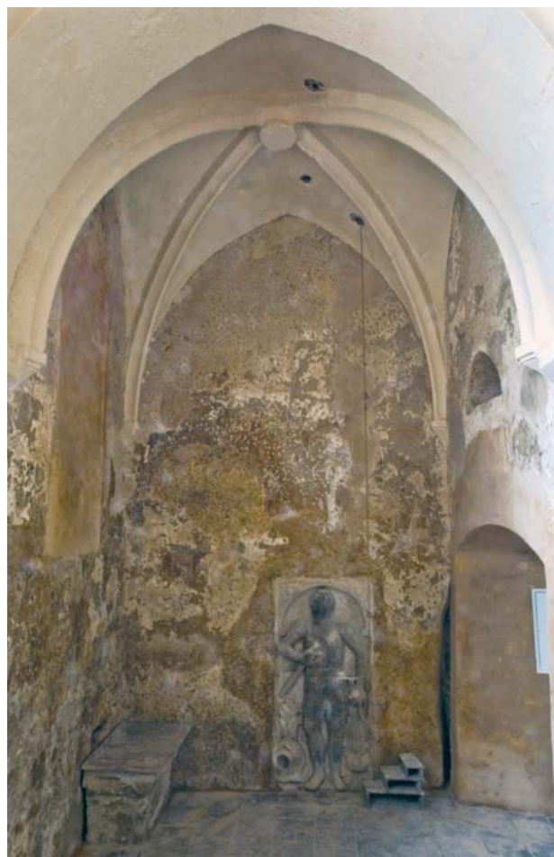
Obr. 3. Staré Sedlo, kostel Nanebevzetí Panny Marie. Pohled do západní část sakristie.

Jak již bylo v odborné literatuře uvedeno, 5 na stěně nad barokně upraveným průchodem ze sakristie do presbyteria, ve výšce přibližně 3,9 m, nalézá se lomený záklenek otvoru se šikmým ostěním. Ostění záklenku, poodhalená nyní po památkové obnově do nitra zdi mezi presbyteriem a sakristií o tloušťce 1,55 m na hloubku 0,7 m, mají nepravidelný omítaný povrch s pozůstatky středověké výzdoby lineární malbou červené barvy, vytvářející prosté geometrické obrazce (obr. 4). Otvor byl dole poškozen zedníky při vybourání a sklenutí barokního průchodu, a tak jeho původní výšku neznáme. Široký je 0,85 m a od severozápadního koutu sakristie ho dělí vzdálenost 0,65 m. Mohla to být pouhá nika určená například pro umístění sochy. Přichází rovněž v úvahu názor, ale oproti předchozímu autorovu předpokladu s menší pravděpodobností – což souvisí se zjištěním, že západní část sakristie byla osvětlena na své jižní straně