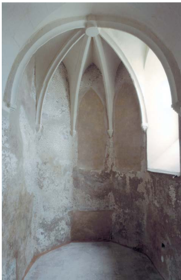
Obr. 2. Staré Sedlo, kostel Nanebevzetí Panny Marie. Pohled do závěru sakristie.

povrchu vnějšího omítaného pláště lze existenci tohoto okna vytušit. 4 Nyní se svým obrysem pohledově uplatňuje daleko lépe v interiéru, včetně pozůstatků staré malované šambrány s rozvilinami. Co do velikosti a výše parapetu je stejné jako soudobá okna v závěru sakristie, jejichž obrys byl při památkové obnově rovněž zachycen a vyjádřen rozdílným pojetím omítky v ploše zazděného okenního otvoru.