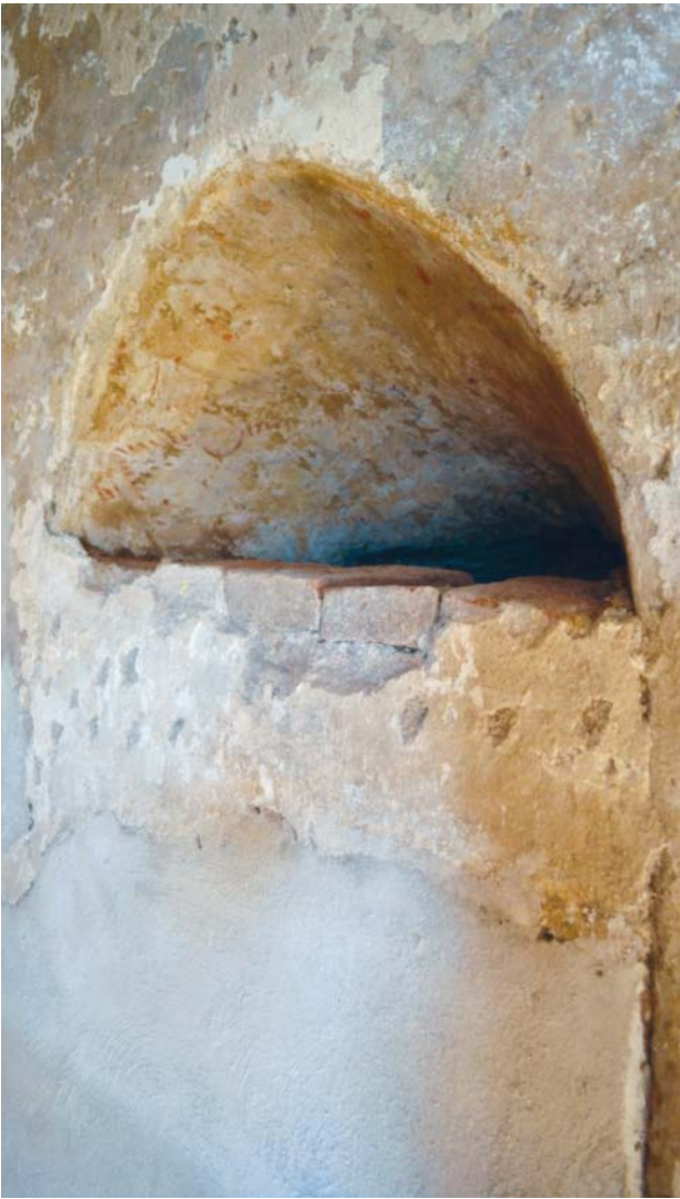
Obr. 4. Staré Sedlo, kostel Nanebevzetí Panny Marie. Záklenek za zděného gotického otvoru v sakristii, nalézajícího se nad průcho-dem do presbyteria.

v ní mohly konat příležitostné neveřejné bohoslužby za přítomnosti například místního správce klášterního zboží, donátora nebo jiné významné osoby (Starým Sedlem třeba jen projíždějící na své cestě směrem na Přimdu nebo naopak na Kladruby), kteří by přihlíželi liturgii právě z tribuny.