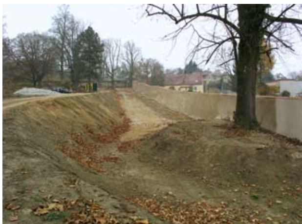
Obr. 8. Horšovský Týn, zámek. V roce 2001 se na několika místech zřítla ohradní zeď parku při silnici směrem na Stříbro. Podstatnou součástí prací potřebných k obnově bylo snížení druhotně navýšeného terénu. Tuto skutečnost dobře ilustruje pohled ze zahrady v průběhu obnovy.