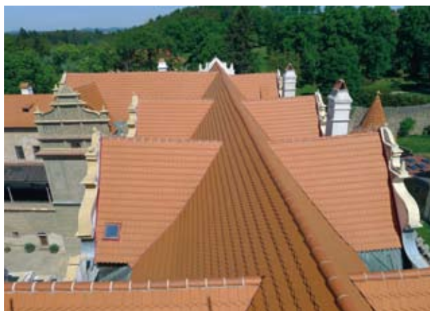
Obr. 12. Horšovský Týn, zámek. Střechy východního křídla po obnově.