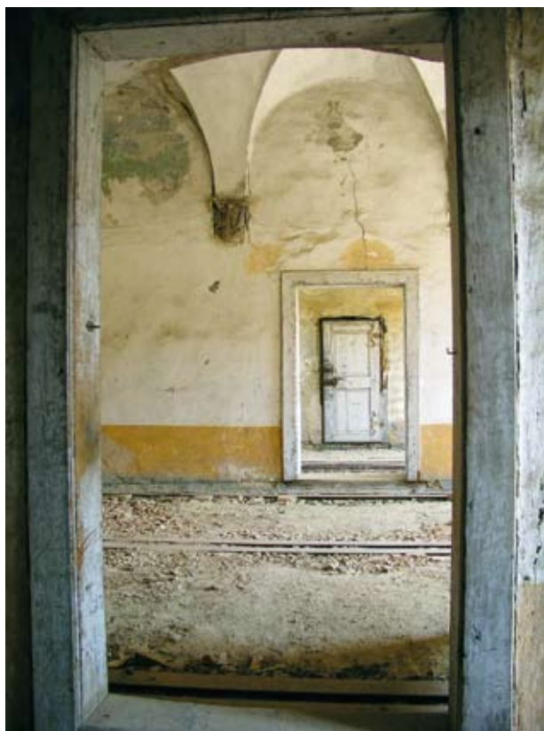
Obr. 3. Horšovský Týn, zámek. Lusthaus – průhled interiéru horního podlaží. Interiéry zatím zůstaly ve stavu po statickém zajištění. Na dokončení obnovy nejsou finanční prostředky. V Lusthausu se na rozdíl od ostatních částí zámku dochoval soubor původních historických dveří.

Historické městské jádro v Horšovském Týně je památkovou rezervací. Významných památek je tu značný počet. Pro míčovnu ani pro sýpku nemá město zatím využití. V roce 1998 navrhlo míčovnu přestavět na byty a sýpku využít pro kulturní a společenské účely, což by znamenalo likvidaci vnitřních dřevěných konstrukcí. Ministerstvo kultury, které v té době bylo zde příslušným výkonným orgánem státní památkové péče, oba záměry zamítlo. 1 Město následně sýpku i míčovnu bezúplatně nabídlo Národnímu památkovému ústavu k převzetí do státního vlastnictví. Pro formální potíže se schvalováním převodu se záležitost vlekla do roku 2006, kdy městskému zastupitelstvu došla trpělivost a nabídku bezúplatného převodu stáhlo zpět. Je třeba konstatovat, že město k péči o oba uvedené objekty přistupuje odpovědně. Opuštěnou míčovnu, ve které bezdomovci v roce 2006 založili požár, nechalo zajistit proti vstupu nepovolaných osob. V roce 2007 objednalo projekt výměny střešní krytiny, opravy krovu a statického zajištění, který zpracoval Ing. Z. Wolf. V roce 2008 byly podezděny základy míčovny a bylo staticky zajištěno její potrhání jihozápadní nároží. V roce 2010 začala s pomocí krajské dotace oprava krovu a střechy. U sýpky město lokálně vyspravilo vadnou střešní krytinu. V roce 2010 objednalo projekt celkové obnovy exteriéru včetně opravy krovu a provedení nové střešní krytiny, který zpracovala Ing. H. Semonská. Na jeho realizaci město