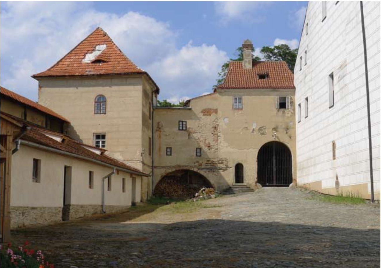
Obr. 24. Horšovský Týn, zámek. Druhé nádvoří při pohledu k severu. Přízemní novostavba (na obrázku vlevo) mezi purkrabstvím a Vejrovnou je téměř dokončena. Z důvodů nedostatku finančních prostředků jsou osazeny pouze provizorní výplně otvorů a není omítnut sokl. Objekt v daném prostředí nepůsobí rušivě. Jeho zapojení do prostředí pomohlo užití staré střešní taškové krytiny. (Foto M. Solař, 2011, stav krátce po poškození střechy Vejrovny vichřicí)

kaple a jejich zajištění, zajištění podzemní lednice v parku, zajištění a pokud možno i oprava ohradních zdí parku, oprava havarijní hráze rybníka, celková rehabilitace parku. Žádoucí je zajišťovat průběžnou údržbu. Konkrétním příkladem mohou být komíny, z nichž minimálně dva hrozí zřícením.