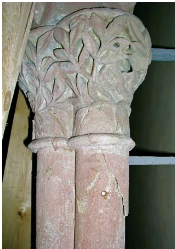
Obr. 6. Horšovský Týn, zámek. Kaple Nejsvětější Trojice, detail prasklého gotického sloupku.