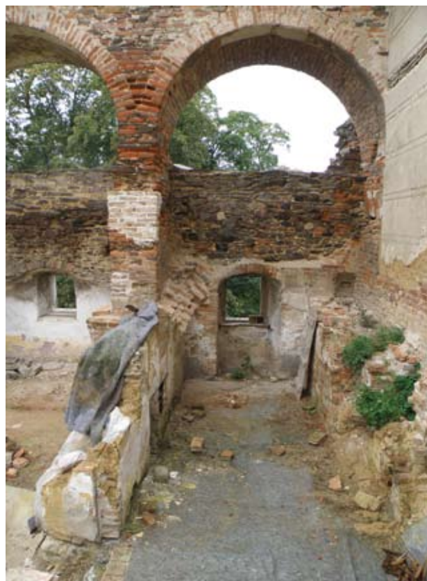
Obr. 23. Horšovský Týn, zámek. Druhé nádvoří, zbořeníště domu mezi purkrabstvím a Vejrovnou. Stav po odklizení suti. Detail dochovaných zbytků zaniklého domu.

Uragán Kyril na jaře roku 2007 poškodil střechu Vejrovny. To spolu se špatným technickým stavem celé této budovy a záměrem rekonstruovat hmotu přilehlého