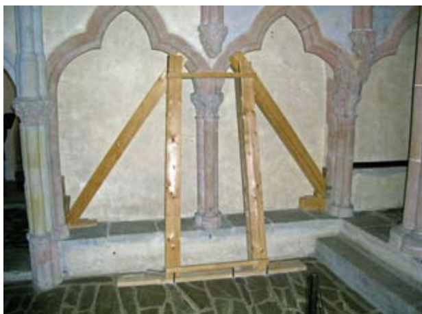
Obr. 5. Horšovský Týn, zámek. Kaple Nejsvětější Trojice, část severní stěny s gotickou arkaturou. V roce 1998 musela být konstrukce zajištěna výdřevou. Současně s odstraňováním příčin havárie byla rekonstruována kanalizace a obnoven odvodňovací systém, byly podezděny základy jihozápadní věže a obnoven krov a střecha jižního křídla. Na obnovu interiéru kaple zatím nedošlo.