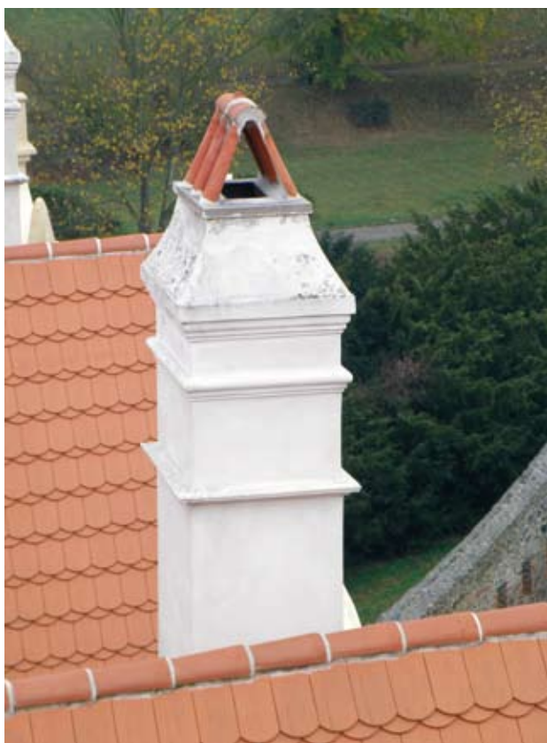
Obr. 13. Horšovský Týn, zámek. Střechy východního křídla po obnově. Střechu dělají detaily. Velká pozornost se při obnově věnovala mimo jiné komínům.

táhel, sanaci konstrukce krakorcovitě vyloženého patra, opravu krovu a položení nové střešní krytiny. Na žádost plzeňského pracoviště byla navržená prejzová krytina nahrazena pálenými taškami bobrovkami. Důvodem žádosti byla snazší údržba. Z hlediska památkové péče je bobrovka na zámku v Horšovském Týně historickou krytinou, doloženou nejméně od 19. století. 3 Prejzy na dochovaných střechách pocházejí až z obnovy v sedmdesátých a osmdesátých letech 20. století. Alternativně byla