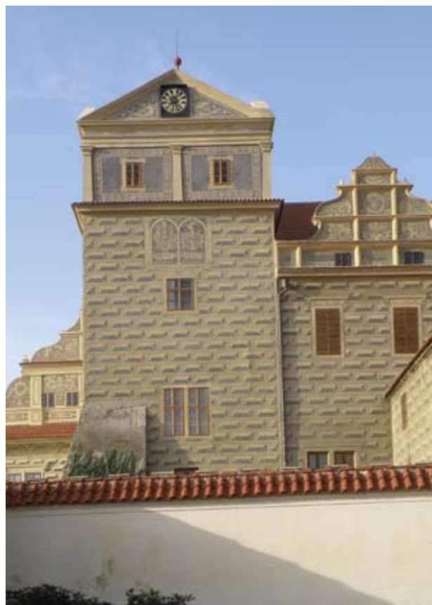
Obr. 20., 21. Horšovský Týn, zámek. Východní průčelí jihovýchodní nárožní věže. Stav před zahájením oprav a po obnově.

štitu krčku je věrohodná. Prvotní představa byla, že stávající omítky se pouze očistí a doplňované plochy se jim barevně přizpůsobí. Tento požadavek se při provádění nepodařilo dodržet a via facti došlo k plošným barevným retuším. Výsledek lze však oprávněně považovat v celku i výtvarném detailu (rekonstrukce nedochovaných sgrafit) za úspěch (obr. 16, 17).