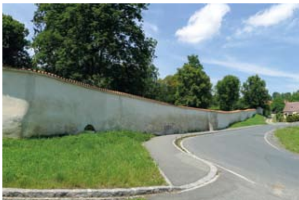
Obr. 9. Horšovský Týn, zámek. Ohradní zeď parku při silnici směrem na Stříbro po obnově.

prostor se využije právě pro nové návštěvnické záchody, ale zatím není ani projekt. Podobně je to s bezbariérovým přístupem, který by návštěvníkům s pohybovým omezením umožnil nejen prohlídku, ale i účast na společenských akcích v Erbovním sále. Zvažoval se přístup přes park obnovením zaniklého můstku. Tato varianta je však pro správu zámku i invalidy natolik nepraktická, že se na ni rezignovalo. Pro vložení výtahu do dispozice není vhodné místo. Zdá se, že by přijatelným řešením mohla být přístavba výtahu ze strany nádvoří do ústupku mezi východním křídlem a ochozem takzvaného Lusthausu. Tato možnost se však zatím ani nezačala ověřovat.