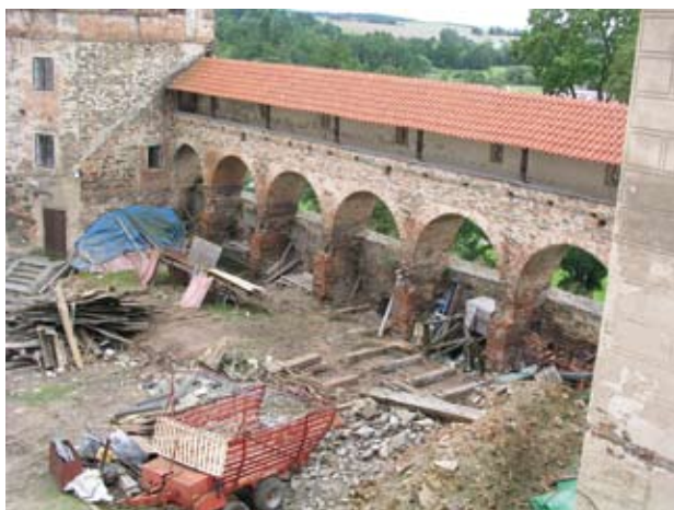
Obr. 22. Horšovský Týn, zámek. Druhé nádvoří, zbořeníště domu mezi purkrabstvím a takzvanou Vejrovnou. (Foto M. Solař, 2007)

mramorové vázy. I když práce třetího dodavatele v sobě nutně nese ve srovnání s předchozími etapami odlišný rukopis, výsledek vyhovuje výše naznačeným vstupním požadavkům a lze jej hodnotit jako úspěch.