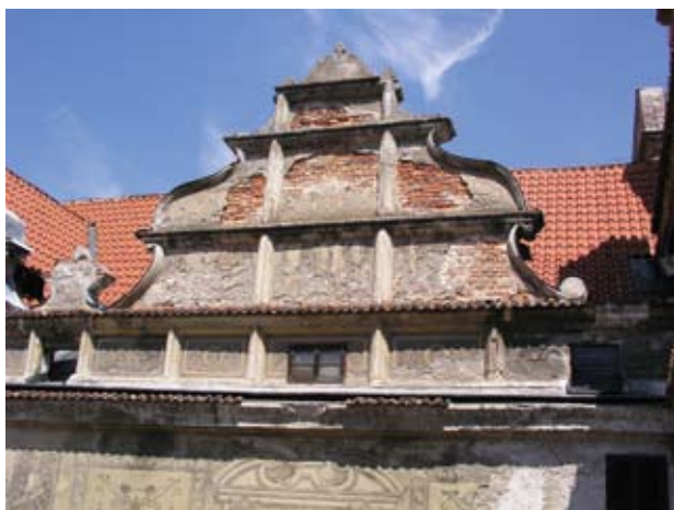
Obr. 14., 15. Horšovský Týn, zámek. Dvorní průčelí východního křídla, první štít od jihu. Stav před obnovou a po obnově.

V roce 2000 začalo statické zajišťování jihozápadní věže podezdíváním jejích základů a byla zahájena obnova kanalizačního a odvodňovacího systému. Práce navrhovala a prováděla společnost SPELEO ve spolupráci s Ing. J. Rinešem při statickém zajištění základů věže. V rámci těchto prací byl také rozřezán mostní nosník v krovu západního křídla, jehož dilatační pohyby vytlačovaly oba štíty sedlové střechy ven do té míry, že hrozilo jejich zřícení. Došlo k vyklizení deponitáře a odlehčení konstrukce. Rekonstrukce kanalizace a obnova odvodňovacích a odvětrávacích systémů proběhla v období let 2001–2002. Zvláštní