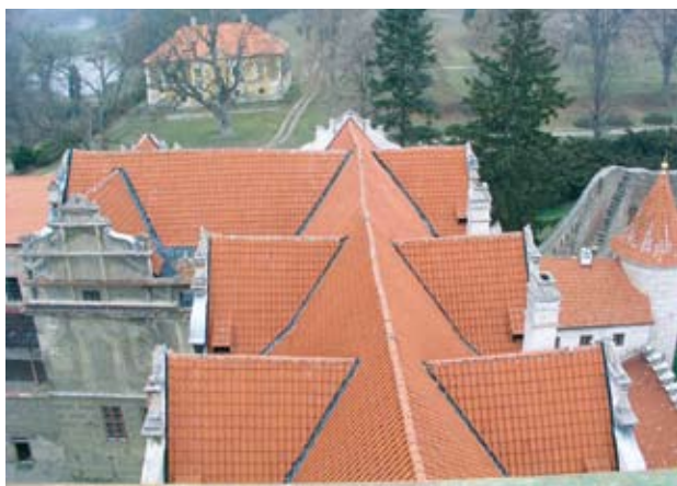
Obr. 11. Horšovský Týn, zámek. Střechy východního křídla před obnovou. (Foto M. Solař, 2003)