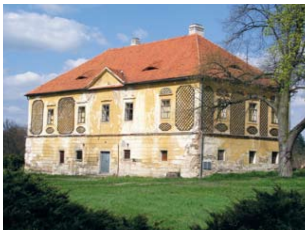
Obr. 2. Horšovský Týn, zámek. Tzv. Vdovský dům nebo také Muzeum (podle posledního využití) v zámeckém parku. Budova renesančního původu je již řadu let bez využití a chátrá. Využití brání špatný stavební stav a absence přípojek inženýrských sítí.

nádvoří, k nimž se ze západu přimyká druhé nádvoří se samostatně stojící budovou purkrabství a takzvanou Vejrovnou. V parku, ohrazeném kamennou zdí, stojí několik staveb. Nejvýznamnějšími jsou takzvaný Vdovský dům (obr. 2), glorieta a centrální stavba, o níž se předpokládá, že nahradila zaniklou loretánskou kapli. S výjimkou sýpky a míčovny spravuje celý areál Národní památkový ústav. Kromě toho se správa zámku stará ještě o kostel v Horšově a areál kostela sv. Anny u Horšovského Týna, které oba spadají rovněž pod Národní památkový ústav, ale nejsou součástí areálu národní kulturní památky. Sýpka a míčovna patří Městu Horšovský Týn.