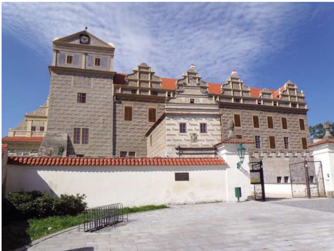
Obr. 1. Horšovský Týn (okr. Domažlice), zámek. Celkový pohled na obnovenou východní fasádu z náměstí.

Areál národní kulturní památky zahrnuje vlastní zámek (původně středověký hrad pražských biskupů), zahradu a park o rozloze přibližně 40 ha, sýpku a míčovnu. Zámek se skládá ze čtyř nepravidelných křídel kolem čtvercového