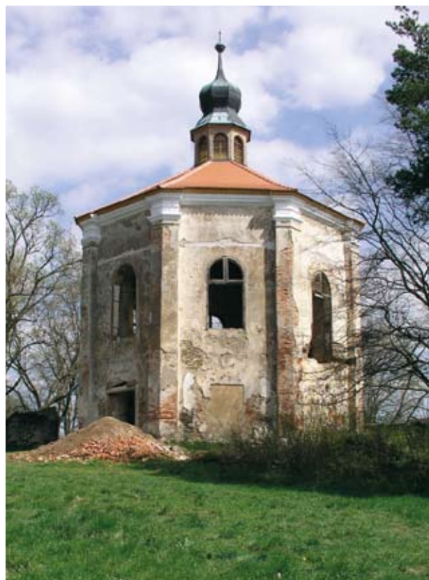
Obr. 10. Horšovský Týn, zámek. Zahradní pavilon (tzv. loretánská kaple), stav po opravě střechy. V roce 2004 strhli zloději ze střechy plech. Střechu se podařilo téhož roku opravit.

Při prohlášení areálu zámku v Horšovském Týně za národní kulturní památku byla v běhu obnova Erbovního sálu a přílehlých salonků. Dokončit se jí podařilo v roce 2000. V jejím rámci bylo u Erbovního sálu vybudováno sociální zázemí, které umožňuje využívat tento sál pro kulturní a společenské akce. První obnovou zahájenou v režimu národní kulturní památky se stalo částečné