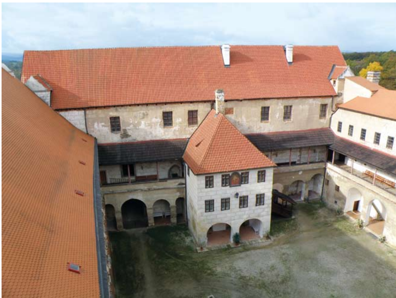
Obr. 4. Horšovský Týn, zámek. Pohled do prvního nádvoří z jihovýchodní věže. Vlevo vidíme obnovenou střechu jižního křídla. Ve středu je západní křídlo, do jehož krovu byl v osmdesátých letech 20. století vložen nedilatovaný ocelový nosník, který vytlačoval oba střešní štíty směrem ven a musel být rozřezán. Vpravo nad ochozem je Lusthaus (západní část) s obnovenou střechou.