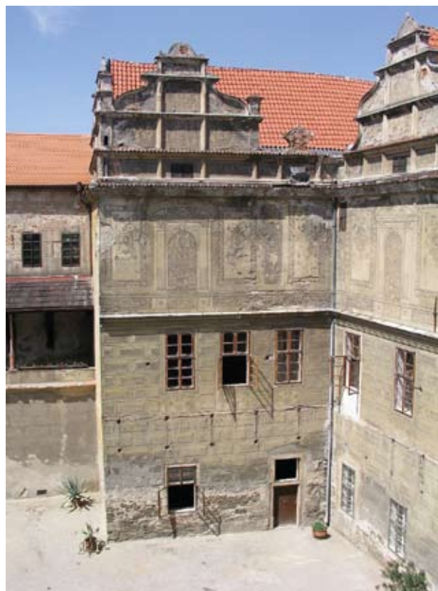
Obr. 16., 17. Horšovský Týn, zámek. Severní část východního křídla, pohled na prvním nádvoří. Stav před obnovou a po obnově.

V roce 2005 začala oprava střeš, krovů a fasád vstupního východního křídla. Východní křídlo s oběma nárožními sekcemi se od ostatních křídel odlišuje vysokými štíty a figurální sgrafitovou výzdobou fasád. V předchozích letech se obecně uplatňovalo pravidlo „nejprve střechy a havárie, fasády počkají“. V tomto případě však byly štíty (následkem zásahu v osmdesátých letech 20. století) nedostatečně kotveny a hrozilo jejich zřícení. V případě pádu štítu do nádvoří v turistické sezóně hrozila tragédie. Nebezpečí nebylo teoretické. Podle pamětníků se