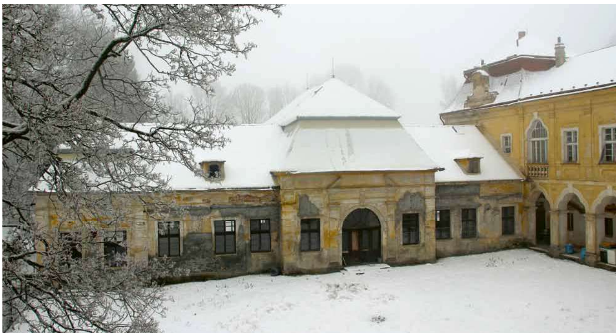
Obr. 12. Velké Dvorce, areál zámku. Hospodářské objekty – jižní křídlo, přiléhající k hlavní budově. Pohled od východu.