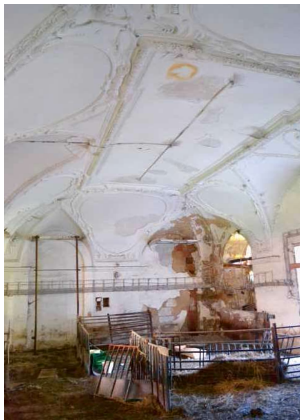
Obr. 14. Velké Dvorce, zámek. Klenutý sál se štukovou výzdobou v přízemí hlavní budovy, využívaném jako stáj pro dobytek.

ustájení dobytka apod. Hospodářská stavení v prostoru čestného dvora byla lépe udržována, zejména pro potřeby administrativy státního statku, ale byla zde také restaurace a prodejna Jednoty. 72 V období let 1950–65 byla na zámku národní, resp. od 1. 9. 1960 devítiletá škola s pěti postupnými ročníky. 73 Fungovala zde rovněž mateřská škola. 74