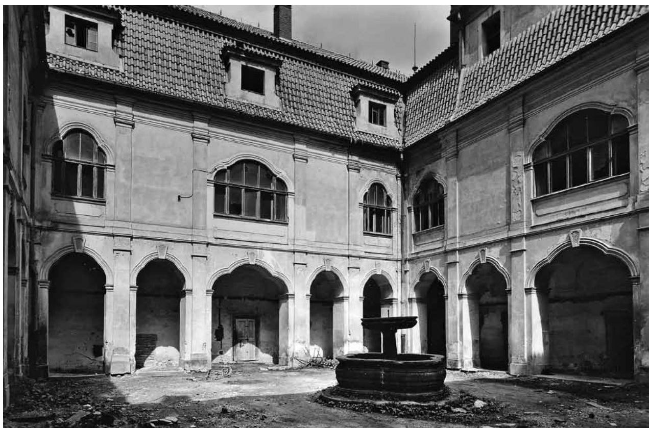
Obr. 9. Velké Dvorce, zámek. 50. léta 20. století. Pohled do nádvoří hlavní budovy.

majetky dobře starala. Existují záznamy, že zámky i hospodářské objekty byly za jejího života udržovány v dobrém stavu, mnohé byly v období let 1822–1826 stavebně upravovány. 45 Zámek ve Velkých Dvorcích těmito záznamy přímo zmiňován není; lze předpokládat, že se úpravy týkaly zejména interiéru a běžné údržby. Podle ocenění majetku z roku 1826, po hraběncině smrti, se dozvídáme, že zámek byl ve výborném stavu. 46