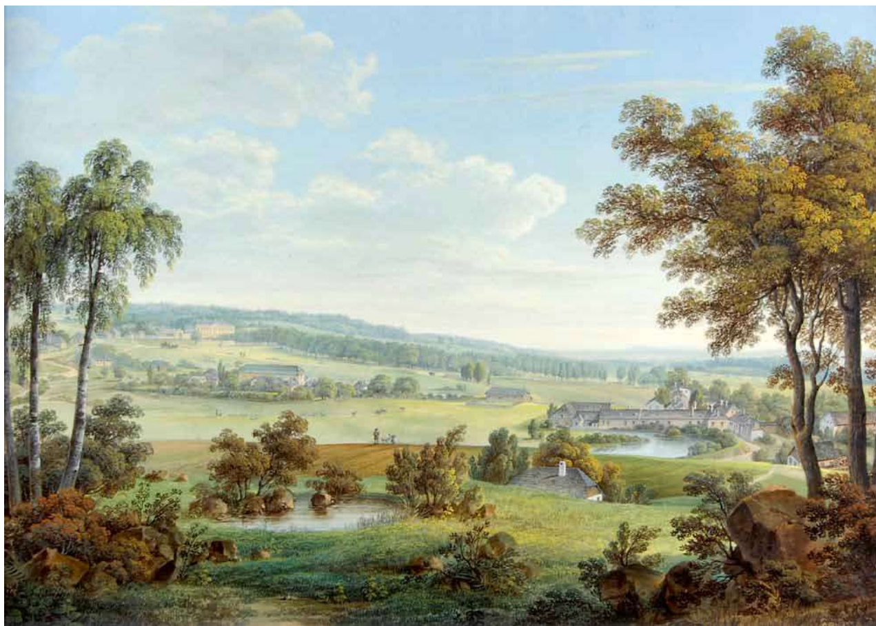
Obr. 5. Anonym: Velké Dvorce. Polovina 19. stol. Kvaš, 65 × 81 cm.