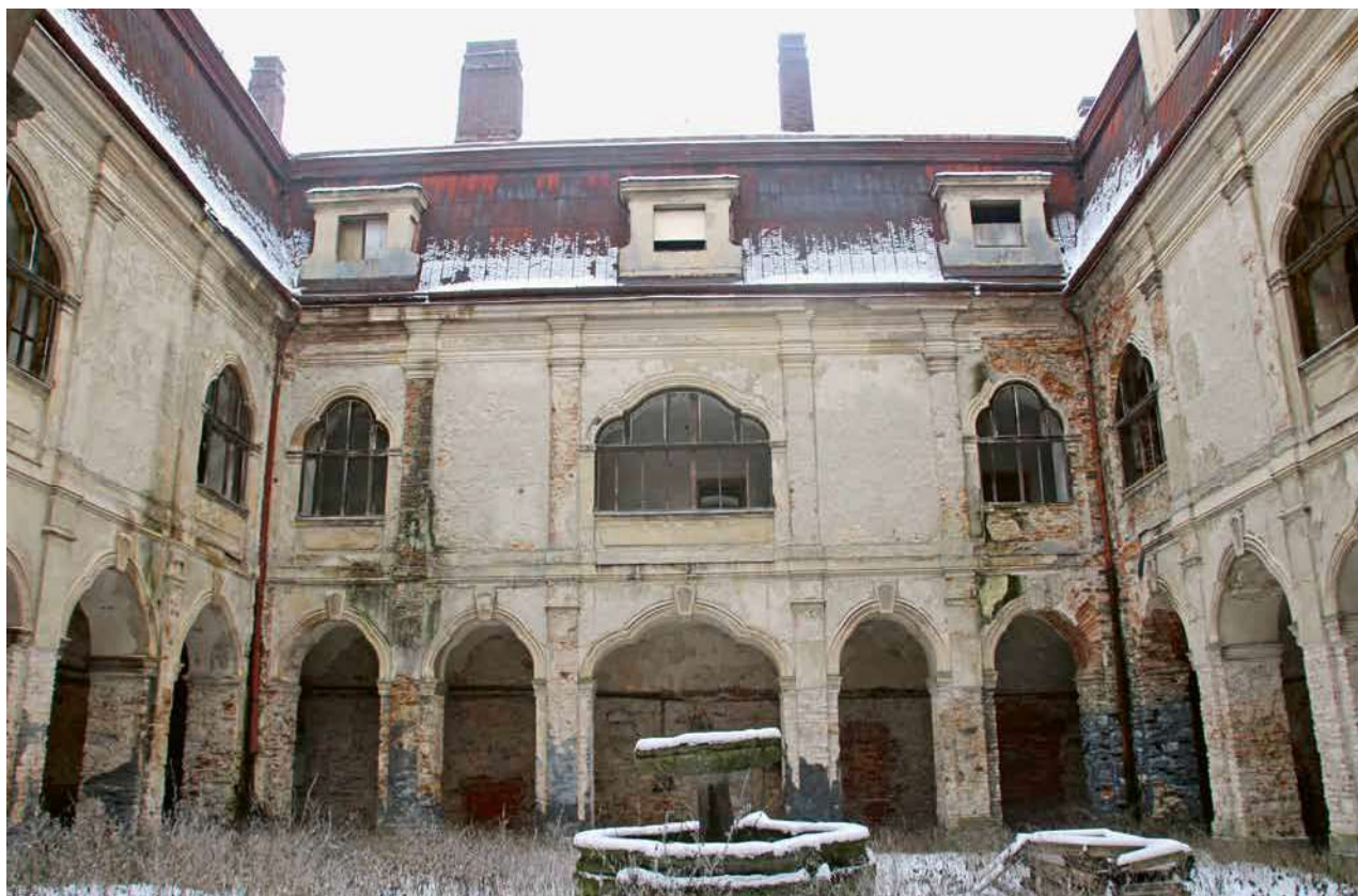
Obr. 10. Velké Dvorce, zámek. Pohled do nádvoří hlavní budovy. (Foto Z. Gersdorfová, 2014)

není znám. Znázorňuje celkový pohled na Velké Dvorce od jihu. 54 V pravém dolním rohu je zachycen vrchnostenský dvůr ( Alt Schloss ) společně s mlýnem a rybníkem, vlevo v pozadí, téměř na horizontu, vidíme zámek s hospodářskými budovami. Velmi výrazná je dodnes dochovaná kočárová cesta k zámku v ose parku, lemovaná již tehdy vzrostlými stromy, rovněž tak je patrná silnice směrem k Přimdě. Tento obraz představuje jeden z mála ikonografických pramenů, který znázorňuje zámek ve Velkých Dvorcích před jeho neobarokní přestavbou.