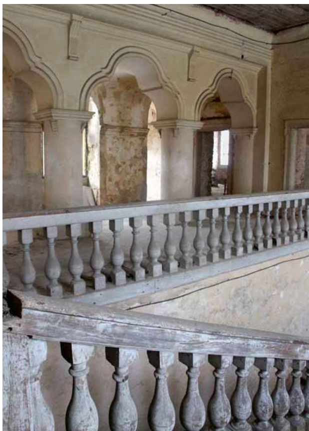
Obr. 13. Velké Dvorce, zámek. Interiér hlavního schodiště.