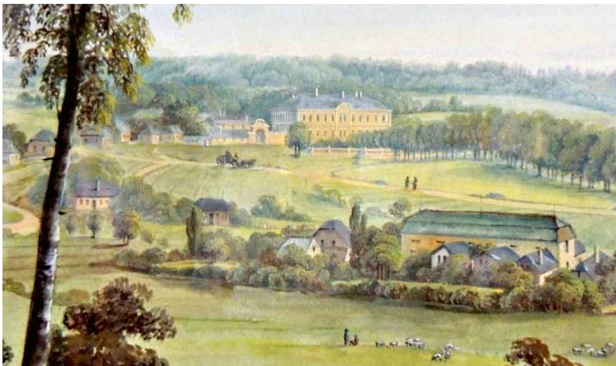
Obr. 6. Anonym: Velké Dvorce. Polovina 19. stol. Kvaš, 65 × 81 cm. Výřez se zámkem.

mladší pseudobarokní úpravy zachovalo dodnes. Podle nejstarší veduty zámku od Friedricha Bernharda Wenera z roku 1752 to nebylo slohově příliš pokročilé dílo. Rovněž tak vnitřní dispozice neukazuje na velkou tvůrčí invenci projektanta, jímž snad mohl být jeden z mnoha italských architektů a stavitelů, kteří v Čechách působili v období po třicetileté válce. Z. Knoflíček o italském autorovi nepochybuje, o čemž, podle Z. Knoflíčka, vypovídá čtyřkřídlá dispozice s centrálním nádvořím. Hospodářská křídla, která tvoří čestný dvůr vedle hlavní zámecké budovy, vznikla později ( terminem ante quem je výše zmíněná Wernerova veduta). Jejich vznik lze předpokládat v době asi nedlouho po dokončení hlavní zámecké stavby, jak o tom svědčí velkoformátové cihly, používané ještě v době raného baroku. 29 Zámek sám je oproti tomu proveden převážně z lomového a smíšeného zdiva.