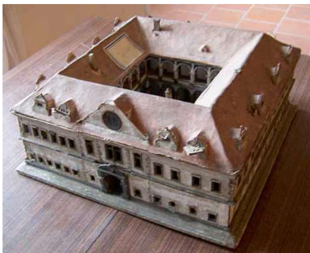
Obr. 3. Adolf Maurus Pilati(?): Model zámku. 1788. Dřevo, papír. Pohled shora a na hlavní průčelí. Tento rozkládací model byl považován za model zámku ve Velkých Dvorcích.

se dochovaly materiály k plánované adaptaci neobarokní zámecké budovy na kulturní a společenské centrum. Jsou uloženy včetně plánové dokumentace v archivu územního odborného pracoviště v Plzni Národního památkového ústavu, a rovněž na stavebním odboru Městského úřadu v Boru u Tachova.