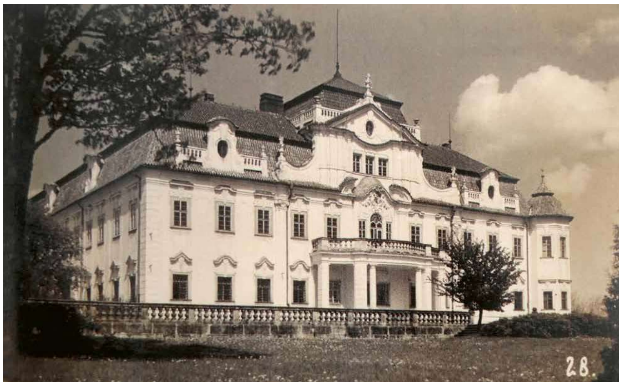
Obr. 8. Velké Dvorce, zámek. Hlavní budova. 1931. Pohled od jihovýchodu. Stav po neobarokní přestavbě.

Po jeho smrti byl pořízen první podrobnější popis zámku ve Velkých Dvorcích: V přízemí zámku brána vjezdu, klenuté podloubí po všech stranách vnitřního dvora, uprostřed nádvoří kašna. Všechny místnosti přízemí jsou klenuté: velká a malá kuchyň, deset kvelbů s podlahami z prken, šest kvelbů dlážděno cihlami – z toho jeden užíván jako domácí kaple, druhý jako sakristie. Do suterénu vedou kamenné schody do sklepa 4 sáhy dlouhého, 2 sáhy širokého. 1. patro – přístupné po velkém dřevěném hlavním schodišti, vzadu je schodiště šnekové, dřevěné. V patře je osmnáct pokojů, všechny mají rákosové stropy a podlahy z prken. Na půdu vede točité dřevěné schodiště, půda je celá volná – průchozí, podlaha z mazaniny, krov vlašský, střecha kryta šindelem. Na půdě hodinový stroj. K zámku náleží: prádelna, bělidlo, zvonice, stáj pro koně – dvacet dva státní, byt podkoního s vozovou kůlnou, jízdnou, zámecká kovárna, dřevěná kůlna, střelnice, dřevěný gloriét, skleník, stáje hříbat. Zámek se všemi budovami je v dobrém stavu, jeho cena 6000 zlatých. 41