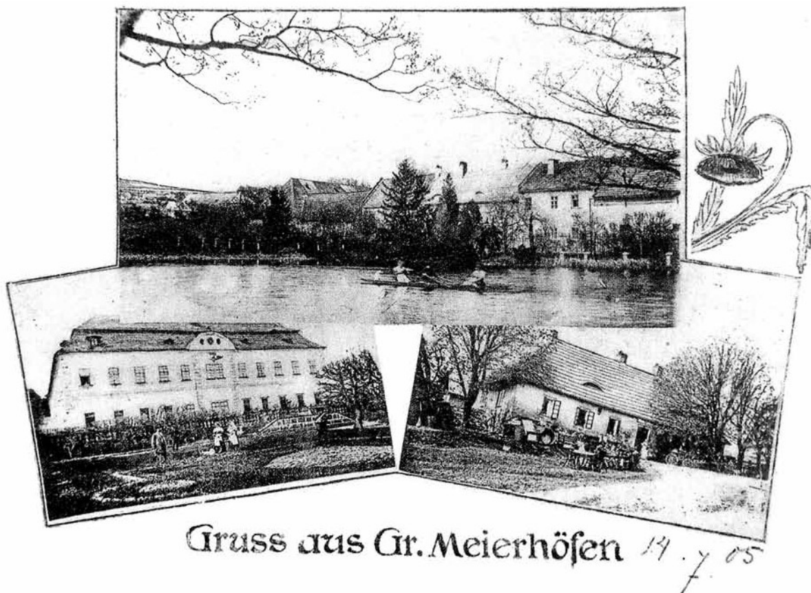
Obr. 7. Velké Dvorce (okr. Tachov), zámek. 1905. Vlevo dole pohled na východní průčelí hlavní zámecké budovy.

1731. Není přesně známo, co vše požár způsobil; je jen doloženo, že žár ještě zvýšila podlaha z pálených dlaždic v místnostech. 36 Podle sondážního průzkumu došlo tehdy k dílčím úpravám interiérů a zazděny byly nádvořní arkády v prvním patře. Úpravy sledovaly zvýšení obytného a tepelného komfortu jednotlivých místností. Z této etapy se dají očekávat nálezy barokních nástěnných maleb a další výzdoby interiérů. 37