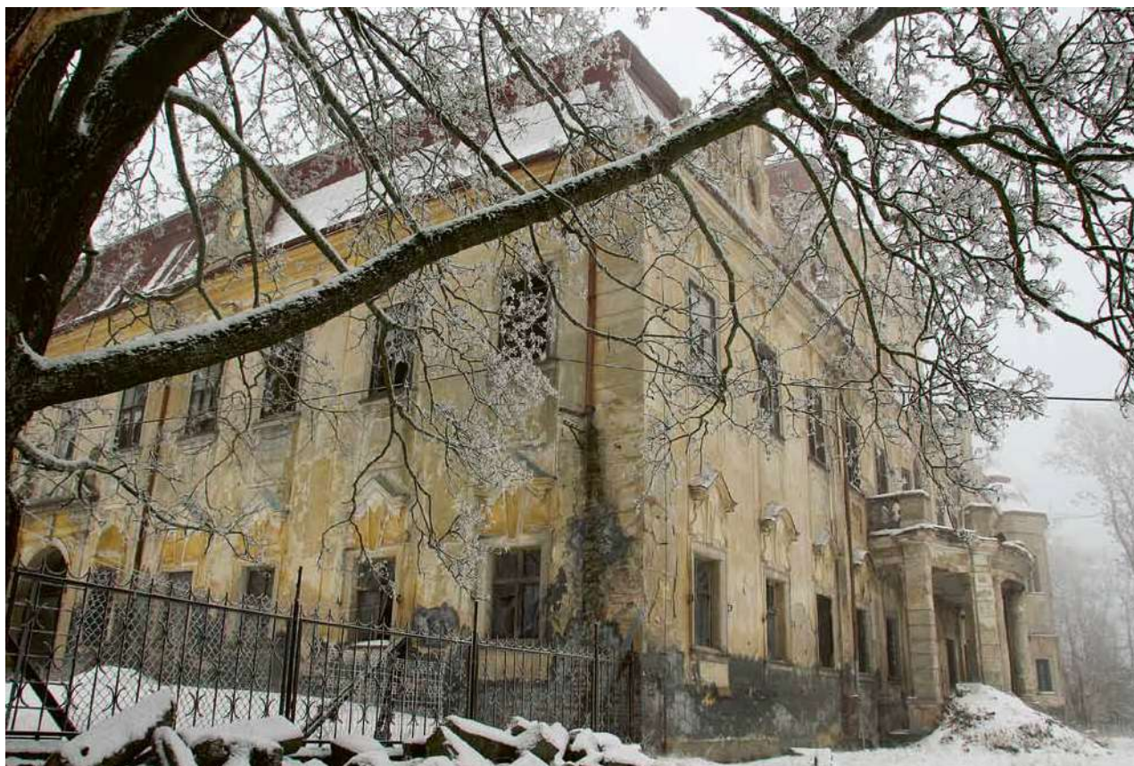
Obr. 11. Velké Dvorce, zámek. Hlavní budova. Pohled od jihu. (Foto Z. Gersdorfová, 2014)

ostatně odkazuje na typologický eklektismus, hlavní trend v architektonické produkci v Čechách na počátku 20. století, kdy v celkové výzdobě stavby vévodí subjektivní zacházení se stylovými předlohami. 58