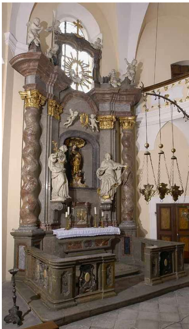
Obr. 8. Přeštice (okr. Plzeň-jih), kostel Nanebevzetí Panny Marie, boční kaple sv. Barbory. Oltář sv. Barbory. (Foto R. Kodera, 2009)