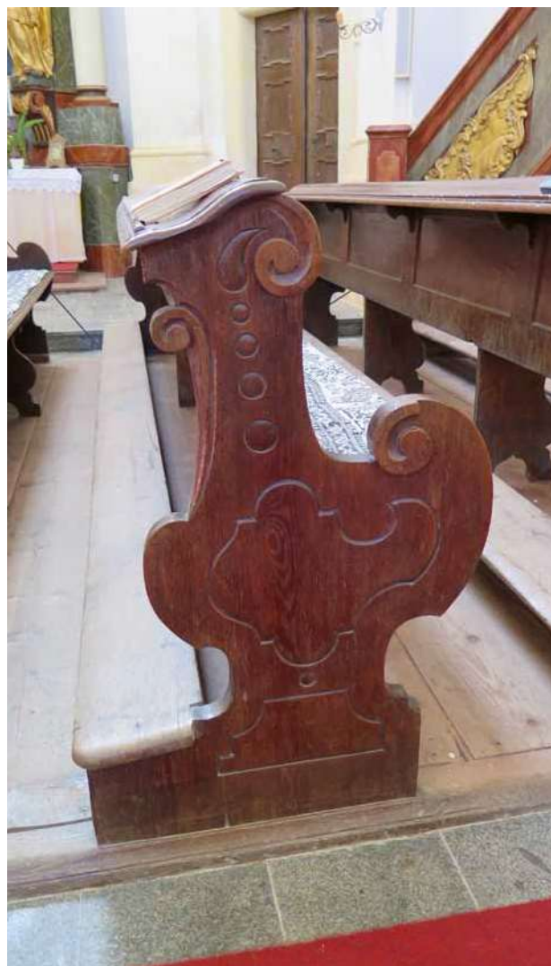
Obr. 11. Nicov, kostel Narození Panny Marie. Chrámová lavice, čelní strana.

Ani kazatelna nijak typologicky nevybočuje z dobové tvorby. Svými výtvarnými kvalitami se ale řadí jistě k těm lepším dílům svého druhu. Řečniště má celkem běžný tvar s lehce, nedramaticky křivkově dynamizovaným půdorysem s křivkovým protažením směrem dolů, na vnějším obvodu se soškami dvou andlíků držících starozákonní desky a rozevřenou knihu Nového zákona. Mezi soškami andlíků i po jejich stranách se nacházejí na vnějším obvodu řečniště i na schodišti poměrně ploché řezané kartuše s motivy téměř rokají, které jsou podobně jako figurky andlíků zlacené. Baldachýn je opatřen plastickou, půdorysně i v siluetě křivkově dynamizovanou, poměrně vysokou římsou. Dole pod baldachýnem na zadní stěně řečniště je patrná vyřezávaná, zlacená rokajová kartuše, po bocích nahoře řezané závěsy, přidržované po každé straně soškou andílka. Jak závěsy, tak figurky andlíků jsou zlacené. Zlacené symbolické sošky evangelistů stojí také na římsě baldachýnu, nad jehož křivkovým vytažením ve vrcholu se nalézají na glóbu o něco větší zlacené soška Panny