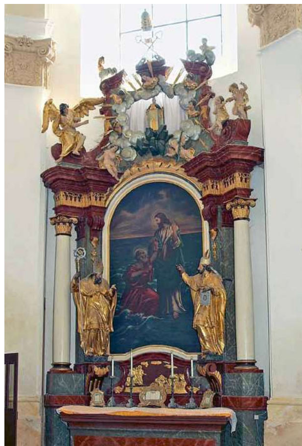
Obr. 5. Nicov, kostel Narození Panny Marie. Boční oltář sv. Petra.

k hlavnímu oltáři, kadidelnice a rovněž konvičky s tácky. U konviček s tácky jejich původní počet v roce 1751 neznáme. Podobně není jasné, kolik svícňů z kterého oltáře bylo rekvírováno. Zachovat se měla monstrance a lampička věčného světla. Možná i gloria , pokud to ovšem nebyla mezi rekvírovanými předměty uvedená andělčí hlavička na obláčku (pravděpodobně pějící slávu Bohu); termínu v době baroka nejspíš jednoznačně srozumitelnému dnes sotva rozumíme. 7