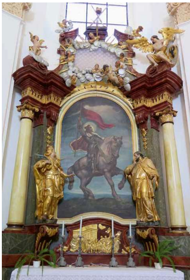
Obr. 4. Nicov, kostel Narození Panny Marie. Boční oltář sv. Václava.