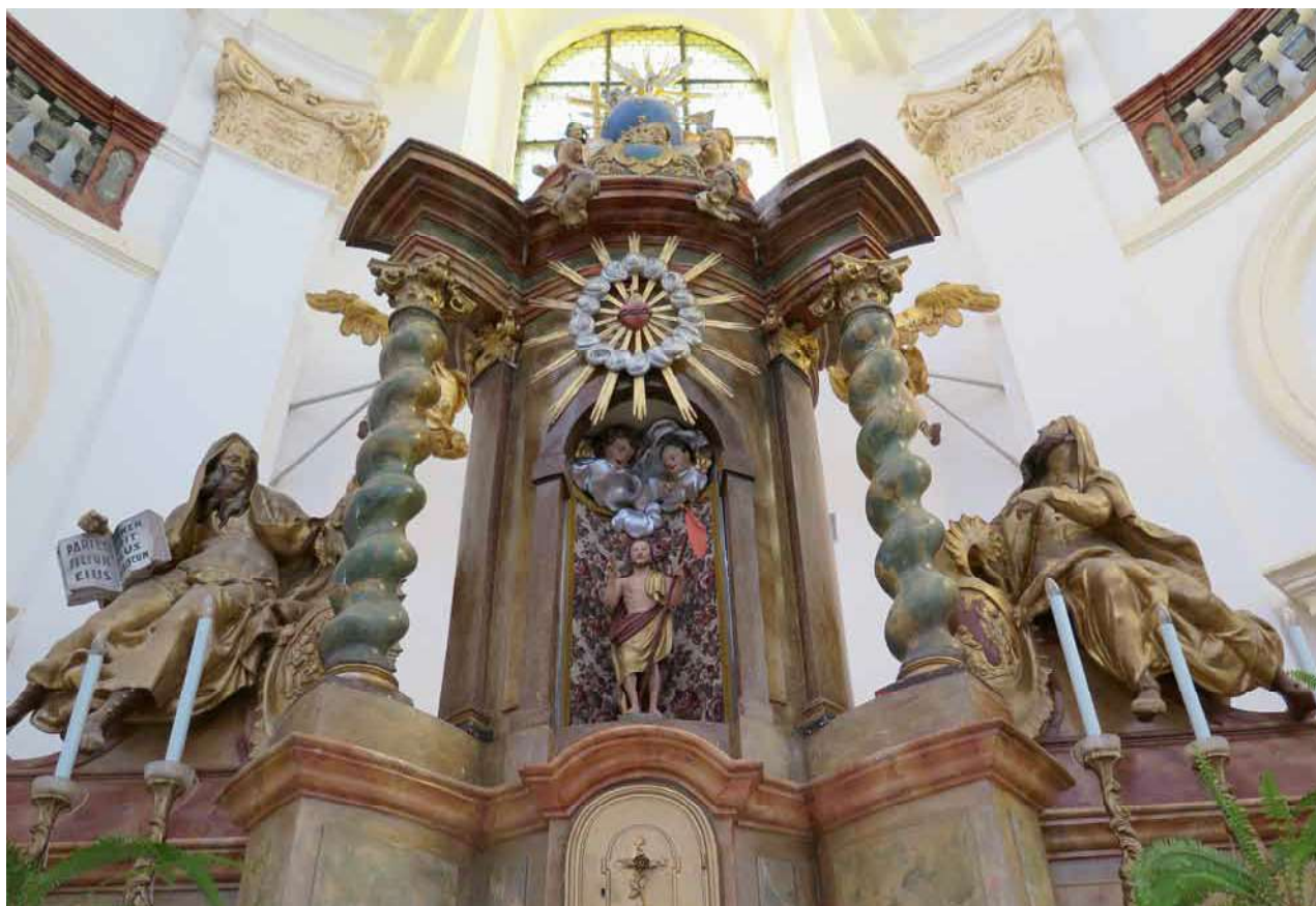
Obr. 3. Nicov, kostel Narození Panny Marie. Svatostánek hlavního oltáře z pohledu.

a zaplacený až v roce 1751, spolu s dalším zařízením kostela. Kromě dvou bočních oltářů to byla nová kazatelna, Svatá Trojice na velký oltář (sousedí Nejsvětější Trojice na římské barokní skříňce, tedy na horním dílu hlavního oltáře nad svatostánkem), a dále klenotnické výrobky – šest stříbrných svícňů, monstrance, kadidelnice, konvičky s tácky, lampička věčného světla a gloria (?). Vše vyrobili nejmenovaní pražští umělečtí řemeslníci dle baumistra Dienzenhöffera . 4