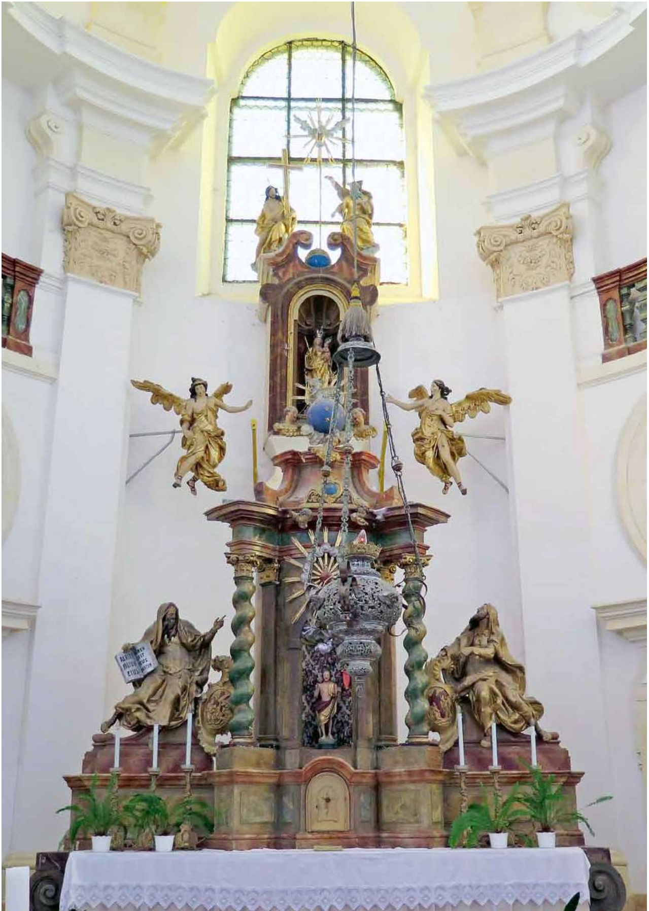
Obr. 2. Níčov, kostel Narození Panny Marie. Hlavní oltář.