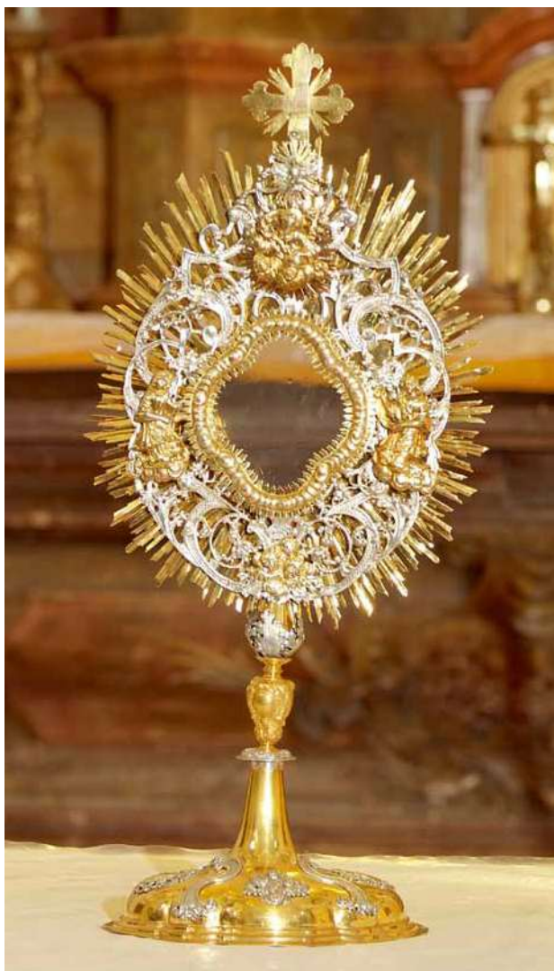
Obr. 10. Nicov, kostel Narození Panny Marie. Monstrance.

štafírované na způsob mramoru stejnými doplňkovými barvami jako hlavní oltář.