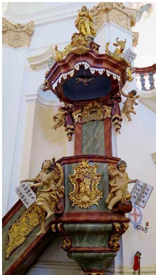
Obr. 9. Nicov, kostel Narození Panny Marie. Kazatelna.

že jeho současná barevnost je autentická (byť dosud nebyl proveden restaurátorský průzkum podobně jako u ostatního chrámového mobiliáře). Tato barevnost potvrzuje výslednou uměleckou jednotu díla ve vnitřně vyvažujících se kontrastech – kromě zlaté barvy, užitě u některých menších prvků, která má zdůraznit jejich klíčový ideový význam, jsou tu použity jako základní barevný akord barva zelenomodrá a hnědavé, až hnědočervené tóny, tedy dvě barvy navzájem doplňkové, ideálně kontrastující barvy.