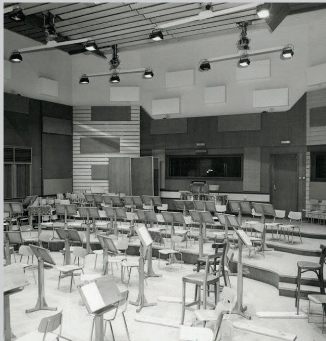
Studiová část, velké hudební studio (studio I).

Budova svým architektonickým pojetím reprezentuje pozdní (po-válečný) funkcionalismus, je jedním z jeho nejkrásnějších a snad i nejkrásnějších příkladů u nás. Charakteristická je pro ni horizontalita, podpořená pásovými okny se svislým členěním a posuvnými díly, a též keramický obklad béžové barvy. Přísný funkcionalismus je uvnitř budovy změkčen uplatněním křivek v půdorysu některých stěn, schodišťových stupňů, koutů místností, pultů nebo dokonce bazénku organického tvaru v odpočívárně pro umělce. Za povšimnutí stojí motiv profilované římsy ukončení stropní desky či dekorativní zábradlí. Povrchy dlažeb a obkladů mají teplé barvy, dřevěné obklady a vestavěný nábytek přiznaný přírodní povrch. Budova uvnitř působí světle a přehledně.