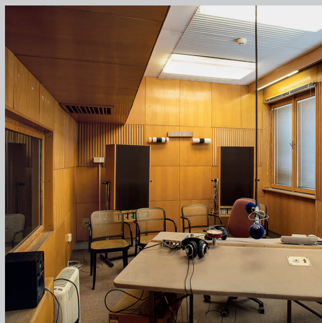
Studiová část, hlasatelna v 1. patře.

Po obnovení samostatného celodenního živého vysílání po listopadu 1989 se umístění vysílacích pracovišť v 1. patře nad zadním vstupem ukázalo jako nepraktické a také nevyhovovala jejich velikost. Živé vysílání bylo proto v roce 2005, po dokončení opravy vysílacích studií v přízemí vstupního křídla, přesunuto. Vysílací pracoviště „nad garážemi“ byla ponechána v původní podobě a později příhodně začleněna do expozice o historii plzeňského rozhlasu. Skutečnost, že budova vznikla jako jediná v Československu přímo pro rozhlasové účely, jimž slouží dodnes, a také proto, že se jedná o kvalitní příklad poválečné architektury, se stala důvodem, proč byla v roce 2002 prohlášena kulturní památkou. Tato událost byla spojena se slavnostním odhalením informační tabulky, což je dokladem pozitivního přístupu „rozhlasáků“ k památkové ochraně budovy.