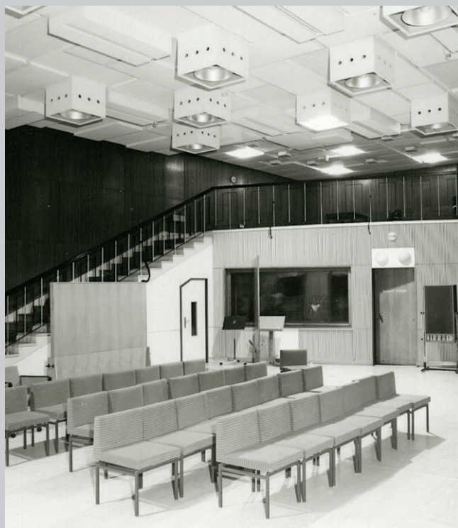
Studiová část, velké činoherní studio (studio III).

Budova svým architektonickým pojetím reprezentuje pozdní (po-válečný) funkcionalismus, je jedním z jeho nejkrásnějších a snad i nejkrásnějších příkladů u nás. Charakteristická je pro ni horizontalita, podpořená pásovými okny se svislým členěním a posuvnými díly, a též keramický obklad béžové barvy. Přísný funkcionalismus je uvnitř budovy změkčen uplatněním křivek v půdorysu některých stěn, schodišťových stupňů, koutů místností, pultů nebo dokonce bazénku organického tvaru v odpočívárně pro umělce. Za povšimnutí stojí motiv profilované římsy ukončení stropní desky či dekorativní zábradlí. Povrchy dlažeb a obkladů mají teplé barvy, dřevěné obklady a vestavěný nábytek přiznaný přírodní povrch. Budova uvnitř působí světle a přehledně.