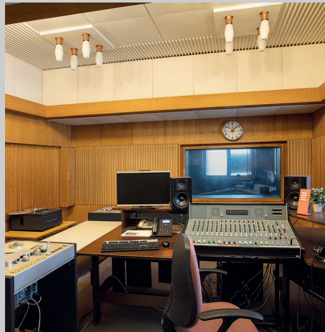
Studiová část, režie vysílacího pracoviště v 1. patře.