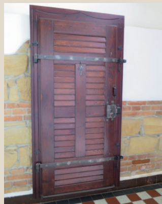
Původní dveře celý.

Během své 140 let trvající existence areál prodělal řadu stavebních úprav a modernizací. V roce 1906 v západním cípu areálu postavila plzeňská firma Müller a Kapsa uzavřené hospodářství, ve kterém pracovali odsouzení a které mělo zásobovat věznicí masem a mlékem (zbořeno 2008). Ve 20. letech 20. století byla např. vybudována splašková kanalizace, provedeno napojení na městský vodovodní řad a také dokončena první část elektrifikace celé trestnice (čímž původní ústavní plynárna přestala plnit svoji funkci).