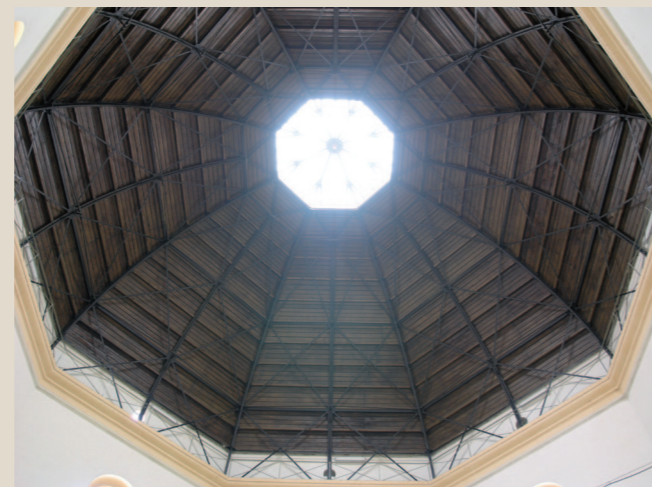
Interiér centrální haly, pohled do konstrukce kupole.

okosenými nárožími na straně souběžné s dnešní silnicí do Klatov. V centru stojí mohutná zděná osmikřídlá stavba s historizujícími eklektickými fasádami, jejíž střed tvoří převýšená osmiboká hala završená ocelovou nýtovanou kupolí s vrcholovým světlíkem. Z tohoto centrálního prostoru paprskovitě vystupují jednotlivá dvoupatrová křídla připojená ke středové hale užšími klenutými