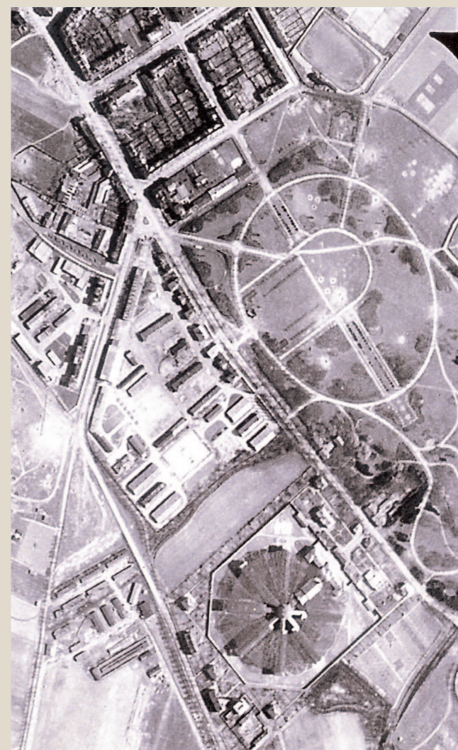
Unikátní letecký snímek pořízený britským špiónážním letounem dne 9. 4. 1945 z výšky 23 000 stop (cca 7 km). Ve spodní části snímku areál věznice, hlavní budova byla po dobu spojeneckých náletů zakryta maskovacím nátěrem a sítěmi.