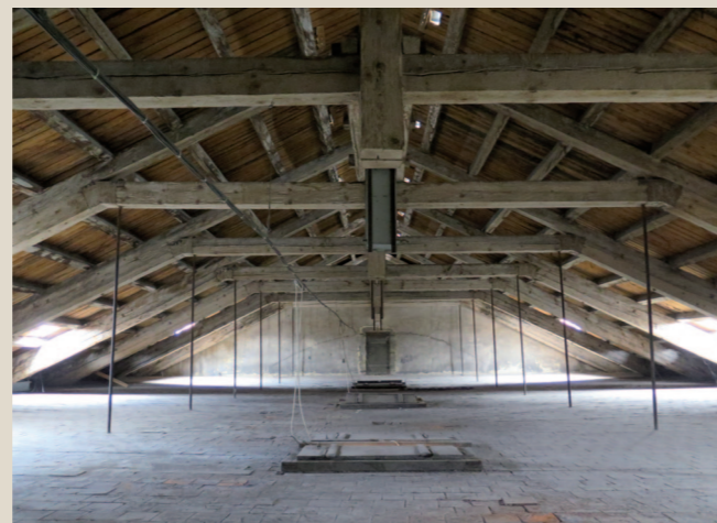
Konstrukce krovu nad kaplí.