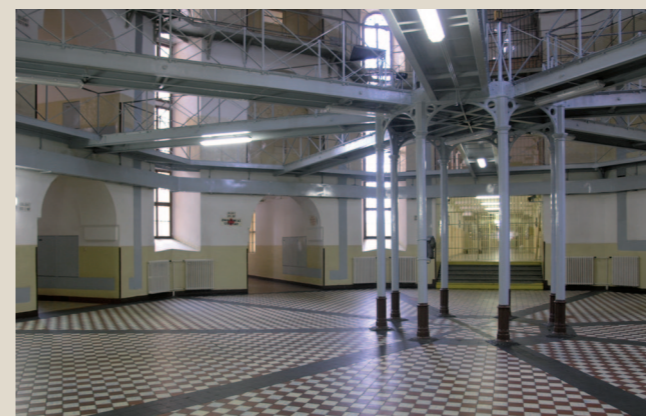
Interiér centrální haly, pohled z přízemí na původní litinové sloupky pod centrální pozorovatelnou a soustavu lávek.

chodbami. Původně byla tři křídla určena pro samovazbu, čtyři pro společnou vazbu, jihovýchodní křídlo obsahovalo kapli a k němu ještě kolmo přiléhá dvoupatrová průčelní budova velitelství. Vězeňská kaple se sakristií, vybavená oltářem s cenným obrazem Kristus jako dobrý pastýř od malíře Emila Lauffera, varhanami