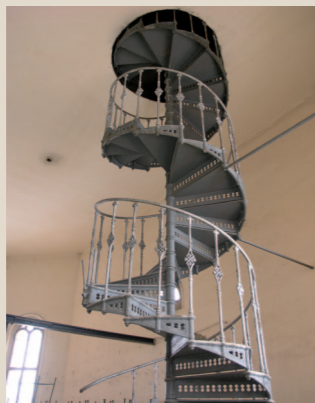
Původní litinové vřetenové schodiště v závěru bývalé kaple.