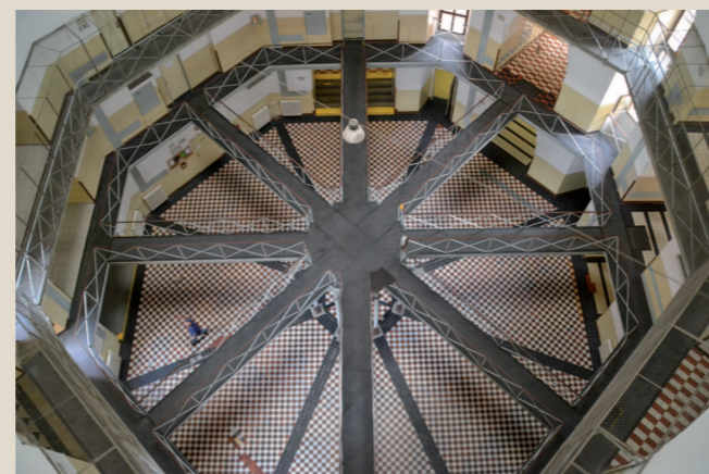
Interiér centrální haly, pohled z ochozu v patě kupole na původní soustavu lávek s centrální pozorovatelnou. (Foto S. Plešmíd, 2017)

Původní areál byl přísně symetrický podle kompoziční osy orientované ve směru jihovýchod – severozápad a kolmé k císařské/státní silnici z Plzně do Klatov (dnes Klatovská třída). Budovu věznice obklopuje vysoká ohradní zeď (původně s 12 strážnicemi), vymezení přibližně čtvercový půdorys se dvěma výrazně