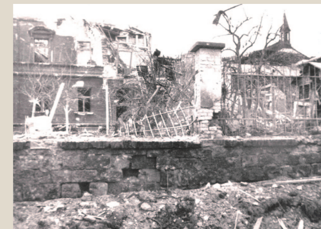
Úřednický dům poškozený výbuchem letecké bomby po spojeneckém náletu v roce 1944, v letech 1947–1949 byl na jeho místě postaven stávající dům čp. 2866, 2867.

a lavicemi, byla v 50. letech 20. století zrušena. V příčném průčelním křídle se mimo jiné nacházela nemocnice, knihovna a učebny, v přízemí pak pekárna (od roku 1884 do konce 20. století). Prostor okolo budovy věznice až k hlavní ohradní zdi býval volný, území vymezené křídly vyplňovaly kruhové plochy se zahradnickou úpravou, po jejichž obvodu vykonávali vězni vycházky. Jediná vstupní brána je situována ve středu východní ohradní zdi a zakomponována v předsunutém přízemním objektu jako průjezd. Východní předpolí věznice má protáhlý obdélný půdorys a je vymezené z části ještě původním oplocením. Podle situace z roku 1878 v tomto prostoru stálo celkem šest domů a vstupovalo se do něj od jihovýchodu (v ose vstupní brány) bránou v oplocení. Po stranách bývalé brány stále stojí dva původní symetricky umístěné domky pro vrchní dozorce (čp. 2909 a 2910). V nárožích předpolí se nachází další původní objekty: obytné domy pro dozorce (čp. 2868 a 2911), které jsou však dochovány pouze v hmotovém řešení, jinak jsou již zbaveny dobových architektonických prvků (okna, fasády).