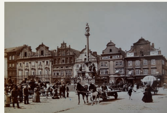
Mariánský sloup v Plzni na fotografii z doby před rokem 1890.

zentující řeholní společenství byli umístěni na boční strany. Jedná se o jezuitského misionáře sv. Františka Xaverského s křížkem v pravici a sv. Petra z Alkantary, v českém barokním sochařství poměrně málo zobrazovaného asketu a reformátora františkánského řádu; jeho socha na způsob stojícího bezvousého světece držící ob-