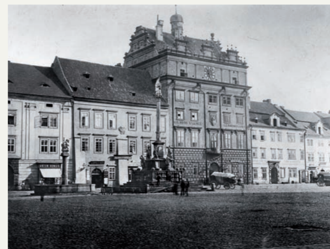
Severní část náměstí v Plzni s mariánským sloupem v prostoru mezi kostelem sv. Bartoloměje a radnicí. Foto z doby kolem roku 1865.

Podstavec sloupu je hranolový, na čtvercovém půdorysu, třítětákový. V nárožích druhé etáže je obohacen čtyřmi zvlášť připojenými pilíři, které slouží jako podstavce pro čtveřici soch, osazených diagonálně vůči svislé ose sloupu a pocházejících z doby jeho vzniku. Tuto etapu sochařské výzdoby zhotovil Kristián Wiedemann. Tvoří ji socha patrona města, apoštola sv. Bartoloměje, obrácená směrem k městskému chrámu (světec je zobrazen se svými obvyklými atributy – s vlastní staženou kůží a s nožem v levici), socha