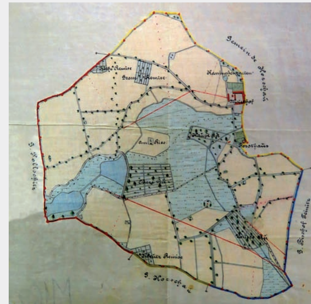
Horšovská obora – bažantnice. Plán z roku 1910.