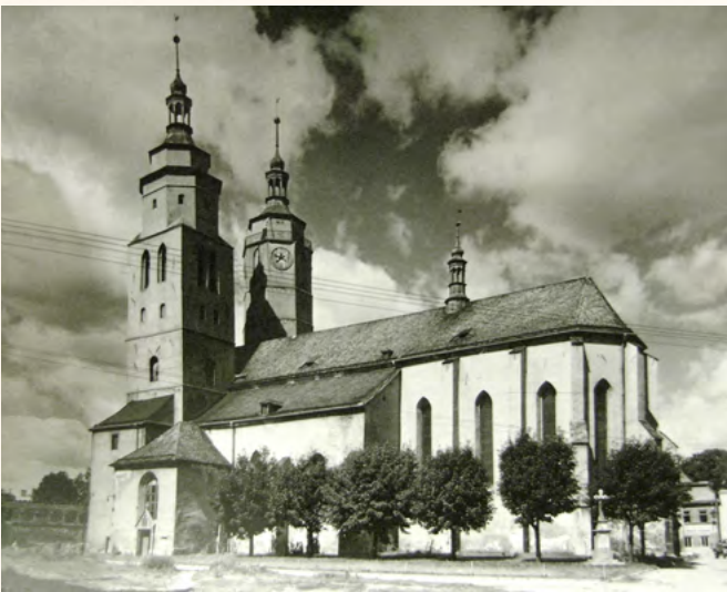
>> Kostel sv. Martina – pohled od jihu, dobová fotografie, Josef Solnický, 1957, SZM, fotografické pracoviště, sign. B5736.