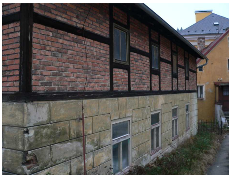
Hrázděnka u divadla Husovka, KV

V roce 2016 bylo zažádáno o finanční příspěvek z rozpočtu Karlovarského kraje. Byl poskytnut na dva projekty: Pomník F. Schillera – 80.000,- Kč Hrázděnka u divadla Husovka – 60.000,-