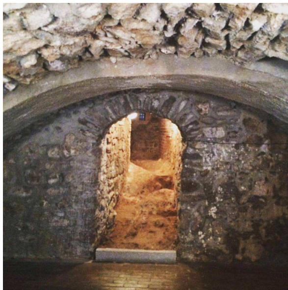
Sklepení Zámecké věže