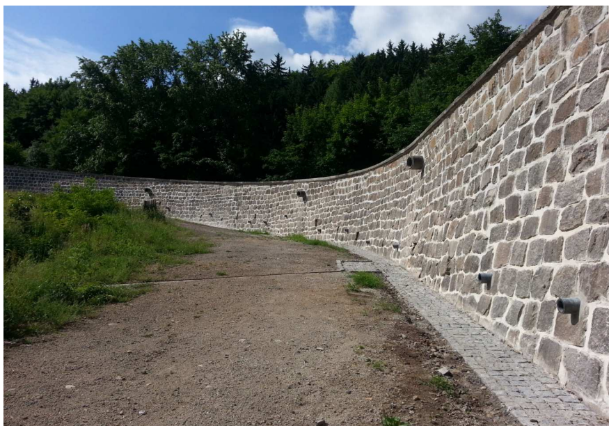
Nemovitá kulturní památka Stará pražská silnice – pohled na opěrnou zeď silnice.