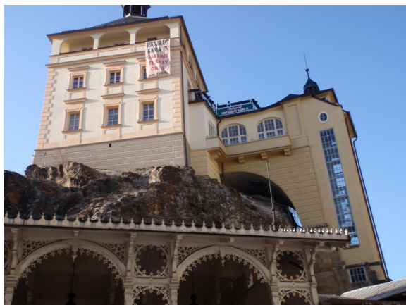
Zámecká věž – pohled os tržní kolonády