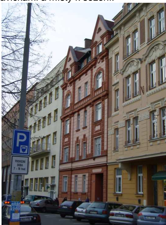
Bytová zástavba na nám.Dr.M.Horákové

Náměstí je opatřeno výsadbou mladých platanů. Drobný travní porost, který lemuje chodníky je doplněn výsadbou drobných květin, dle ročního období. Náměstí je doplněn lavičkami a místy k sezení.