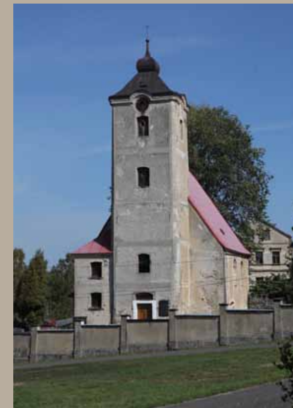
Pohled ke kostelu od jihozápadu

Kostel je ve vlastnictví obce, která se spolu se Spolkem pro záchranu kostela v Horní Řasnici, založeném v roce 2011, podílí na jeho celkové obnově. V roce 2012 byla natřena střecha kostela a proběhla demontáž hlavního oltáře a první etapa restaurátorských prací na něm. V následujícím roce došlo k opravě krovu a stropu přístavby kostela,