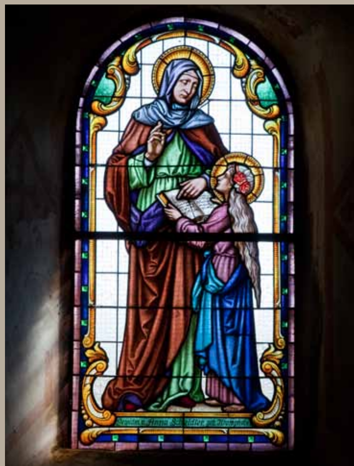
Vitrážová okna s výjevem sv. Anny s Pannou Marií a sv. Alžběty Durynské

Použité prameny a literatura: KRACÍKOVÁ, Lucie a Vojtěch BELLING. Středověká sakrální architektura na Frýdlantsku. Praha 2003, s. 66–72. ŠTERNOVÁ, Petra (ed.). Soupis Nemovitých kulturních památek v Libereckém kraji. Okres Liberec A–Le. Liberec 2010, s. 162–163. UHLÍKOVÁ, Kristina (ed.). Karl Friedrich Kühn. Verzeichniss der Kunstgeschichte und historischen Denkmale im Landkreis Friedland. Edice nedokončeného rukopisu. Praha 2013, s.62–65. Farní kronika Nového Města pod Smrkem 1607–1916. Okrašlovací spolek Nové Město pod Smrkem 2016.