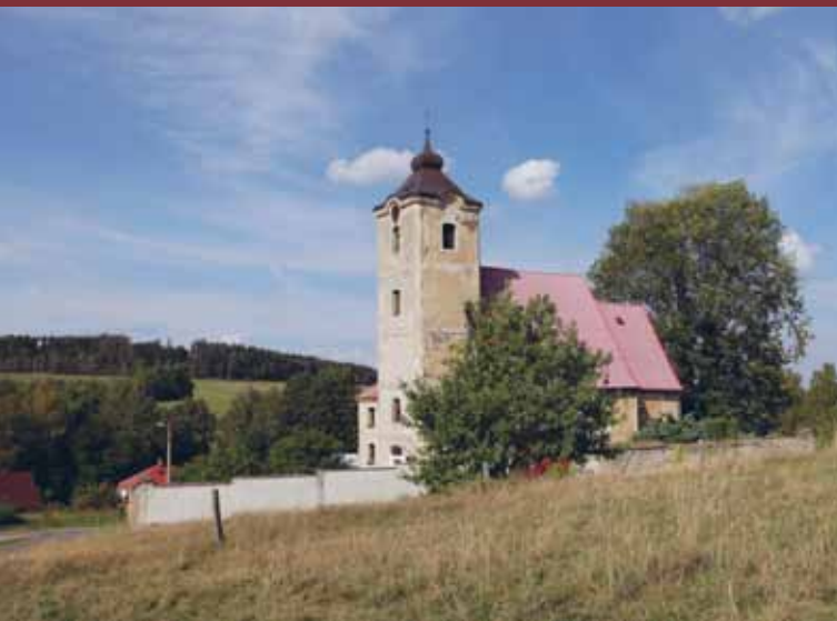
Celkový pohled od jihu

Kostel Neposkvrněného Početí Panny Marie obklopený hřbitovem je situován ve střední části obce na svahu nad levým břehem Řasnického potoka. Areál kostela doplňuje ohradní zeď se dvěma brankami a drobná stavba márnice. Od roku 1964 je areál kostela kulturní památkou registrovanou v Ústředním seznamu kulturních památek České republiky pod rejstříkovým číslem 16255/5-4297.