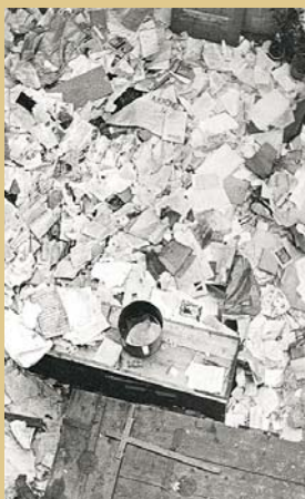
Útok proti klášterům znamenal rovněž nevratné kulturní ztráty (klášter Kadaň, 1950)

Jeho součástí byla násilná izolace biskupského sboru od věřících, uvěznění či internace biskupů, přerušování diplomatických styků s Vatikánem a politické monstrprocesy. V prvním z nich byli souzeni představitelé mužských řeholí a katoličtí teologové a byl doprovázený propagandistickou kampaní