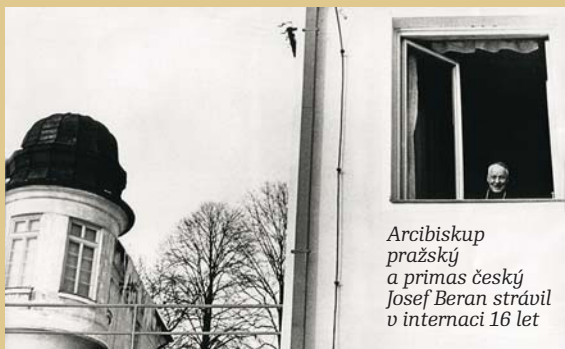
Arcibiskup pražský a primas český Josef Beran strávil v internaci 16 let

Pro československé komunisty představovala zásadní překážku pro totalitní režim římskokatolická církev, která se v podmínkách pounorového Československa vlastně ocitla v postavení zajatce. Věřící i kněží žili v režimu, který proti nim v podstatě vedl zákeřný vícegenerační boj. V tomto zápase krivícím charakterem se pouze měnily prostředky nátlaku ze strany režimu. Ačkoli se tato složka novověkých českých dějin týkala velkého množství lidí a zanechala mnoho morálních a materiálních škod, nebyla veřejností po roce 1990 ještě komplexnějším způsobem doceněna a reflektována. Cílem výstavního projektu je proto představit odborné a laické veřejnosti hlavní specifika proticírkevního boje komunistického státu, přiblížit analytickým historickým způsobem hlavní rysy nátlaku a vytvořit tak rámec pro hlubší reflexi našich nedávných dějin.