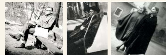
Sledování tajnou policií: Miloslav Vlk, Augustin Navrátil, Anna Magdalena Schwarzová

Podle politického uvolnění 60. let nastupuje éra „nor-