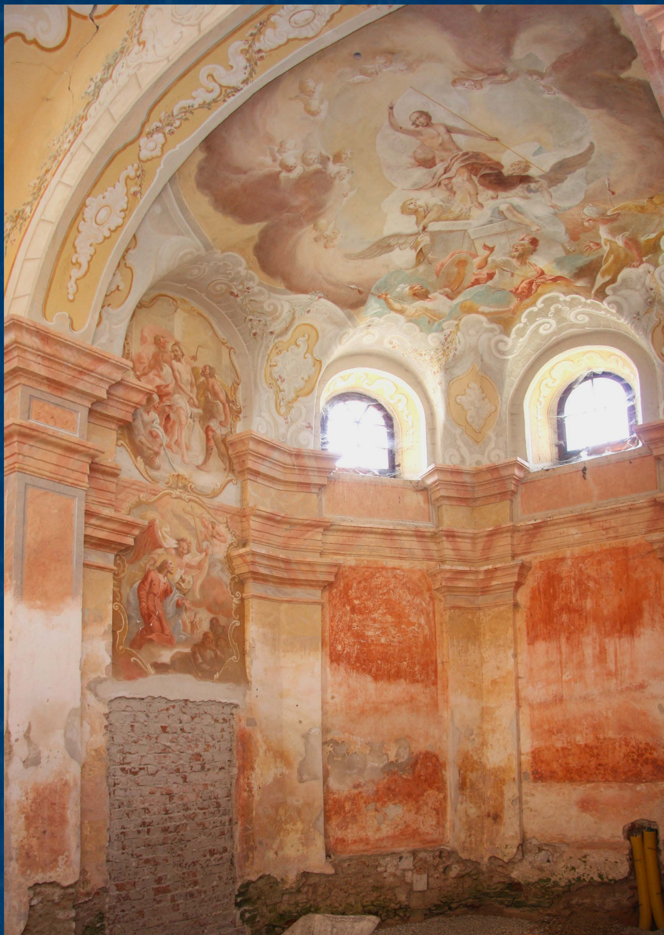
Interiér kněžiště před restaurováním