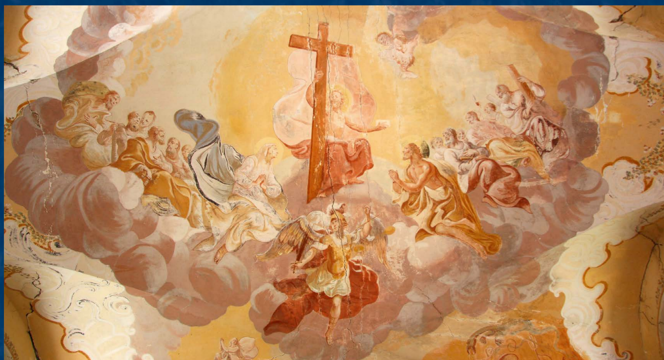
Malba Posledního soudu před restaurováním