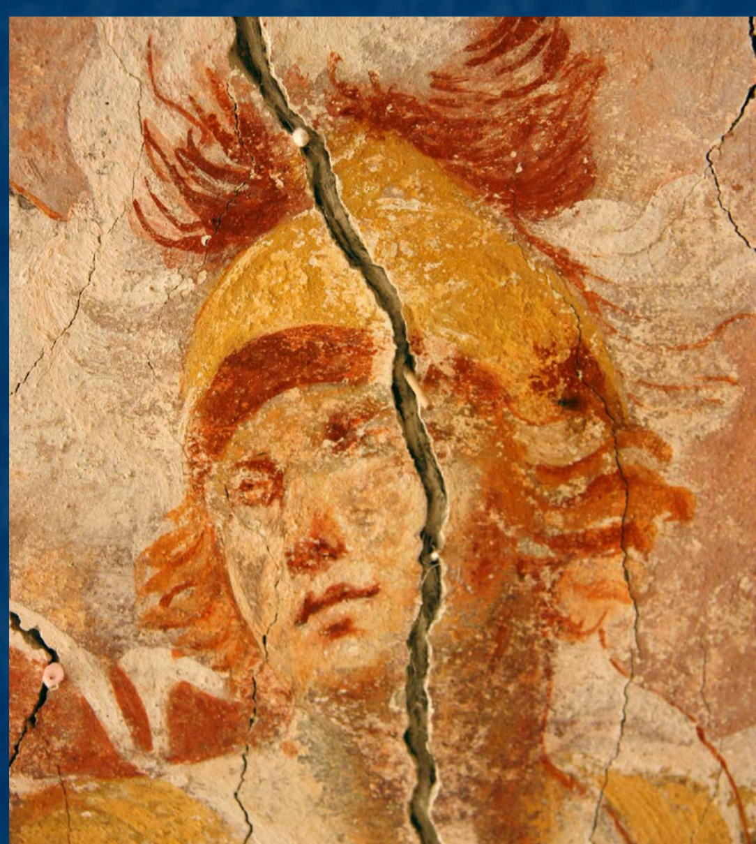
Detail poškození malby sv. archanděla Michaela

hřbitovní kaple sv. Kříže ve Slavonicích (okres Jindřichův Hradec), vlastník: město technika: nástěnná malba fresco-secco, kamenosochařské prvky – žula, truhlářské a kovářské práce portál 1586, stavba 1702, malířská výzdoba druhá polovina 18. století, její obnova a doplnění 1877, 1904 restaurování: Kateřina Krhánková, Jana Waisserová, Jana Dunajská a kolektiv, stavební práce: Slavonická stavební huť, 2013–2014