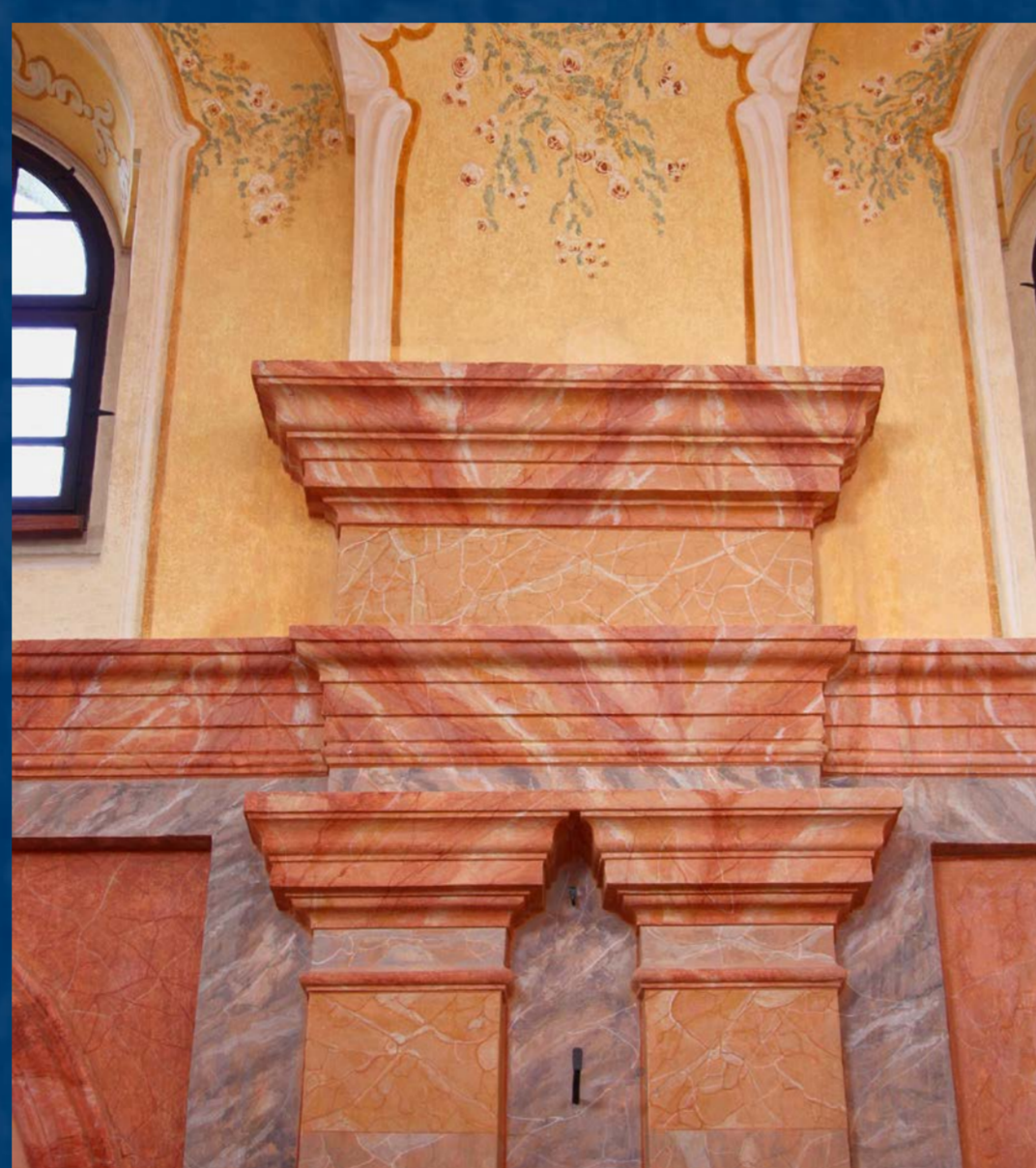
Iluzivní mramorování stěn a ornamentální výzdoba po restaurování