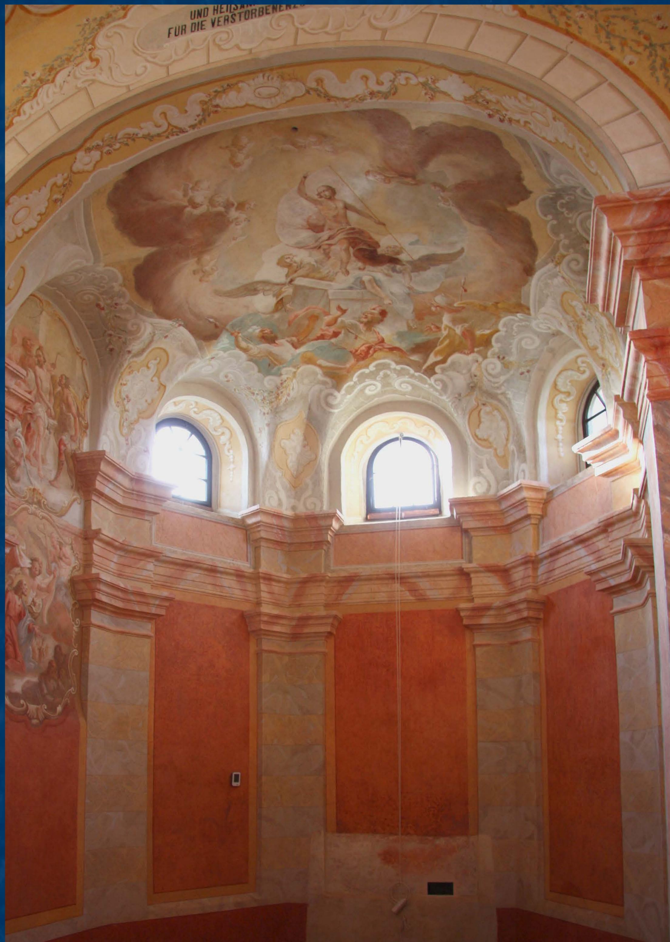
Interiér kněžiště po restaurování