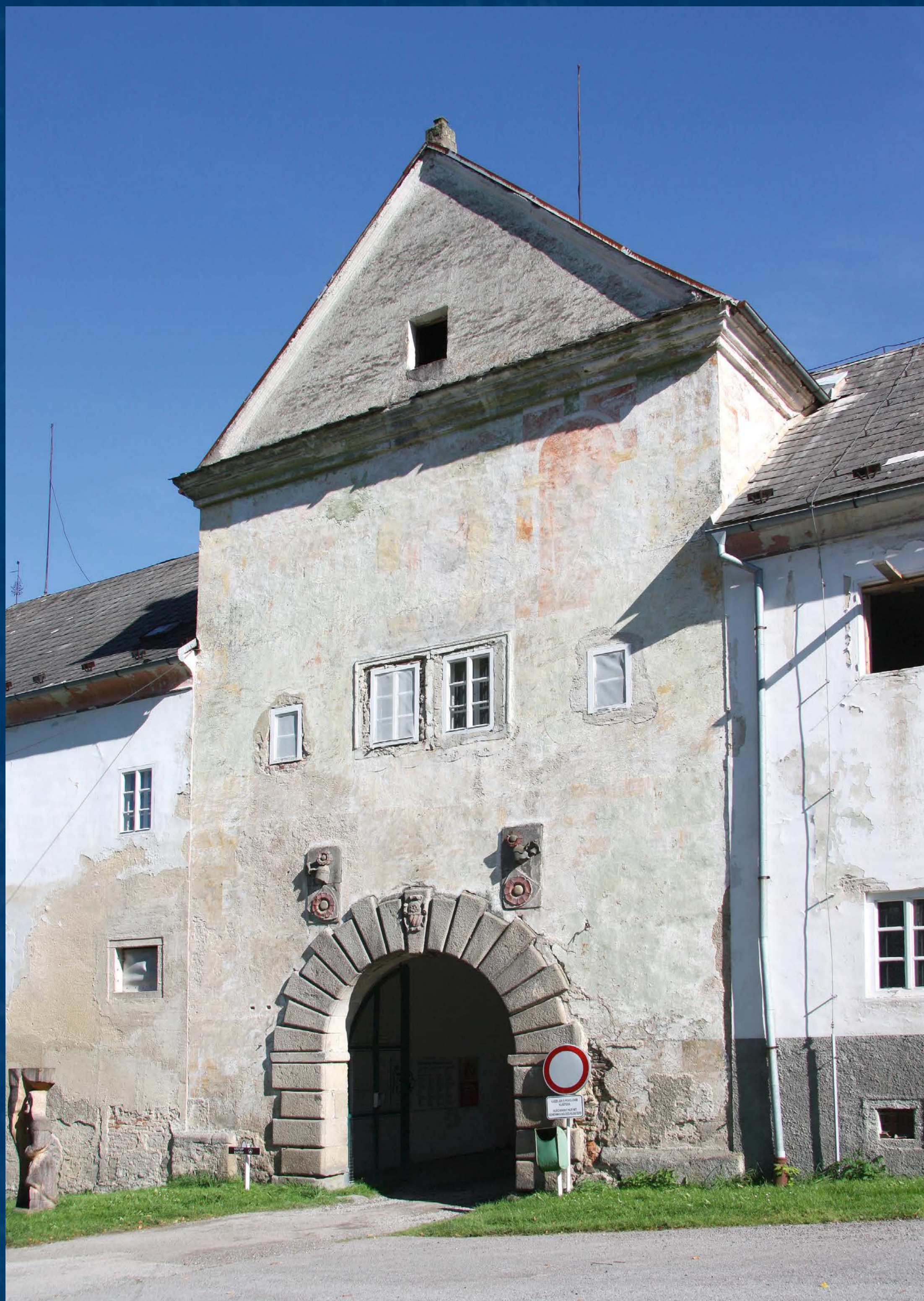
Brána před restaurováním