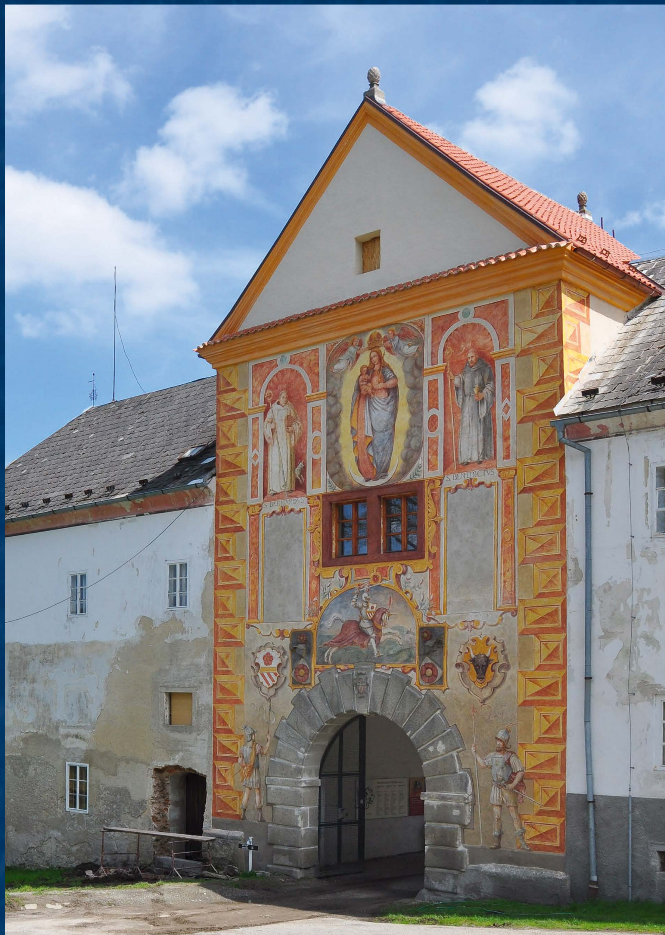
Hlavní brána do vyšebrodského kláštera po restaurování fasády