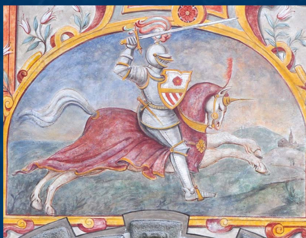
Malba rožmberského jezdce po restaurování