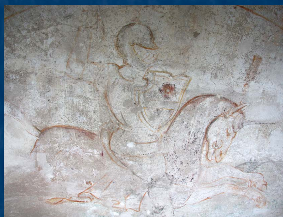
Odhalená rytá podkresba rožmberského jezdce