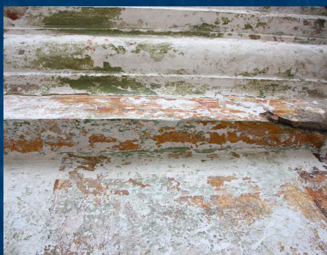
Detail odkrytých zbytků barevnosti