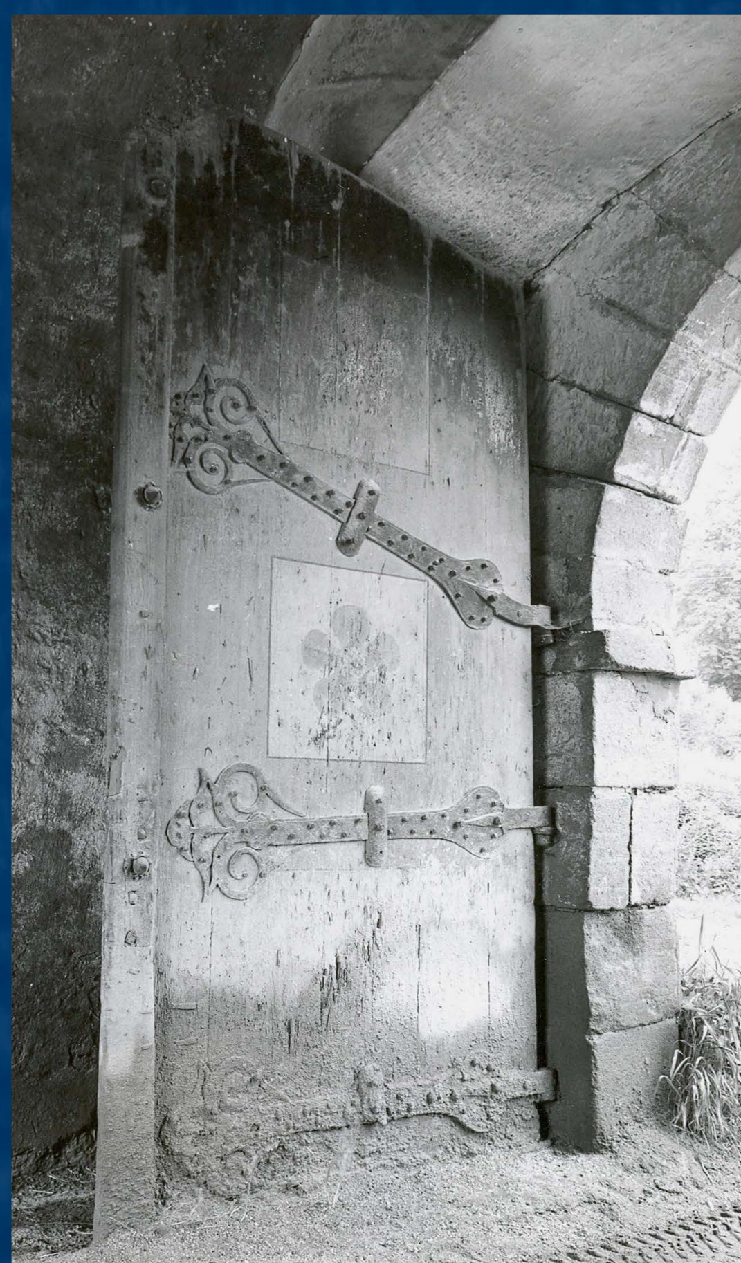
Poškozené křídlo vrat v roce 1975