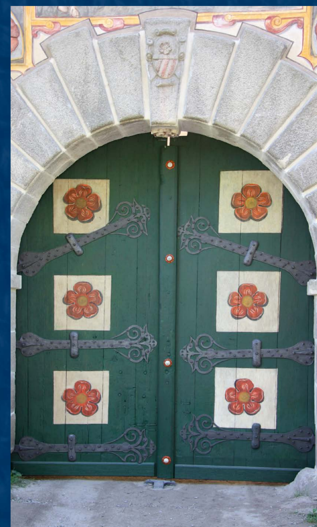
Vrata po komplexním restaurování