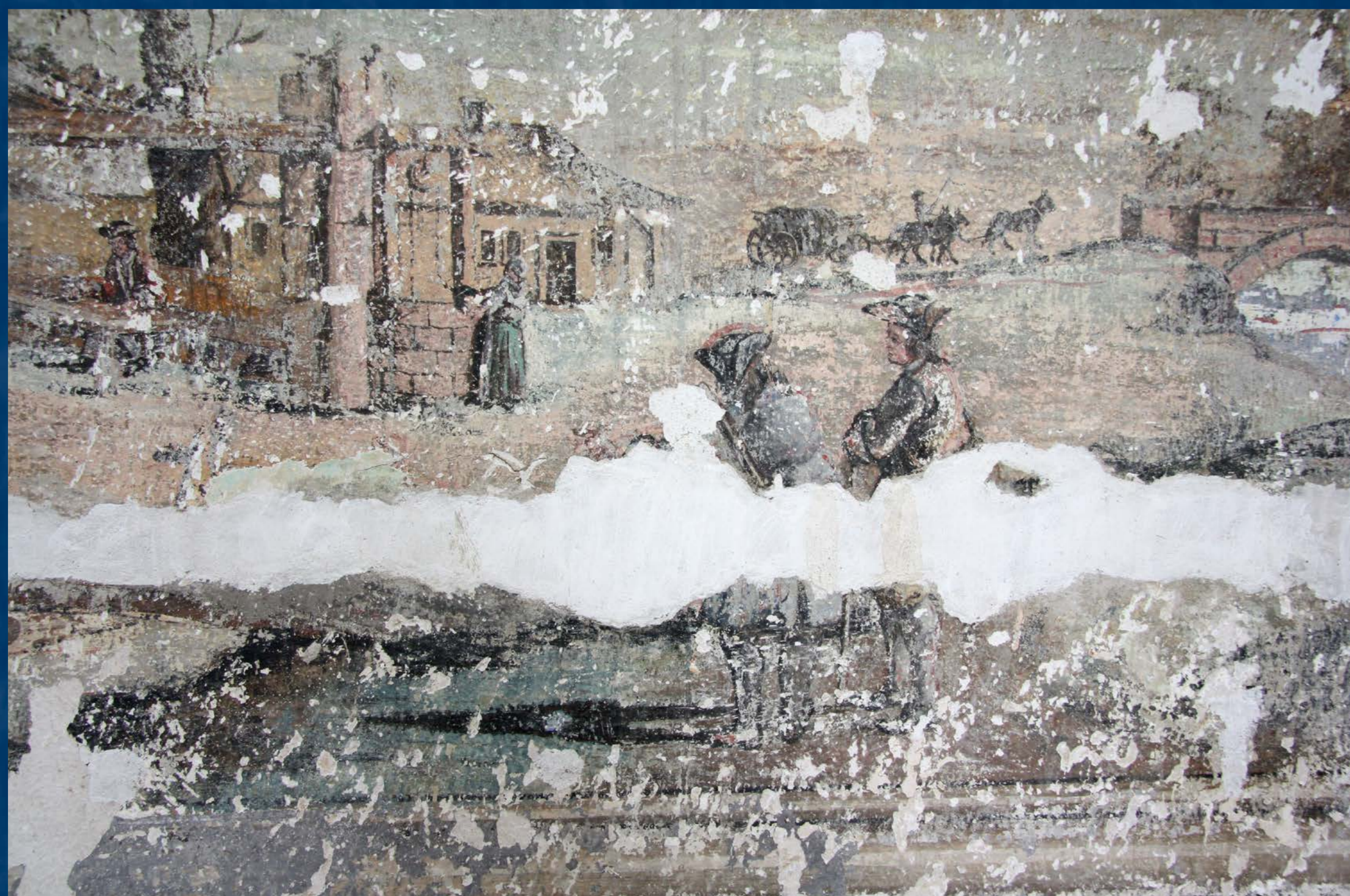
Detail malby po vytmelení

Nástěnné malby byly po kompletním odkryvu zpevněny, poškozené části omítek doplněny a drobná poškození vytmelená. Odkryté originální partie byly restaurovány a zničené části, zejména při podlaze a v místech vedení inženýrských sítí, se podařilo rekonstruovat. Komplexní restaurátorský zásah tak zachránil cenné umělecké dílo barokní iluzivní tvorby a svědectví o šlechtické kultuře českého venkova.