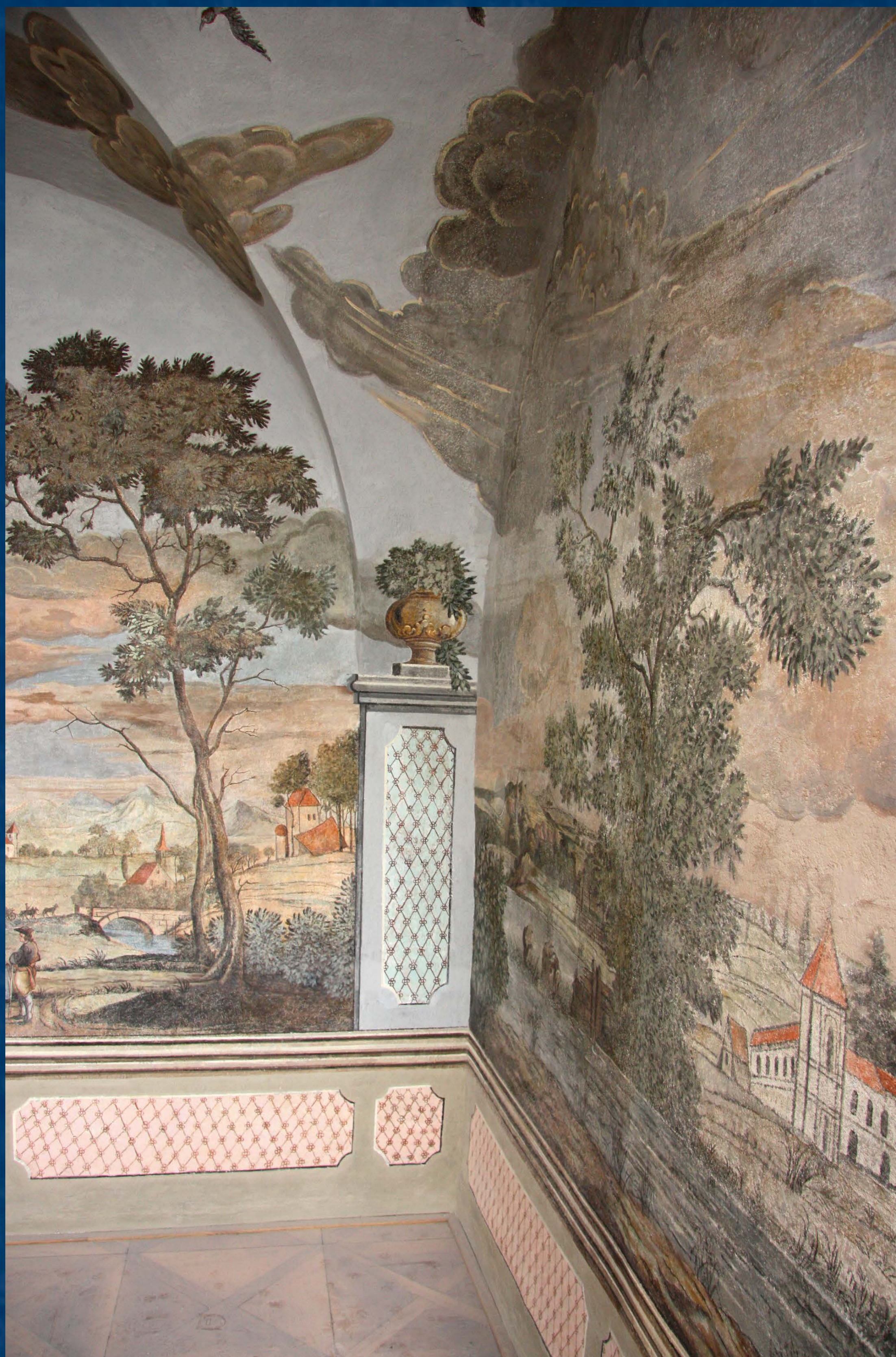
Náročná iluzivní výmalba sálu měšického zámku po restaurování