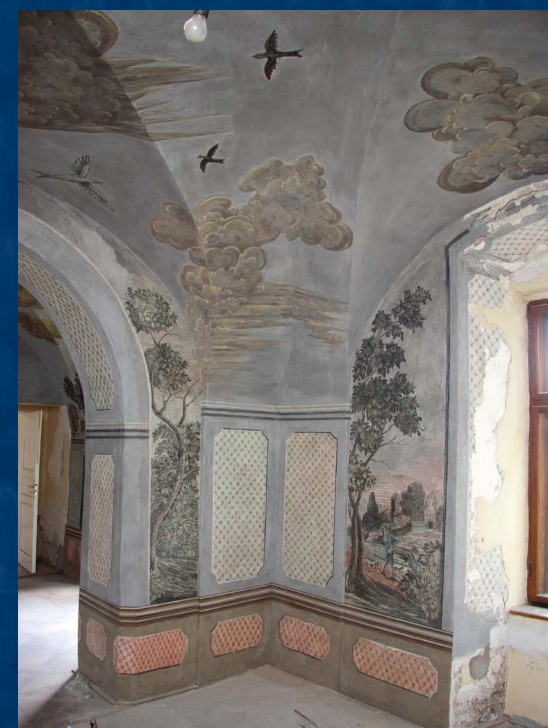
Malba v závěru restaurátorského zásahu