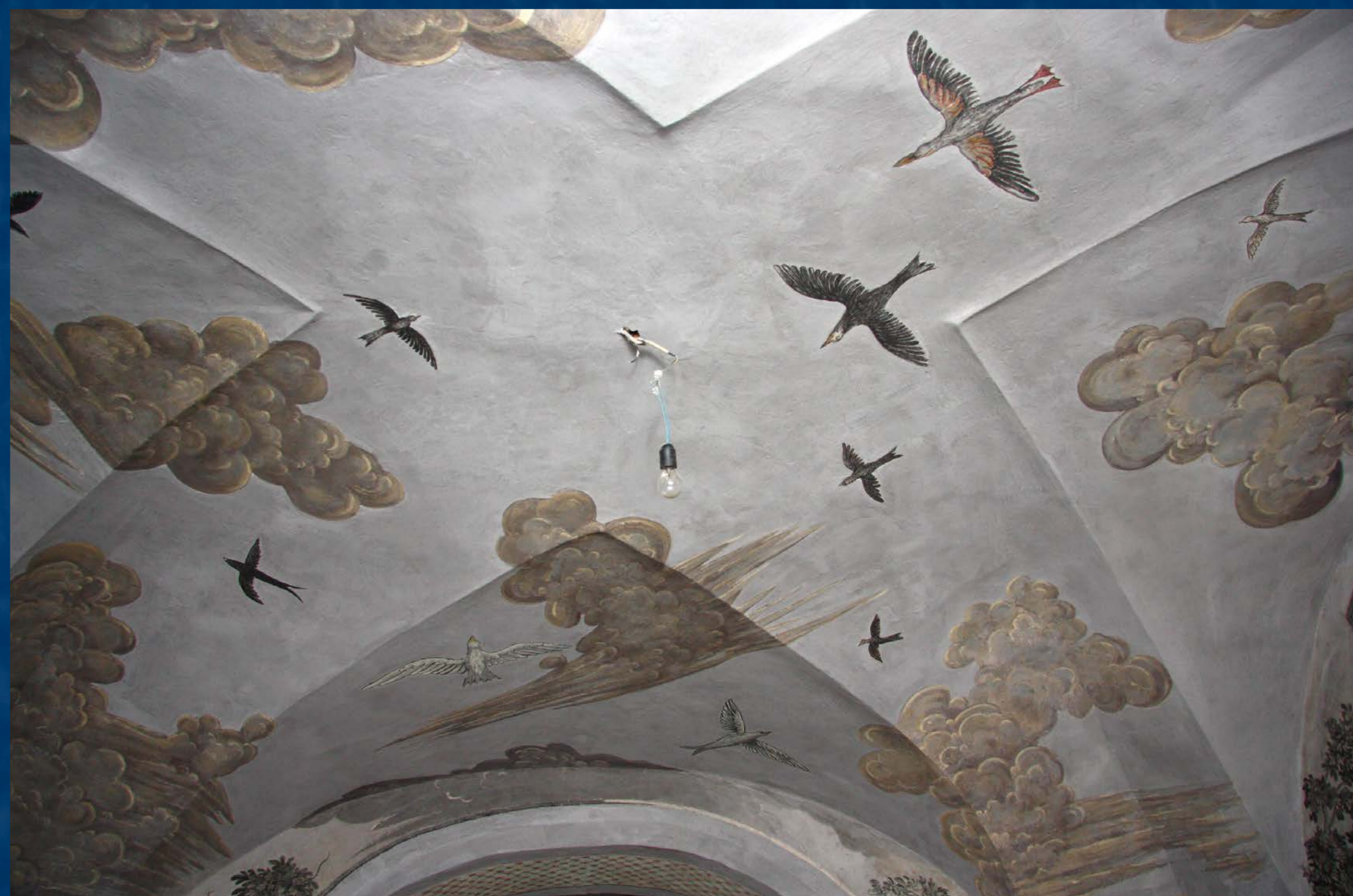
Strop po restaurování