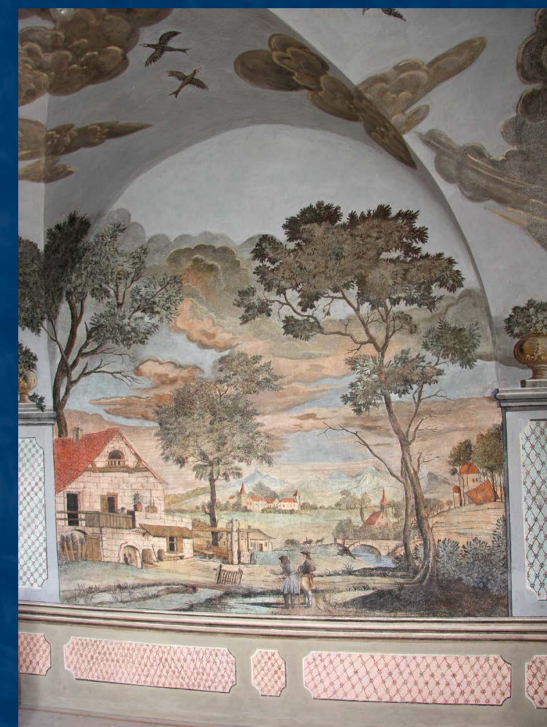
Malba jedné z iluzivních krajín po restaurování