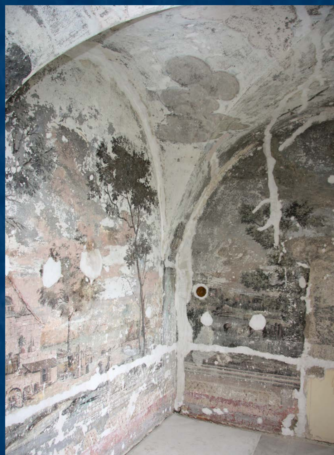
Malby po odkrytí, v průběhu tmelení defektů