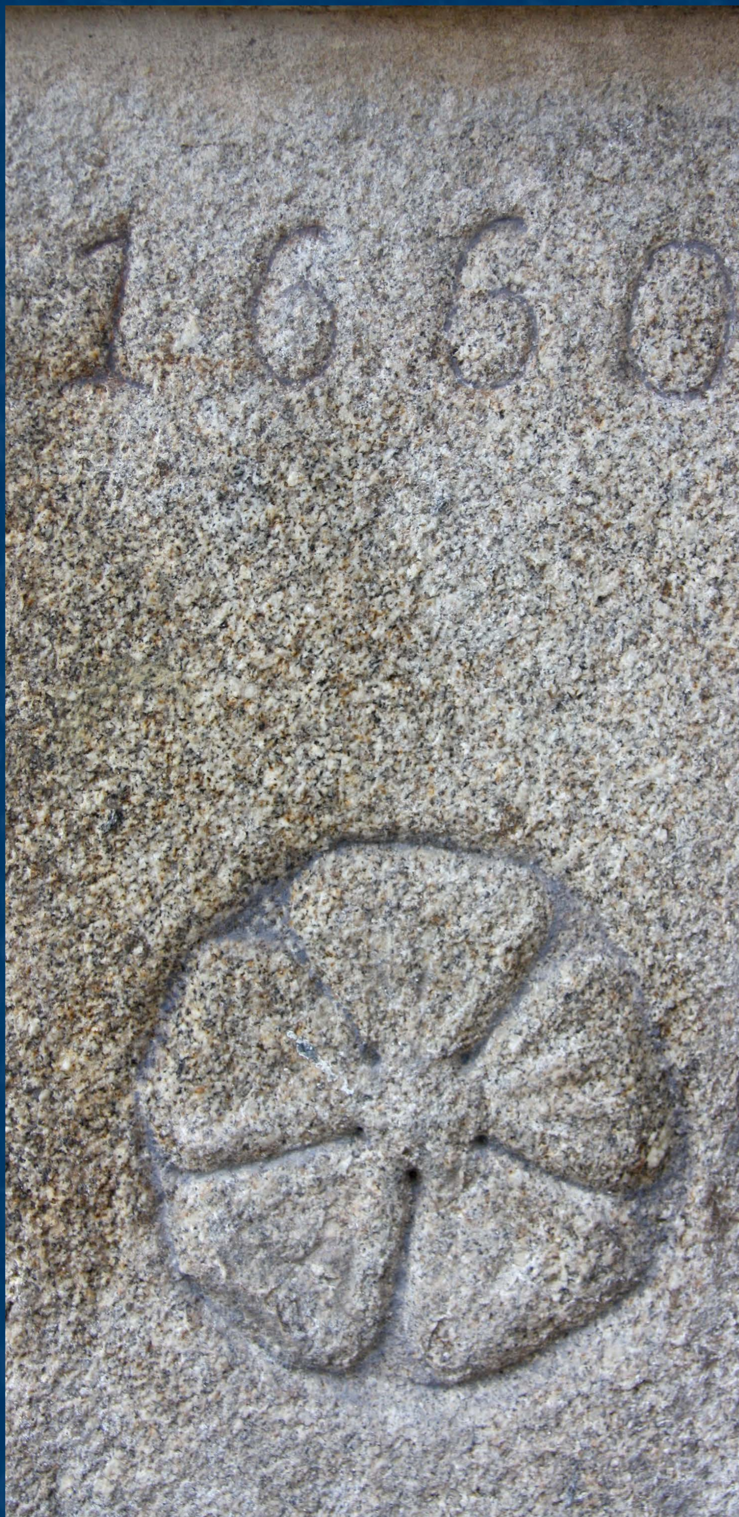
Detail výzdoby a datace po restaurování