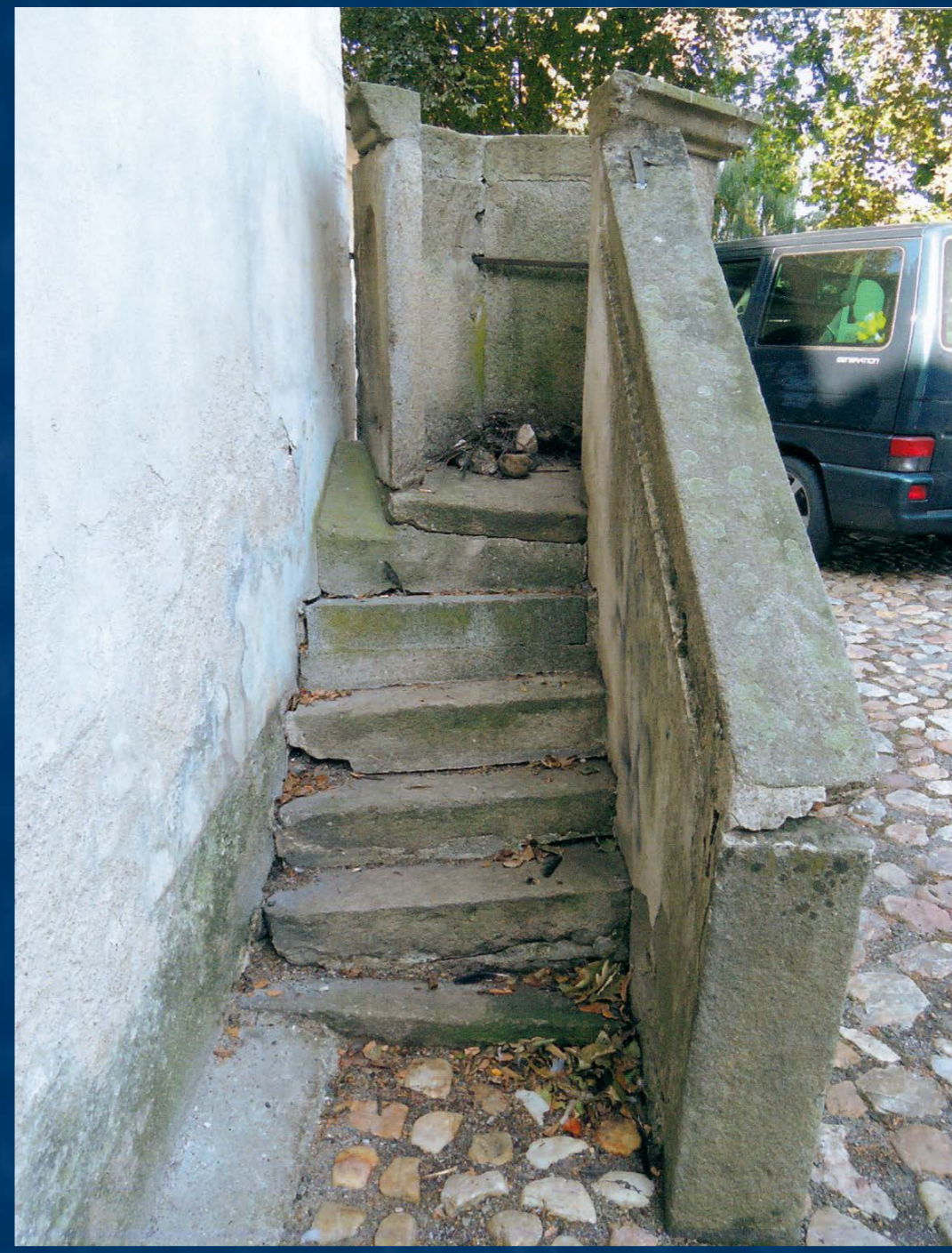
Kamenné schody před opravou