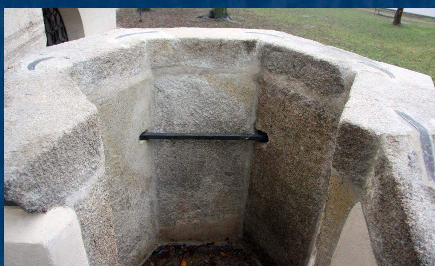
Vnitřní strana řečníště po restaurování a přikotvení ke stěně