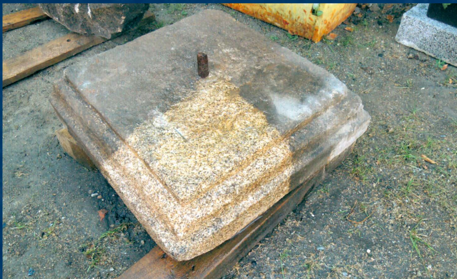
Pod úrovní terénu nalezená patka v průběhu čištění

Restaurátorské práce zachránily a do původní podoby rehabilitovaly unikátně dochovaný příklad raně barokní venkovní kazatelny.