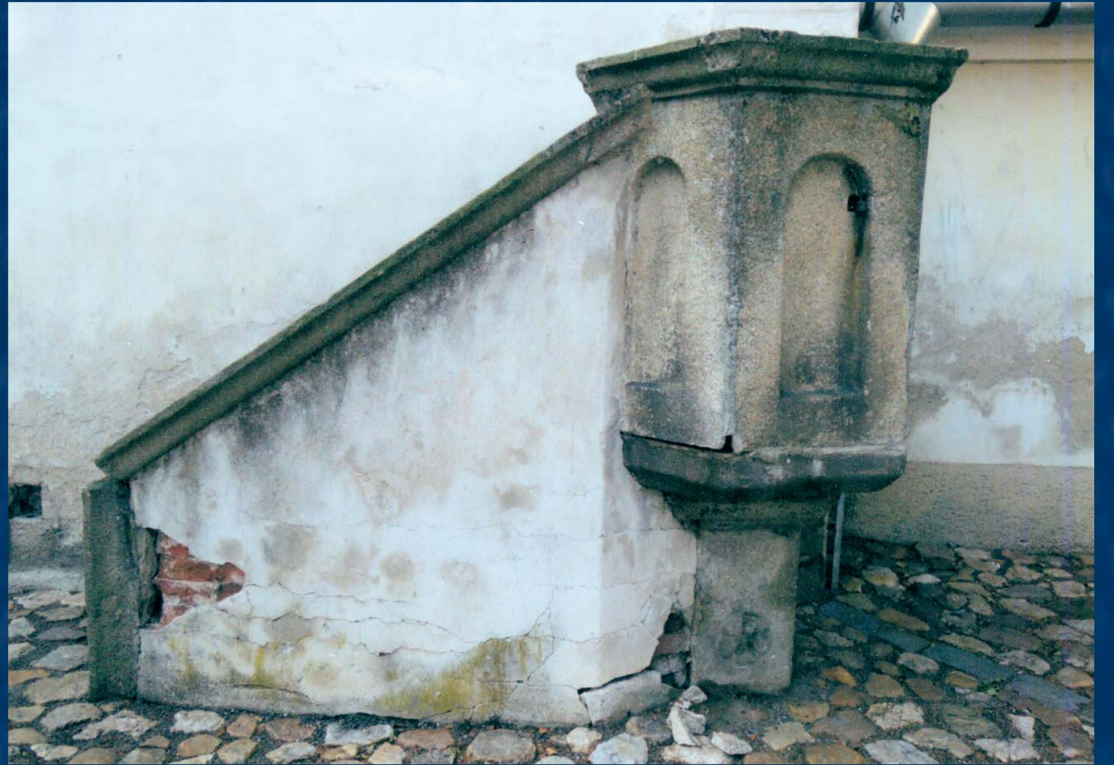
Kamenná kazatelna před restaurováním

Kazatelna proto byla rozebrána a převezena do restaurátorského ateliéru. Při úpravě základové partie se podařilo pod mladší valounovou dlažbou nalézt zasypanou kamennou patku nohy. Originální kamenné části konstrukce byly očištěny, zpevněny a drobná