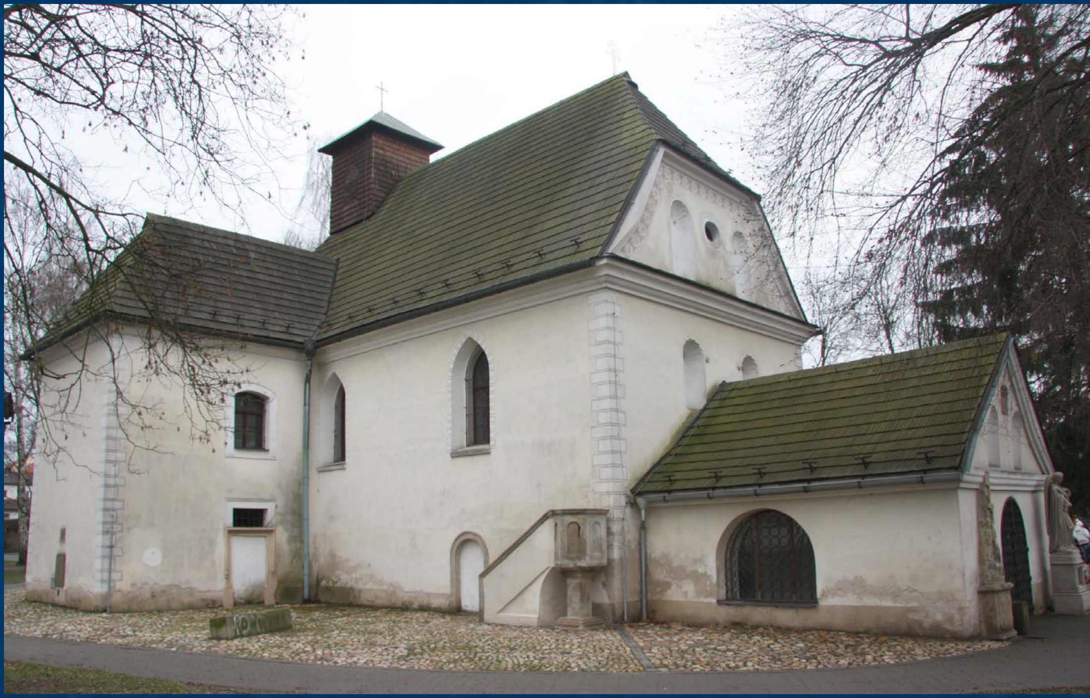
Kamenná kazatelna při nároží kostela po restaurování