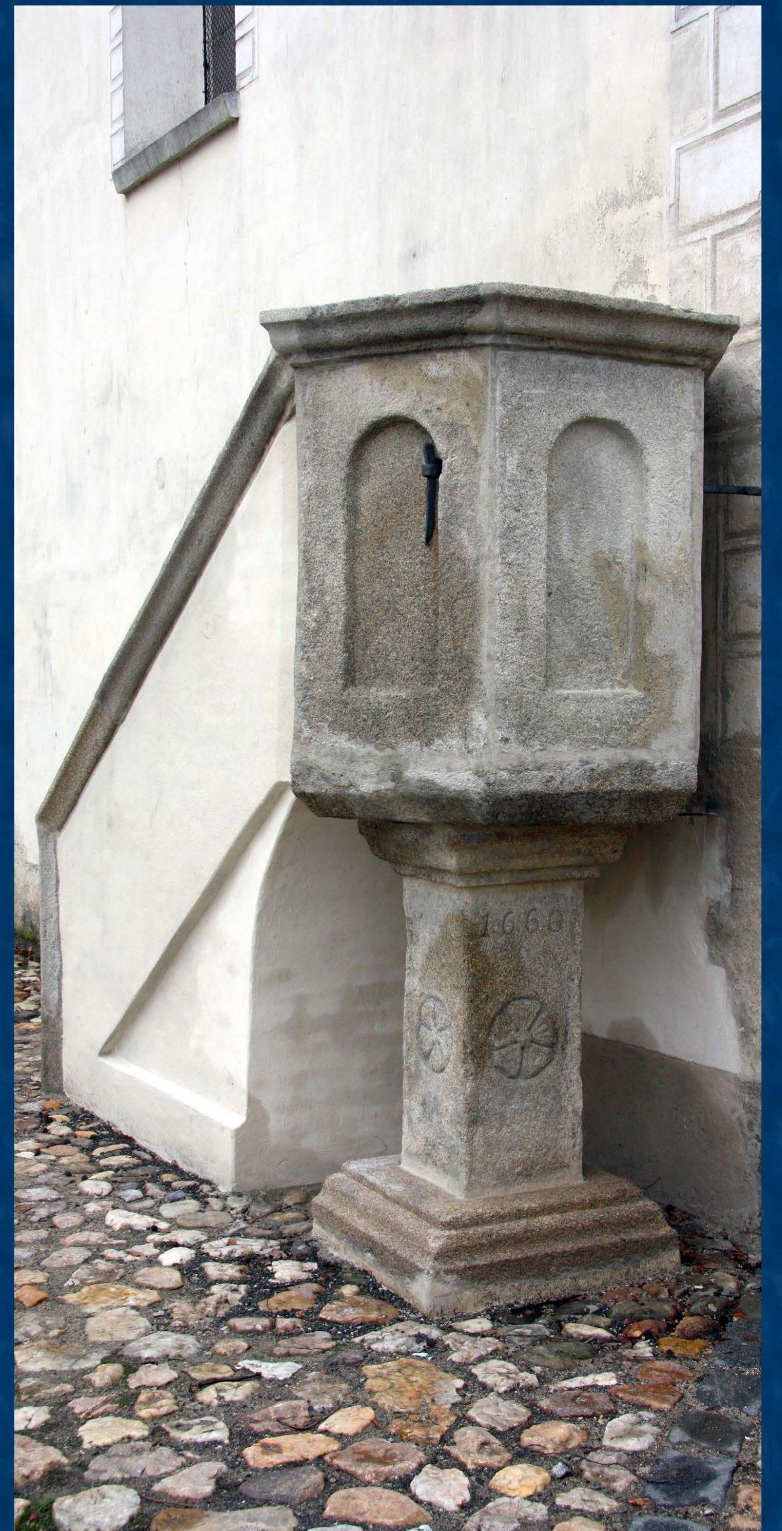
Kazatelna po restaurování