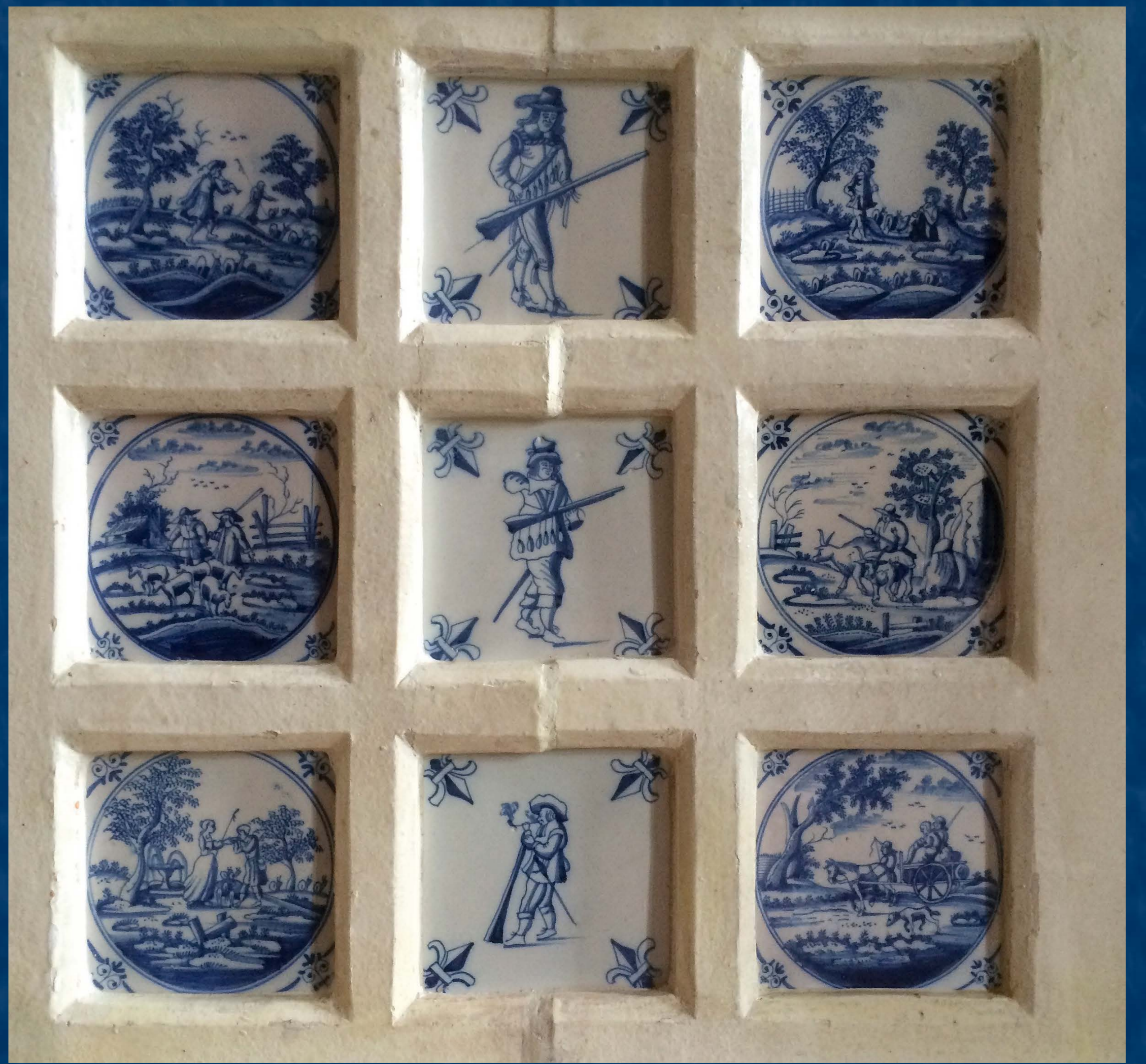
Detail kamen po restaurování