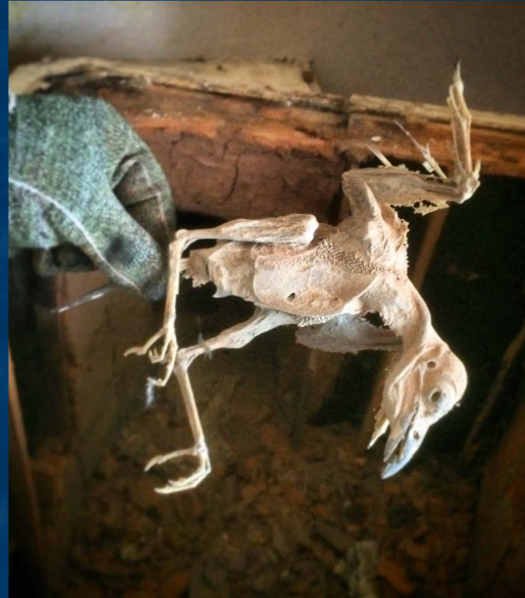
Nález po rozebrání kamen