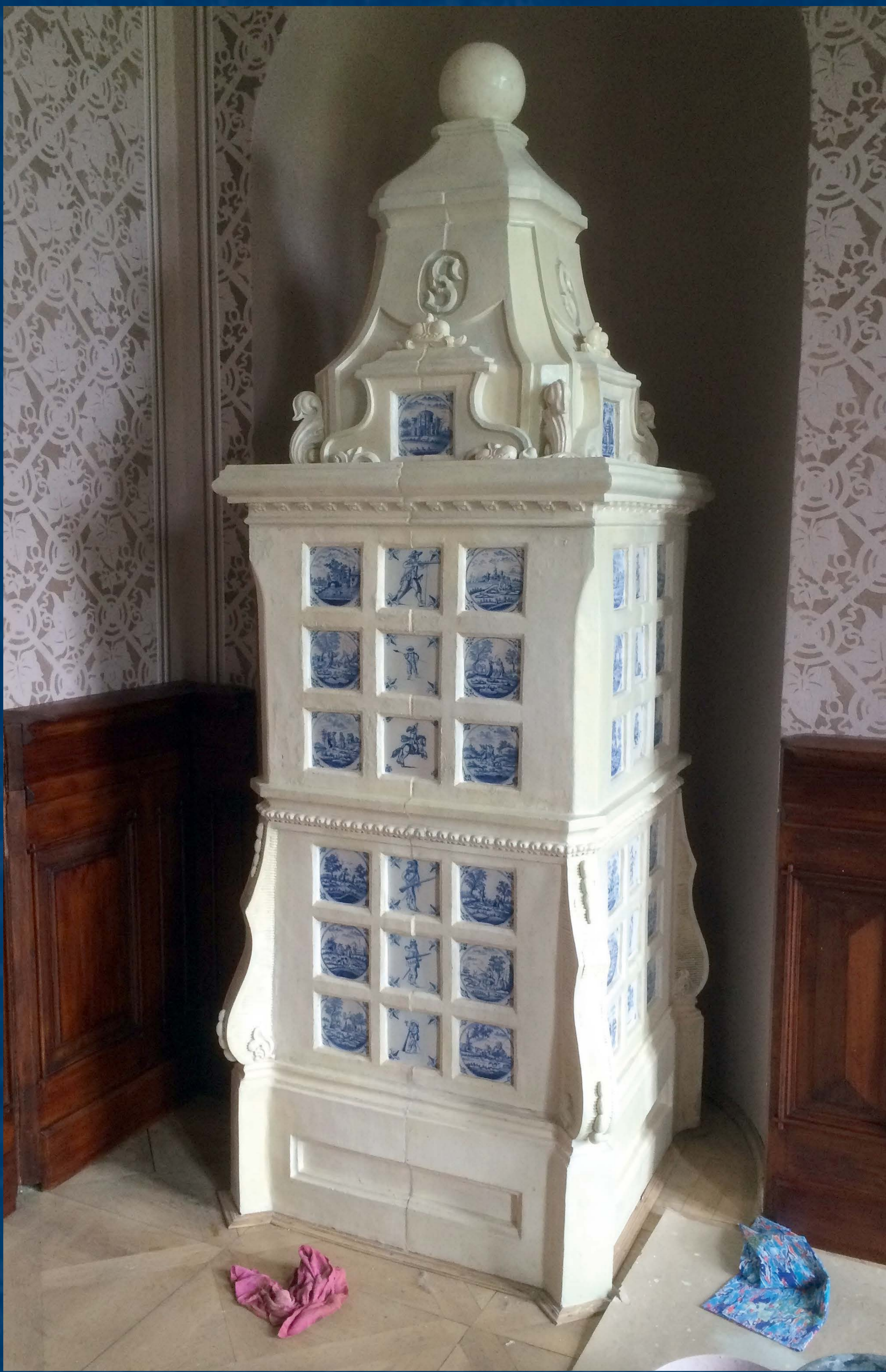
Celek kamen po restaurování

Během rehabilitace interiéru části hostinských apartmá ve druhém patře zámku Hluboká byl restaurován soubor třinácti kachlových kamen středoevropské provenience, převážně z poloviny 19. století. Výjimkou byl barokní kus zdobený kachličky z modré delftské fajánsy s jemně našedlou glazurou. Zda kamen sloužila k vytápění zámku Hluboká již před jeho přestavbou v polovině 19. století, nevíme, přibližně od roku 1860 jsou umístěna v ložnici Černínů v druhém patře zámku.