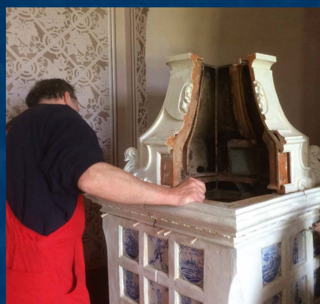
Stavba kamen po restaurování