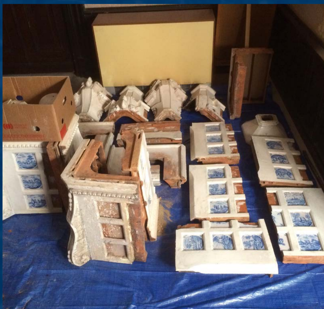
Po rozebrání kamen

Při restaurování byl korpus kamen postupně od vrchní koruny po úroveň topeniště rozebrán. Byly odstraněny zbytky starých jílu a spárovacích hmot z minulých období, vyčištěné kachloví znovu postaveno klasickou kamnářskou metodou pomocí jílu s pískem. Po sestavení korpusu kamen se pomocí vysoce pevnostní sádry doplnily ulámané a poškozené detaily ornamentů. V 19. století se často lesk glazury udržoval přetíráním kůžemi od špeku, mastnota proto vytvářela skvrny a matné závoje. Na omytém kachloví byly provedeny barevné retuše pomocí barevných, lehce okližených pigmentů a lesk glazury byl napodoben pomocí polyuretanového laku na vodní bázi. Revize spárování byla prováděna tak, aby se spárovací hmota svým odstínem přiblížila co nejvíce původní barevnosti. Na závěr byl ošetřen povrch glazury. Aby mohla být místnost příležitostně temperována, bylo rozhodnuto osadit jednotlivé korpusy elektrickými tělesy. Tato tělesa nemají funkci vytváření sálavého tepla, ale pouze temperování s povrchovou teplotou do 60° C.