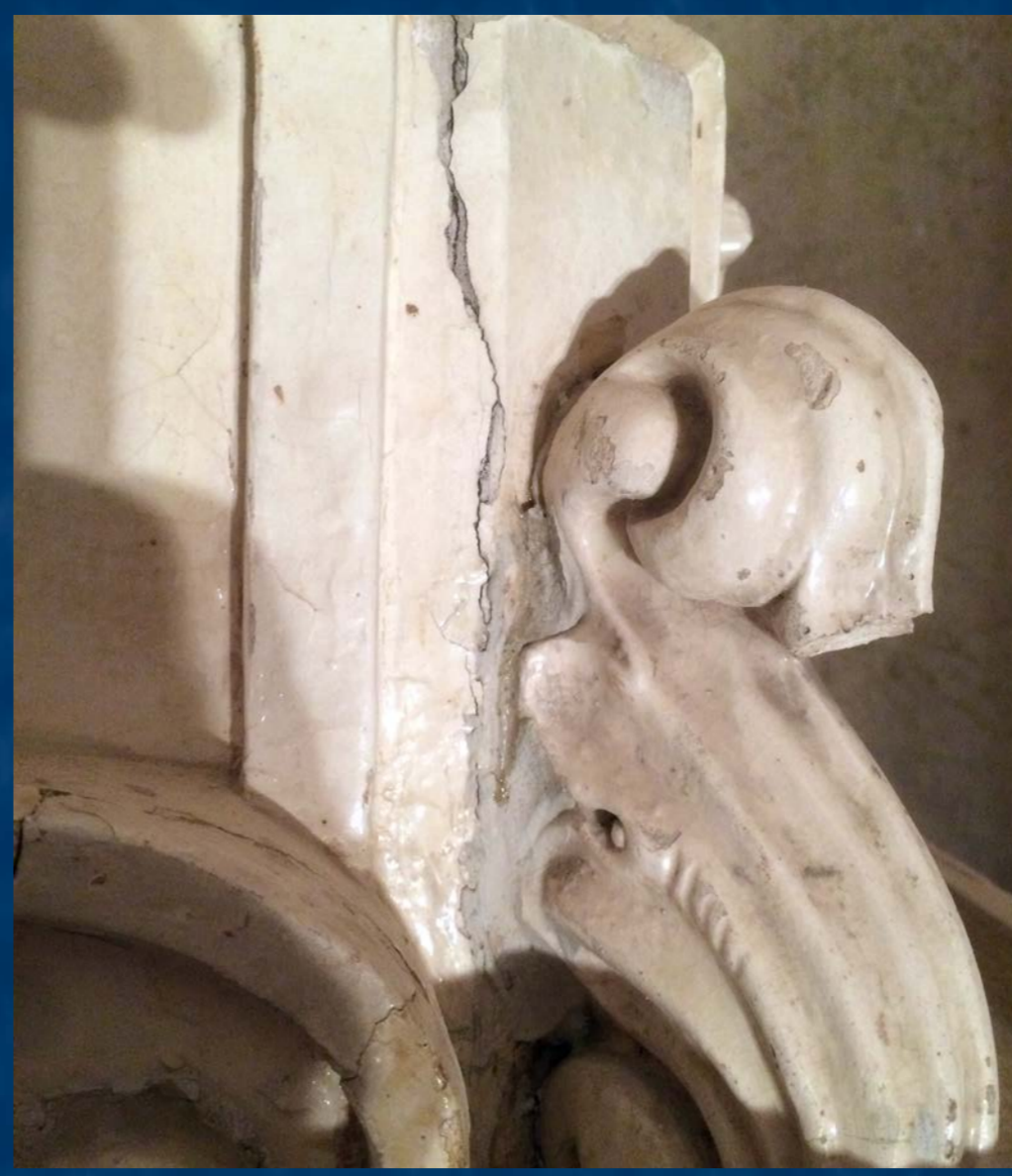
Detail vytmelené praskliny

Před restaurováním byla kamen silně znečištěna, měla na velké části povrchu popraskanou a odprýskávající glazuru, část dekorativních detailů byla mechanicky poškoze-