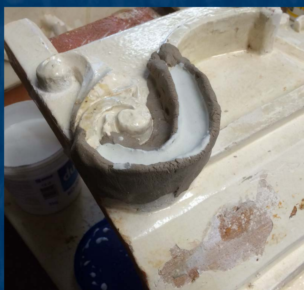
Oprava plastických detailů