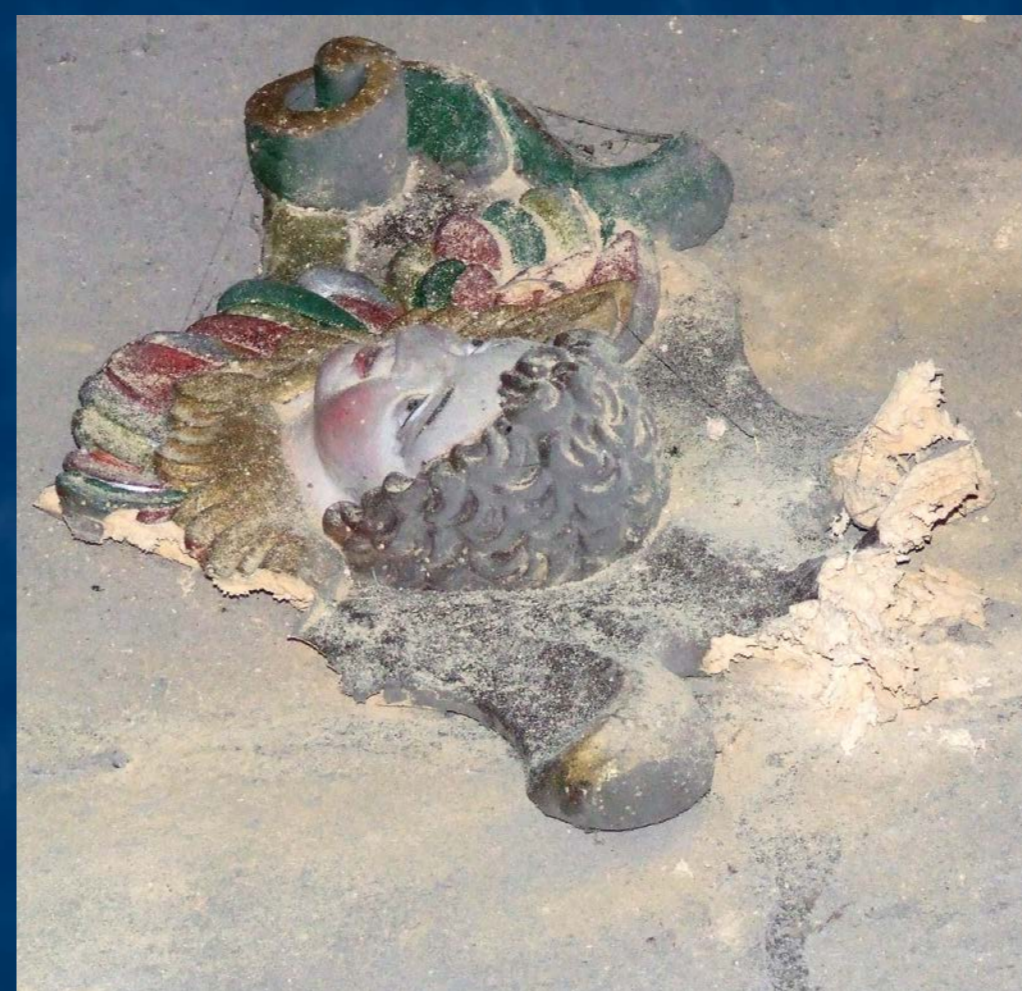
Odpadávající části řezeb epitafu pod kůrem