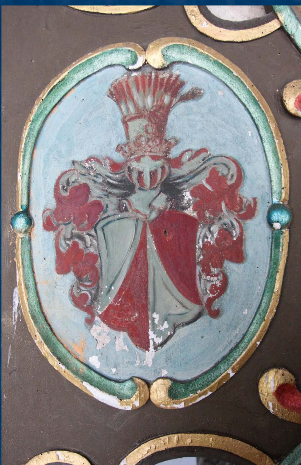
Detail poškození polychromie na rodovém znaku Hozlauerů

Odborné zásahy vycházely z výsledků restaurátorského stratigrafického průzkumu souvrství polychromie i jejích podkladů a laboratorního průzkumů, provedených na vybraných vzorcích nábrusů. Bylo tak prokázáno, že epitaf prošel pouze jednou druhotnou opravou polychromie, provedenou pouze na některých částech památky, přičemž v některých partiích byla původní polychromie bohužel sejmuta až na dřevo. V zájmu zachování celistvosti památky nakonec nebyly druhotné přemalby sejmuty a rehabilitační prošla stávající povrchová úprava. Dřevo bylo ošetřeno radičním zářením a petrifikováno, bylo nutné šetrně sejmut zakalené laky, konstrukčně vyspravit architekturu, revidovat spoje a úchyty, dořezat chybějící prvky a vizuálně je sjednotit s okolním originálem. Výletové otvory po dřevokazném hmyzu restaurátor tmelil emulzním křídovým tmelem a na závěr celoplošně konzervoval dřevo damarovým lakem. Retušování zlacení, stříbření a lazur se uskutečnilo historicky věrnou technologií. Obrazy byly po vyčištění a upevnění malby rentolovány voskopryskyřičnou směsí na novou plátěnou podložku. Po šetrném zeslabení lakové vrstvy, tmelení a retuší se výjevy staly mnohem lépe čitelné.