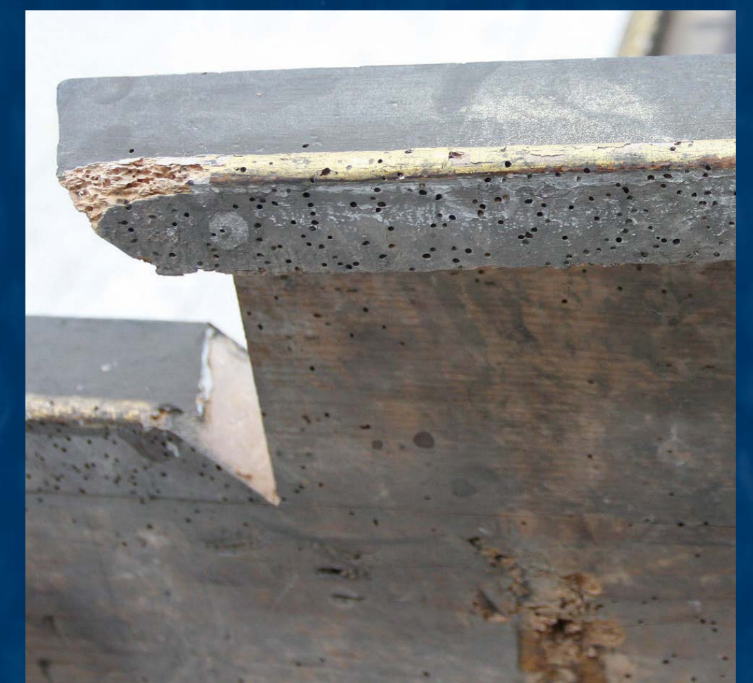
Detail ztrouchnivělého dřeva napadeného dřevokazným hmyzem