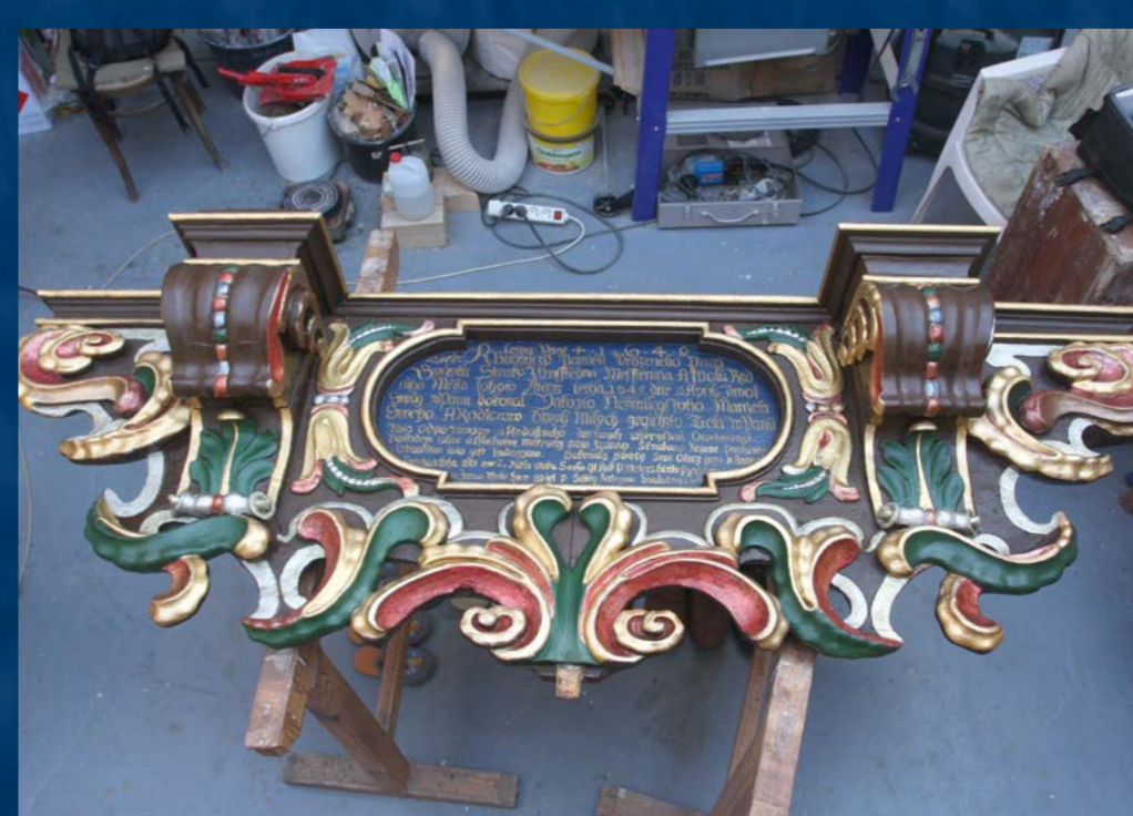
Detail epitafu po restaurování