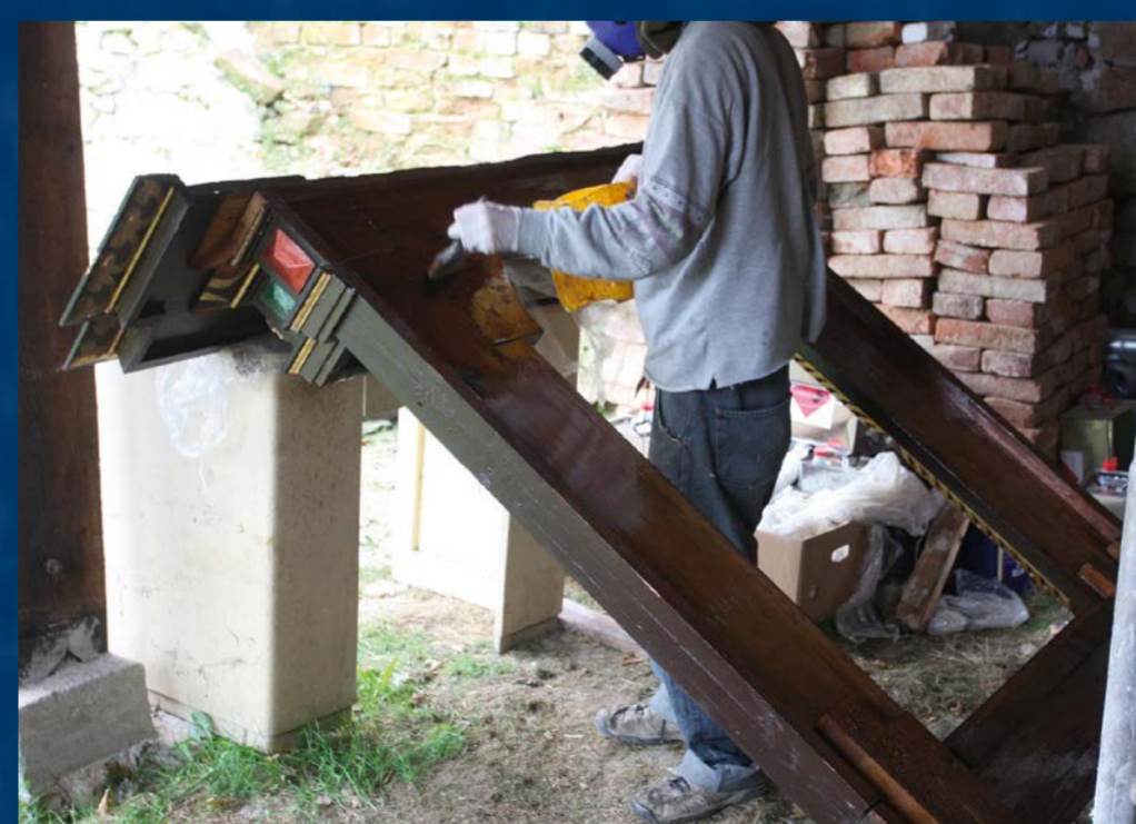
Ošetření dřeva proti dřevokaznému hmyzu po ozáření