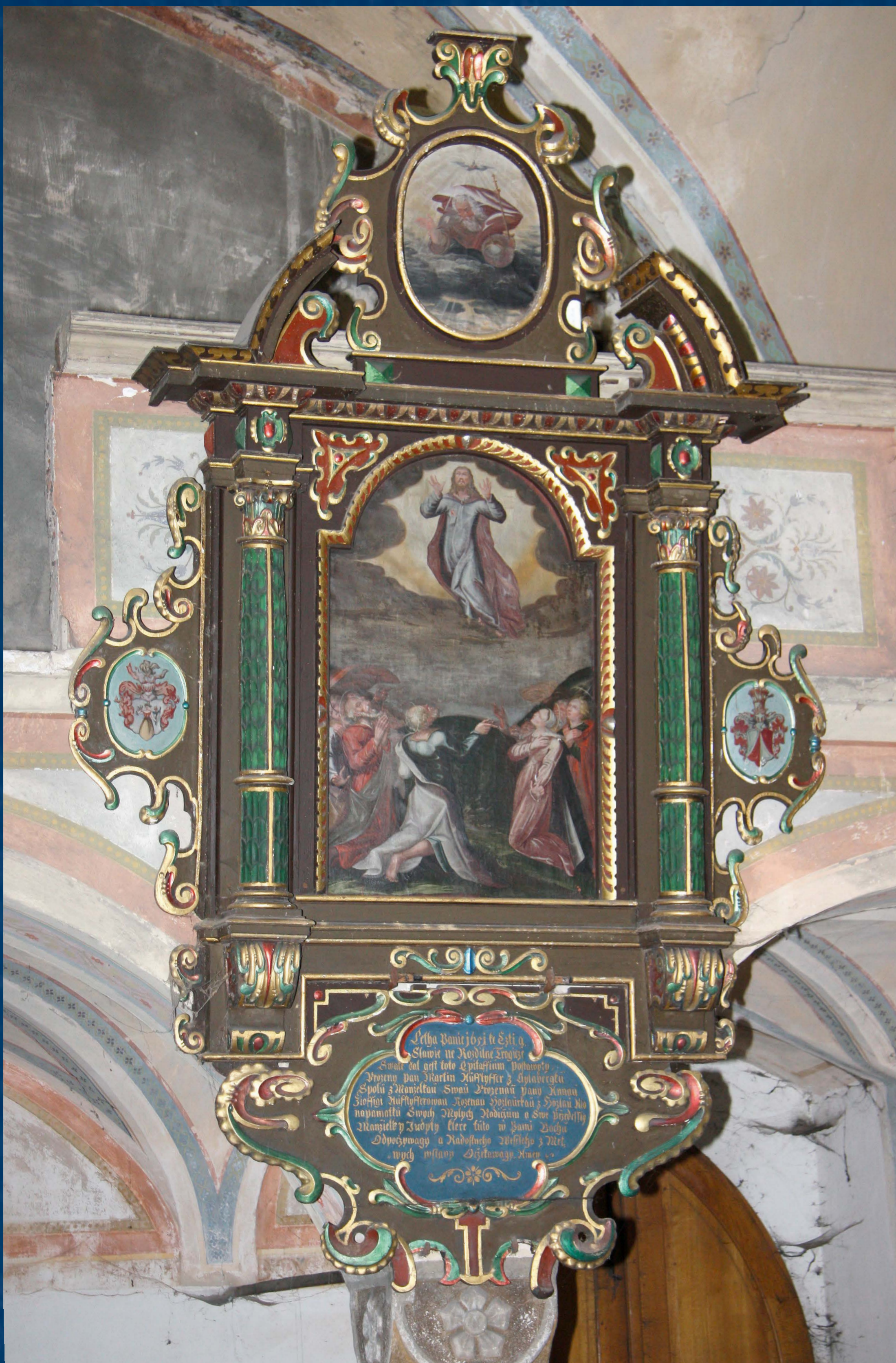
Epitaf před restaurováním na kůru kostela Nejsvětější Trojice v Jindřichově Hradci