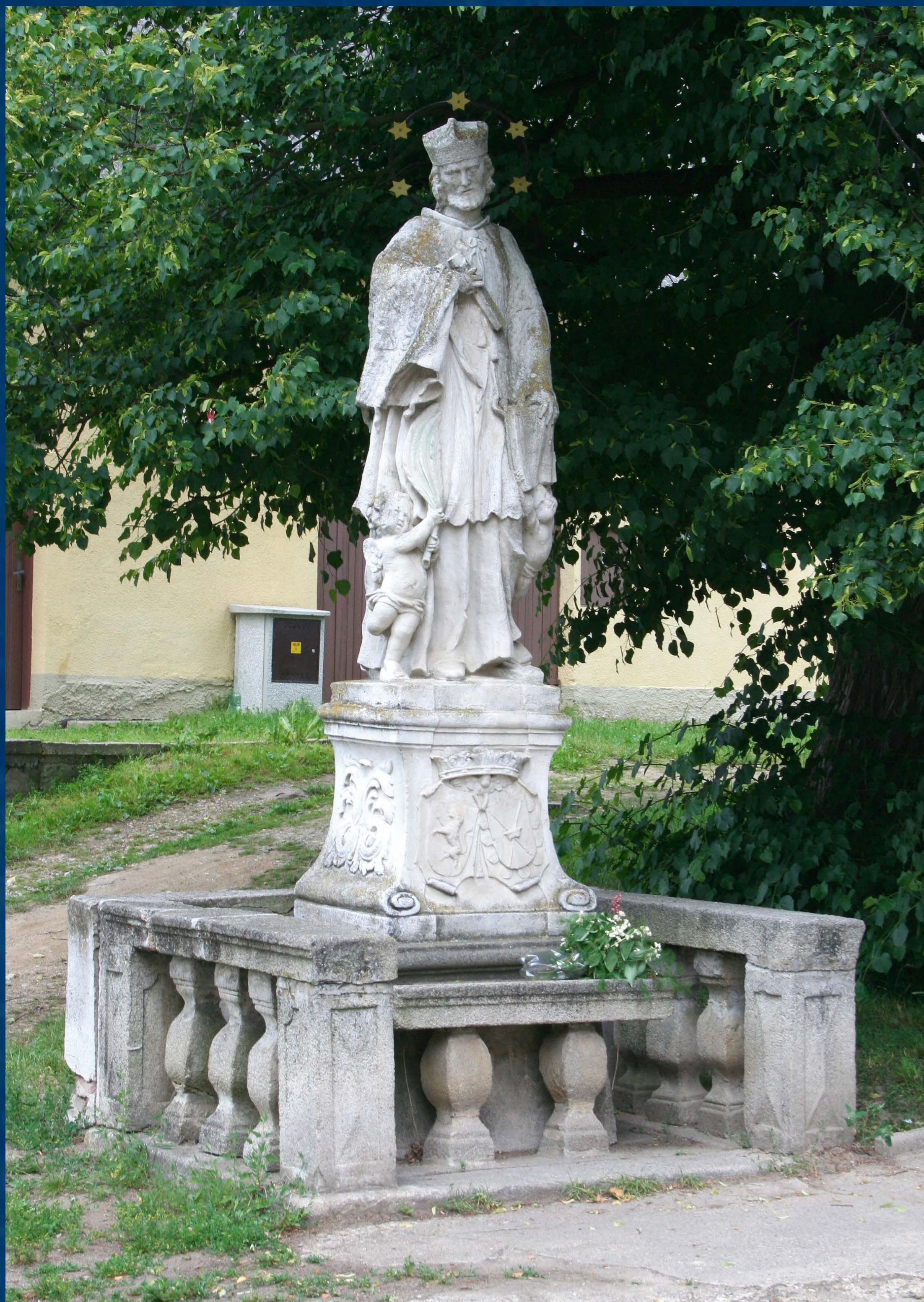
Socha sv. Jana Nepomuckého patnáct let po nevhodné úpravě