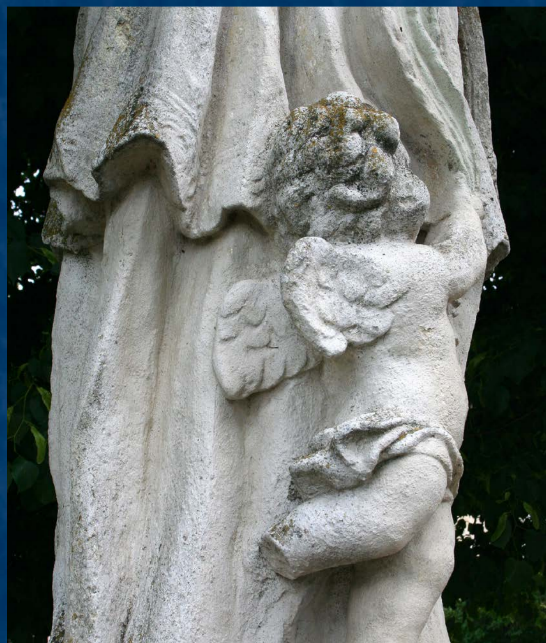
Detail andílka před restaurováním