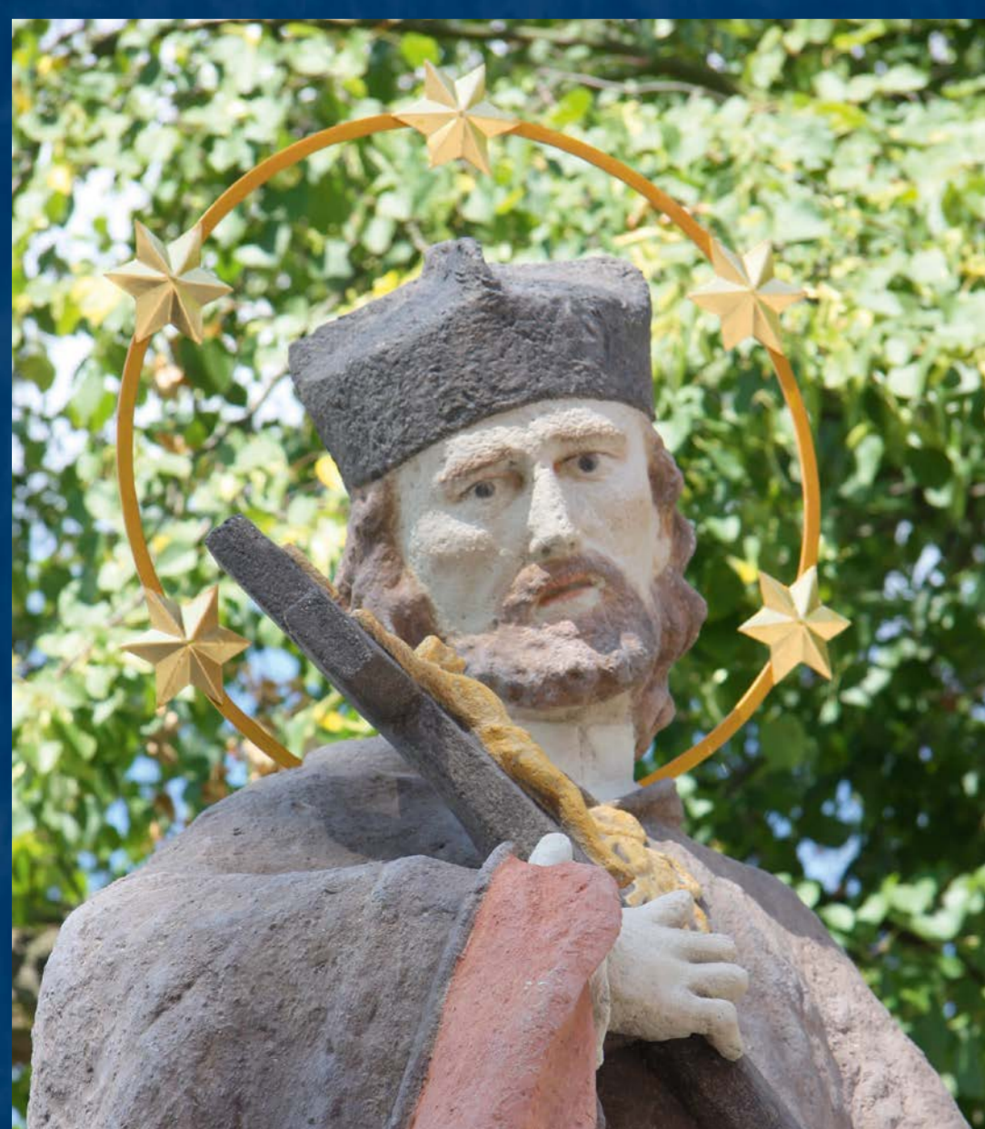
Poprsí sochy po restaurování a rekonstrukci barevnosti