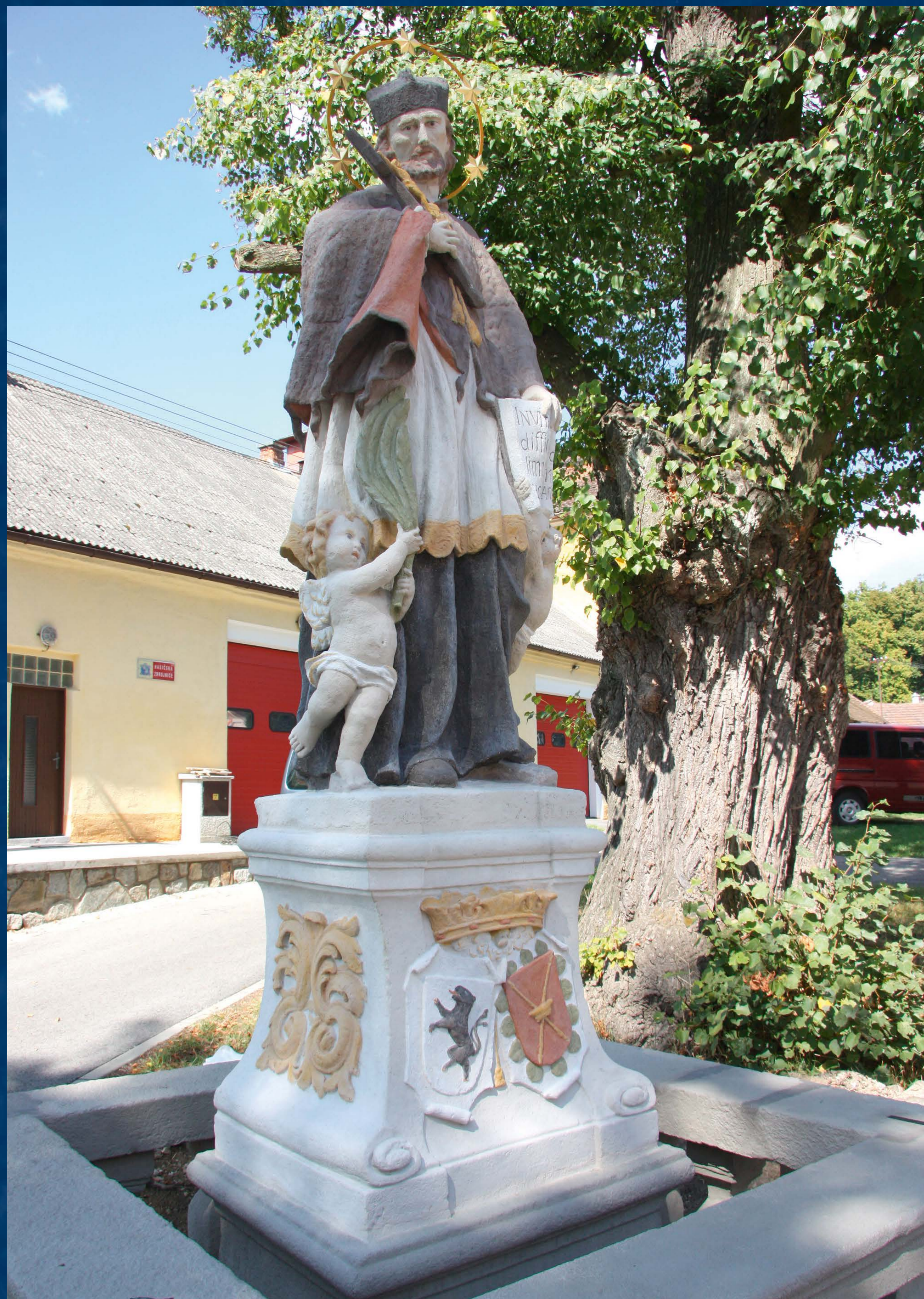
Socha sv. Jana Nepomuckého po restaurování a rekonstrukci původní barevnosti