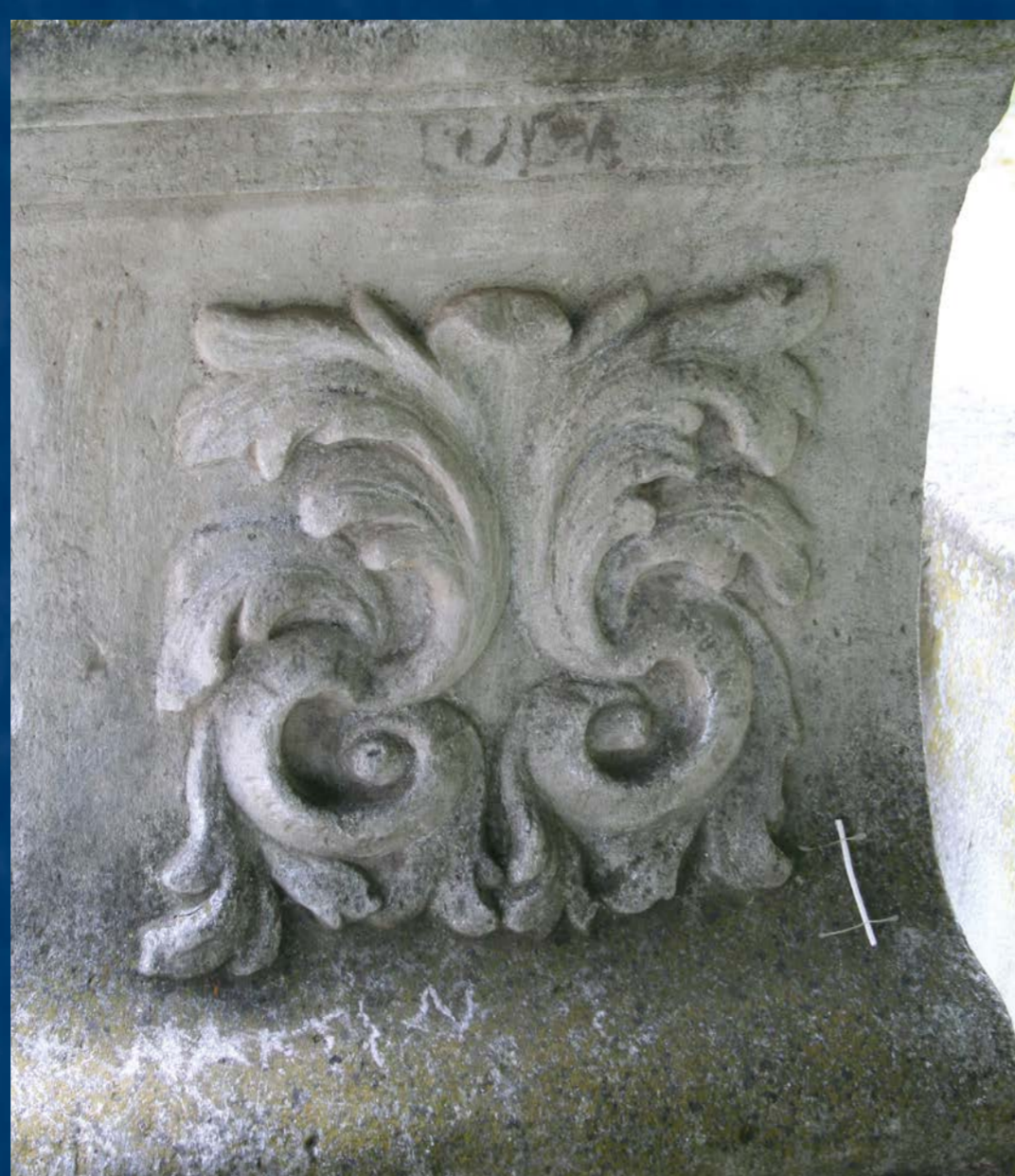
Akantová rozvilina na soklu před restaurováním