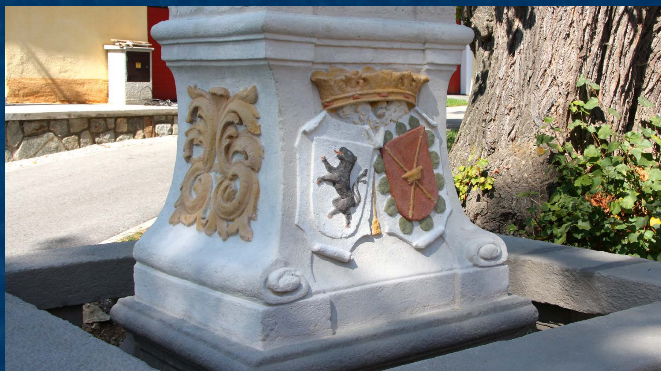
Akantová rozvilina a alianční znak majitelů panství na soklu po restaurování