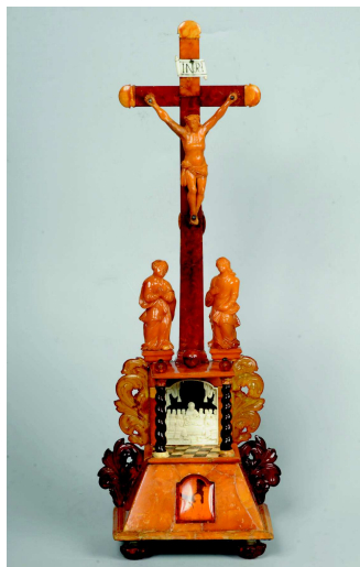
Jantarový domácí oltářík, čelní strana, stav po restaurování