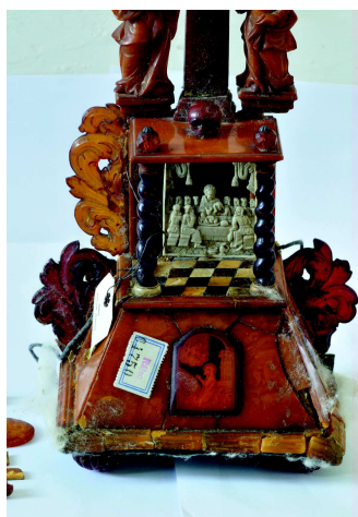
Jantarový oltářík, podstavec, stav před restaurováním