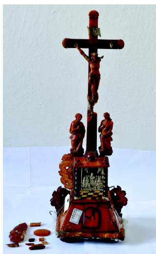
Jantarový domácí oltářík, stav před restaurováním

Autor textu: Lenka Kalábová