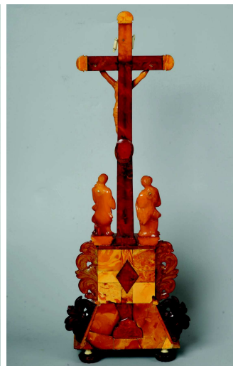
Jantarový domácí oltářík, zadní strana, stav po restaurování