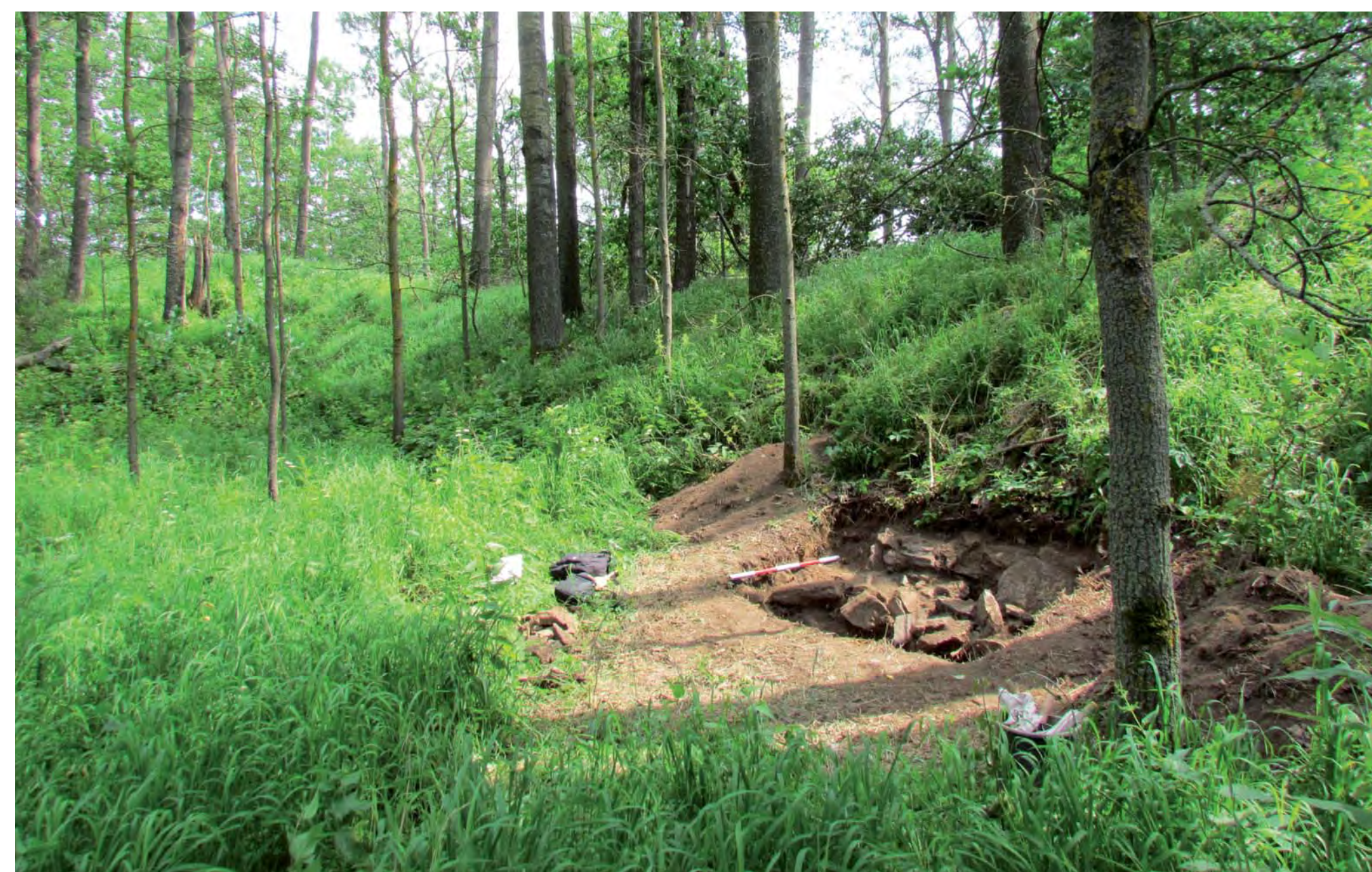
Vnitřní plocha lokality „Nový hrad“ u Stráže