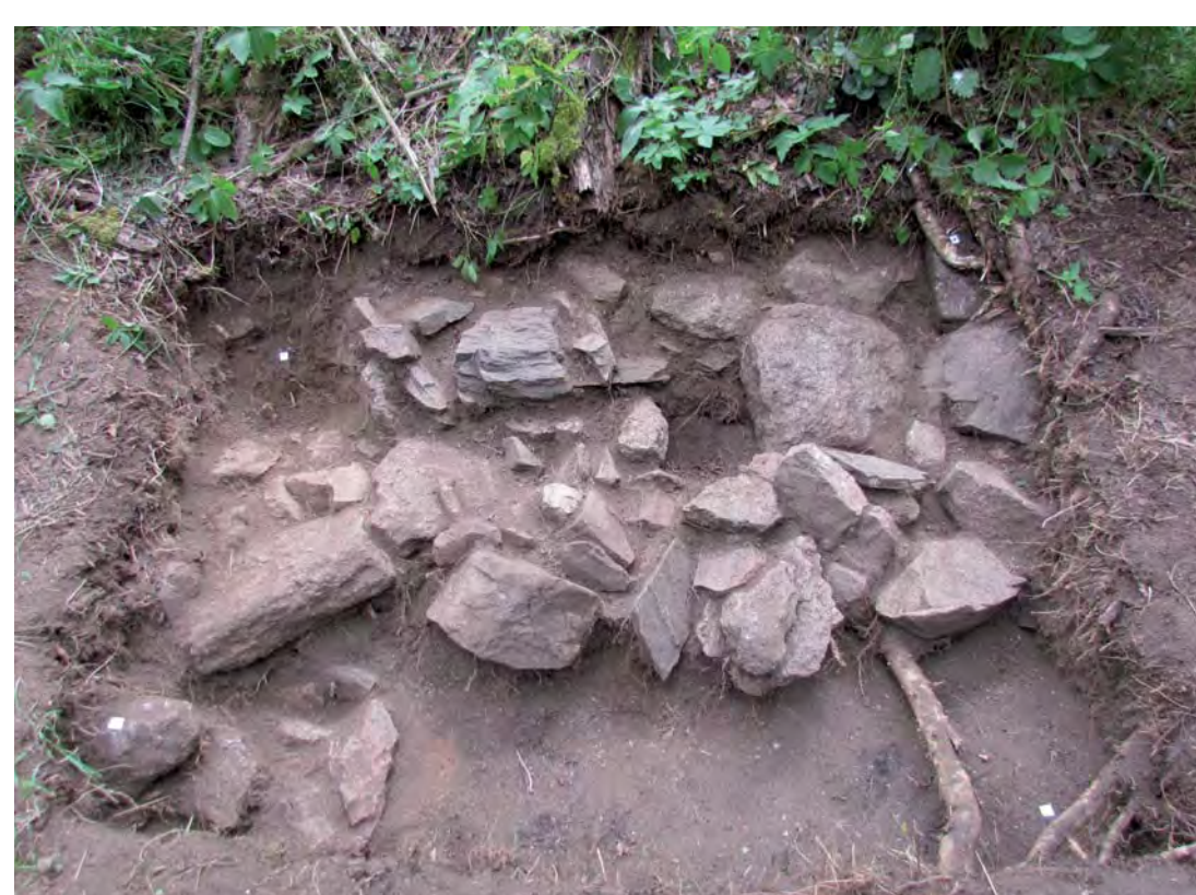
Destrukce zdiva na vnitřní straně valu