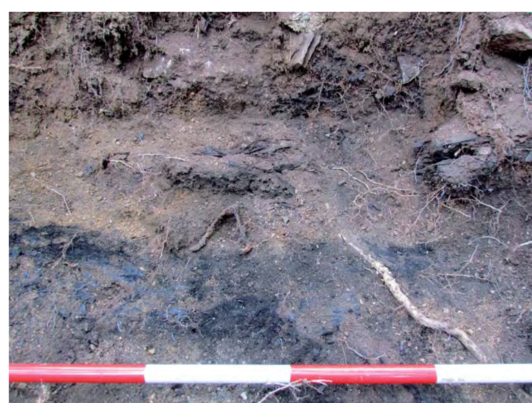
Vrstva tvořená spálenými trámy s nálezem železných předmětů