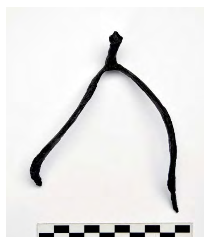
Nález ostruhy s pyramidálním bodcem