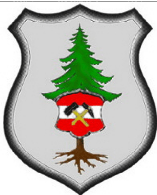
Přísečnice / Pressnitz