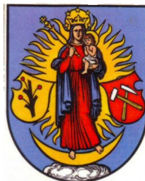
Kupferberg / Měděnec