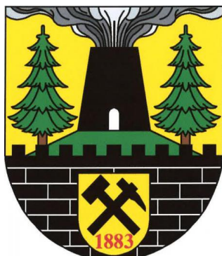
Schmiedeberg / Kovářská