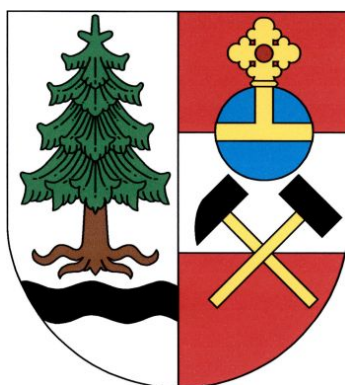
Christophammer / Kryštofovy Hamry