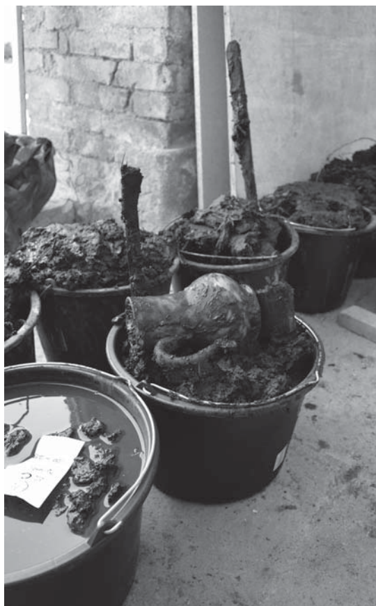
Těžení sedimentu barokní záchodové jímky v ambitu prelatury v Plasích

Mezi nejvýznamnějšími výzkumy hrazenými z finančních prostředků na ZAV lze jmenovat archeologický výzkum barokní záchodové jímky v ambitu prelatury kláštera v Plasích, ve které bylo odhaleno velké množství unikátně dochovaných nálezů, například pozůstatky textilu, skleněné nádoby, dřevěné konstrukce a torzo dřevěné figurky.