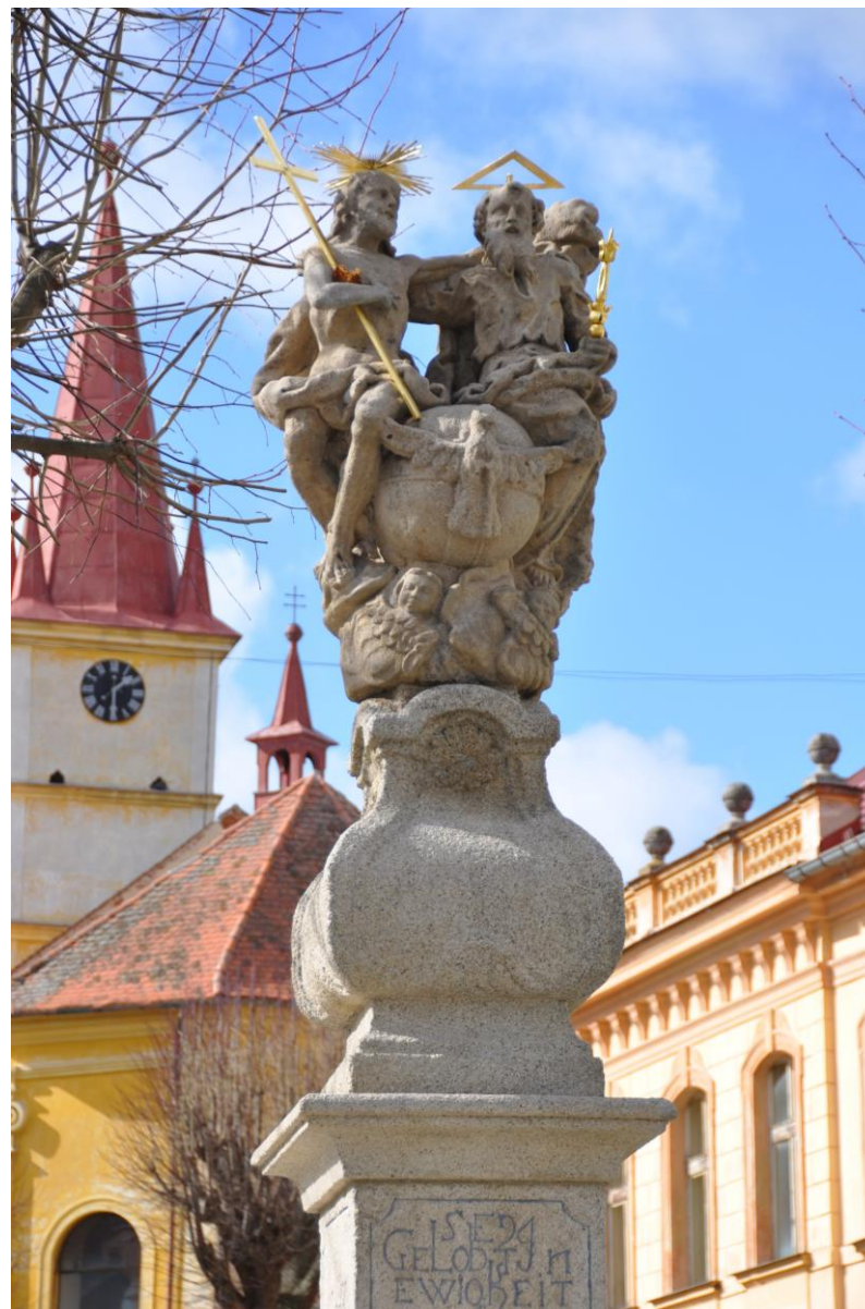
Hostouň (okr. Domažlice), Chodské náměstí, pilíř se sousoším Nejsvětější Trojice (Triumfální; foto nahoře vlevo a uprostřed). Dílo neznámého autora z roku 1722. Pilíř se sousoším byl restaurován v roce 2018 za podpory dotace z Plzeňského kraje. Rozsah prací patrný na snímcích, kde je zachycen stav v roce 2015 a 2020.