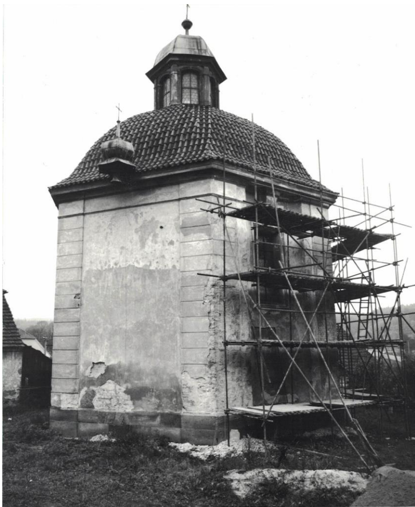
Mladotice (okr. Plzeň-sever), kaple Panny Marie. Centrální barokní stavba šestibokého půdorysu byla vybudována podle návrhu Jana Blažeje Santiniho v letech 1708-1710. Stav v roce 1996 a 2014.