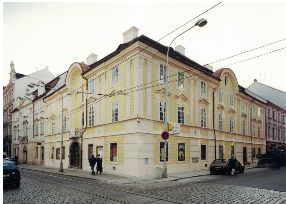
Plzeň, dům v Prešovské ul. č. 7 , kde sídlí Národní památkový ústav v Plzni od roku 2000 (foto po obnově v r. 1999).