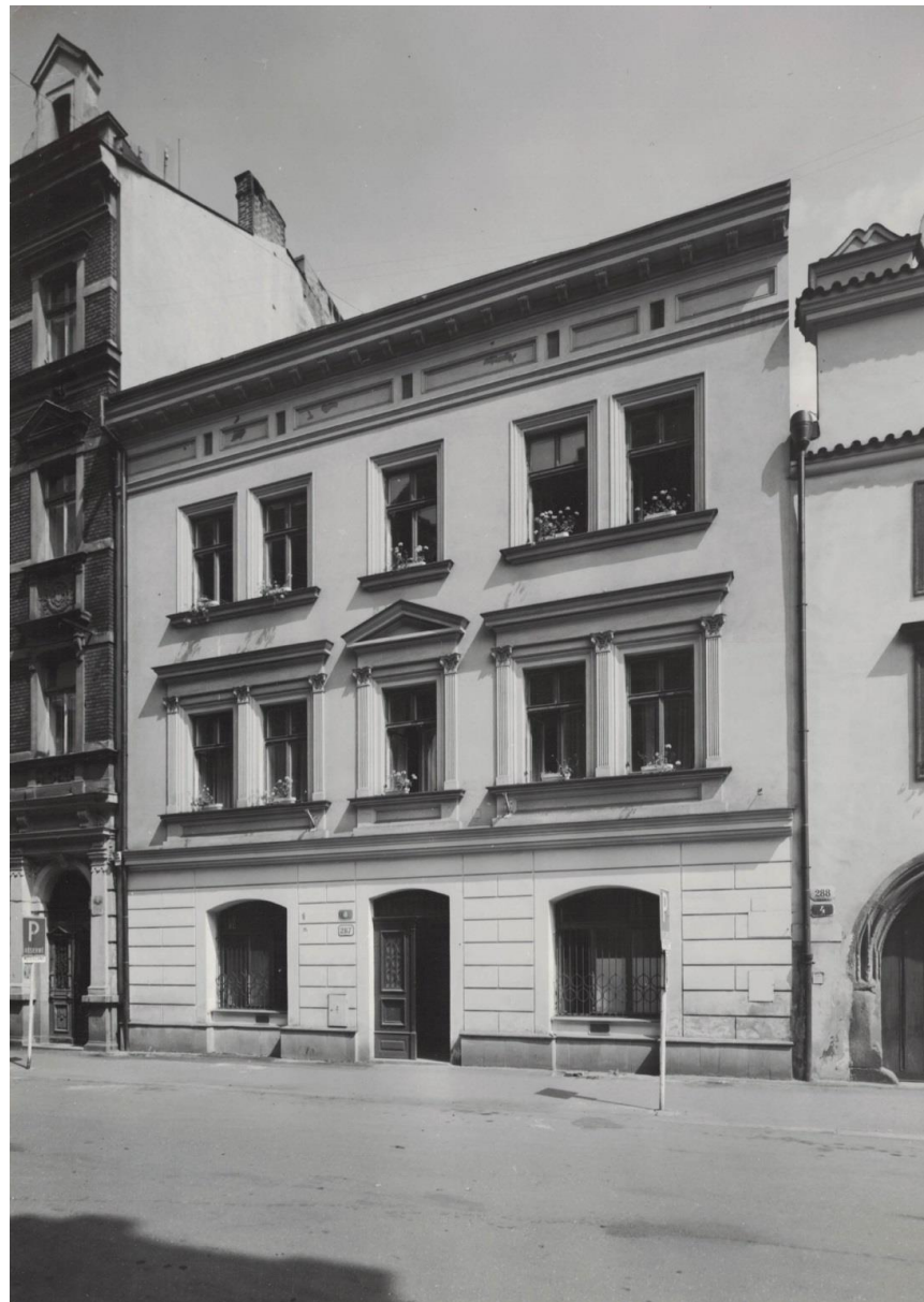
Plzeň, domy v Dominikánské ul. č. 4 (dole) a 6 (nahore) – první sídlo tehdejšího Krajského střediska státní památkové péče a ochrany přírody v Plzni, dnes Národního památkového ústavu v Plzni (foto 1986).