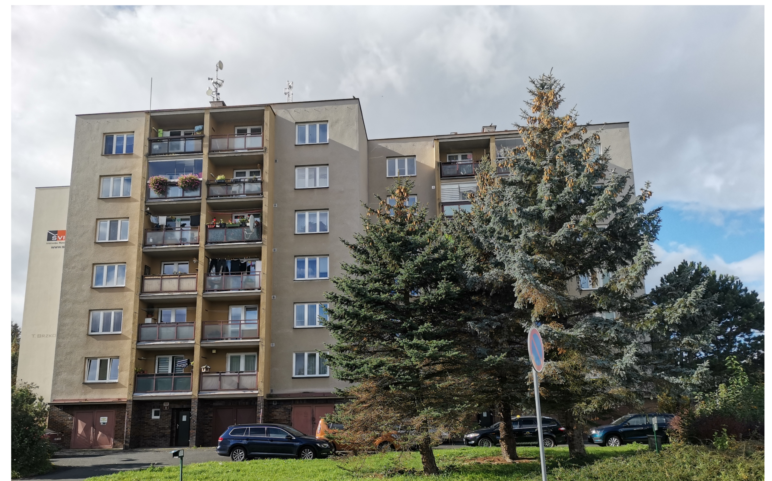
Skvrňany, sídlištní okrsek S 4, Pecháčkova čp. 1032/2, 1033/14, 1032/17, 1033/19, pohled od východu.