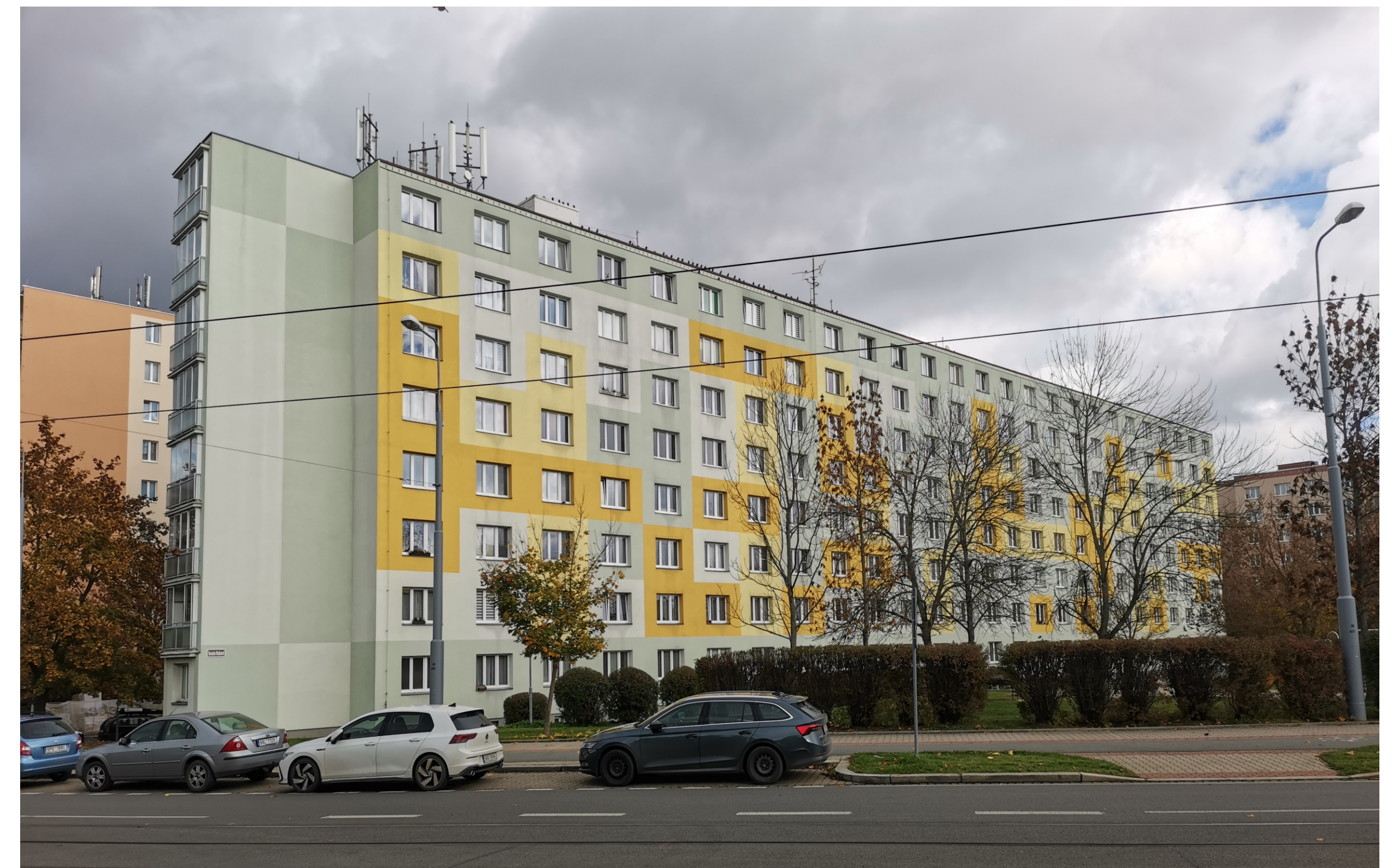
Skvrňany, sídlištní okrsek S 3, Macháčkova čp. 786/18, 187/20, 788/22, 789/24, 790/26, 791/28, pohled od jihozápadu. (Foto Markéta Marešová, 2022)