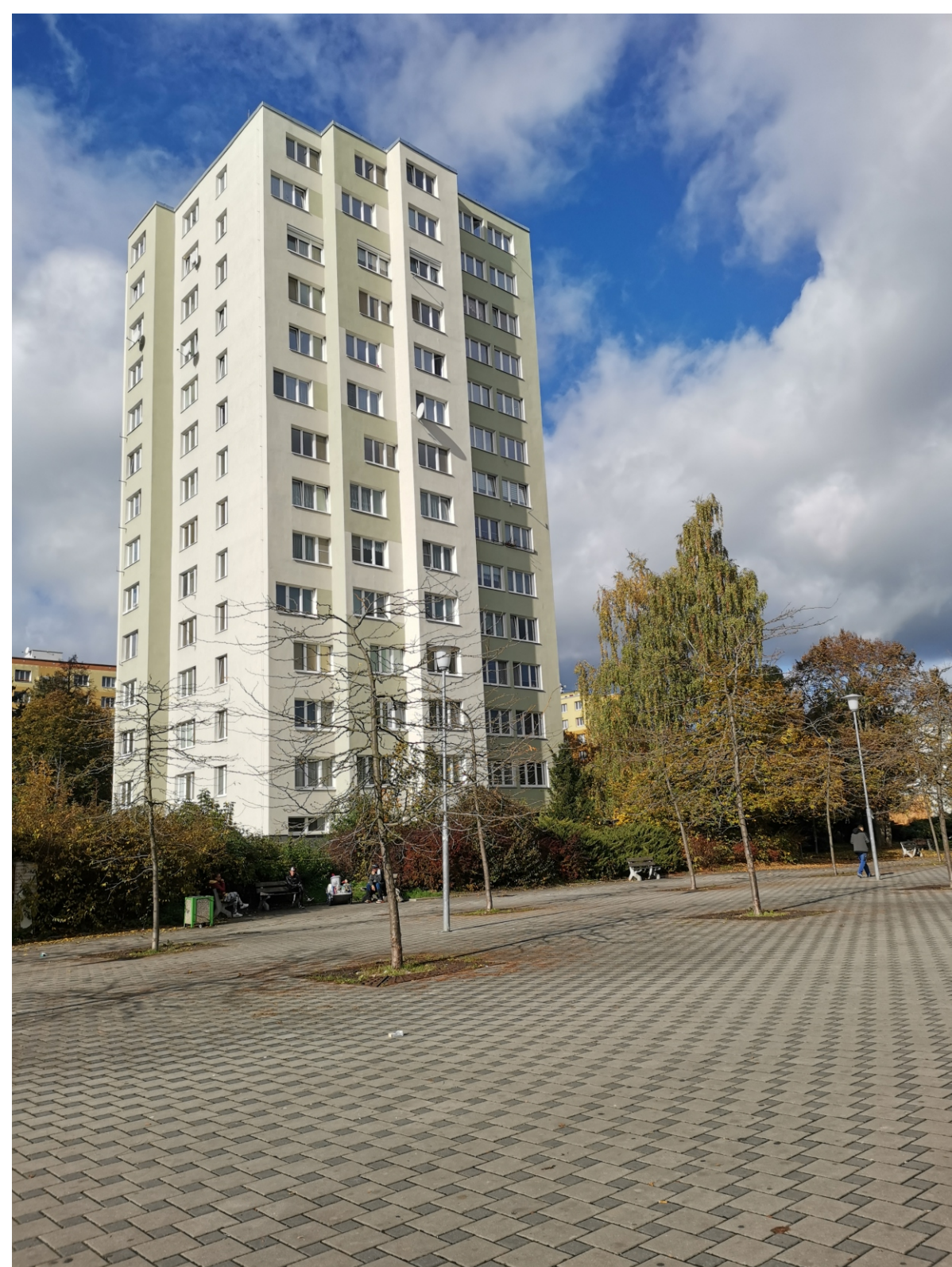
Skvrňany, sídlištní okrsek S 3, Macháčkova čp. 877/8, pohled od jihovýchodu. (Foto Markéta Marešová, 2022)