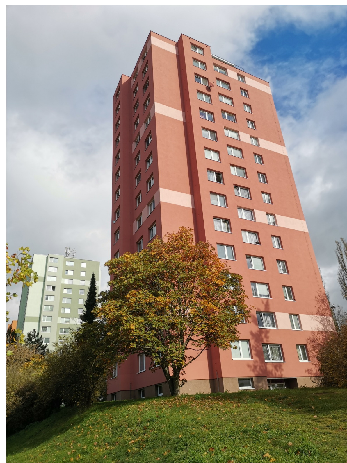
Skvrňany, sídlištní okrsek S 3, Macháčkova čp. 878/2, pohled od jihozápadu.