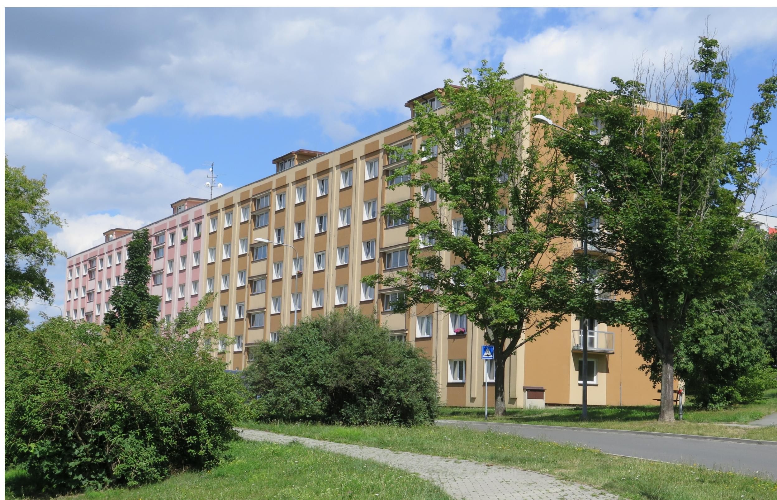
Doubravka, obytný soubor A, bytový dům Ke Kukačce čp. 798/10, 799/12, 800/14 a 801/18, pohled od jihozápadu. (Foto David Tuma, 2022)