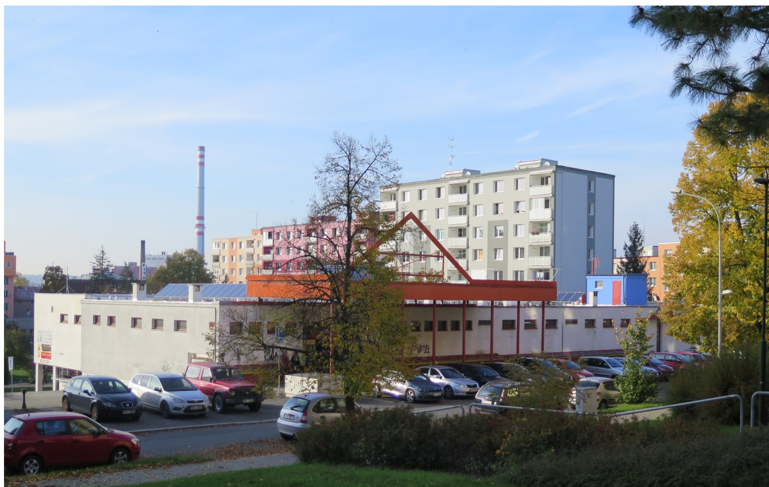
Doubravka, obytný soubor C, občanská vybavenost sídlště a v pozadí bytový dům Těšínská čp. 854/10 a 855/12, pohled od jihovýchodu.