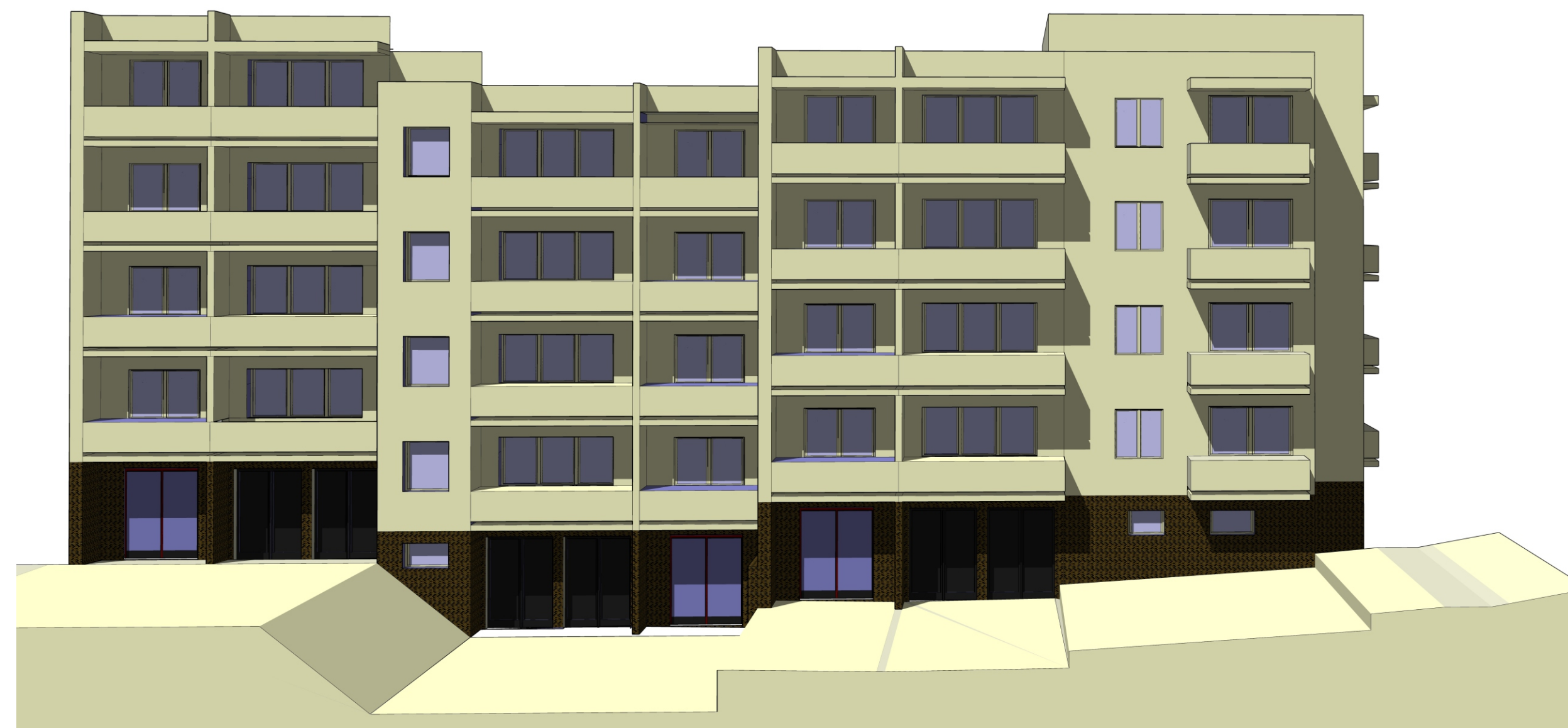
Doubravka, obytný soubor B, Nad Úslavou čp. 1119/14 a 1120/16, objekt č. 1, atypový bytový dům, západní pohled. (Zpracoval Martin Cikán, 2022)