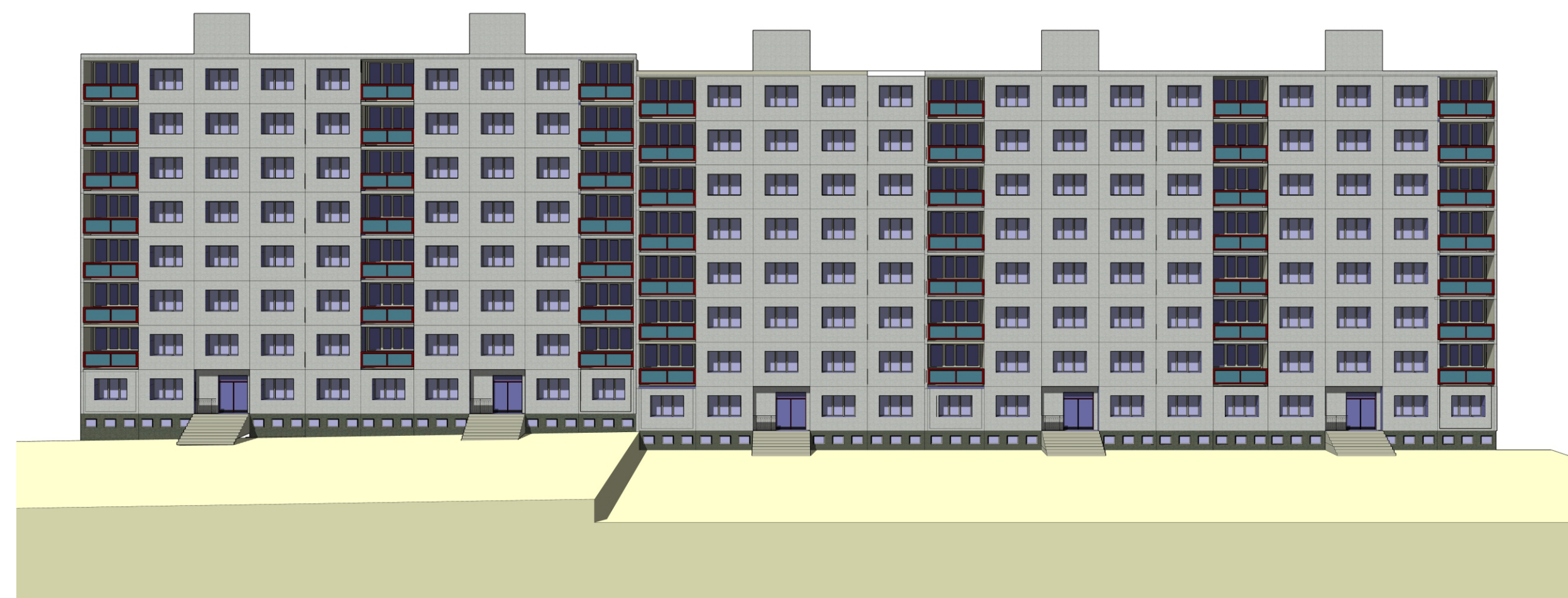
Doubravka, obytný soubor D, Staniční čp. 1222/48 – 1226/56, konstrukční soustava PS 69, pohled jihovýchodní. (Zpracoval Martin Cikán, 2022)