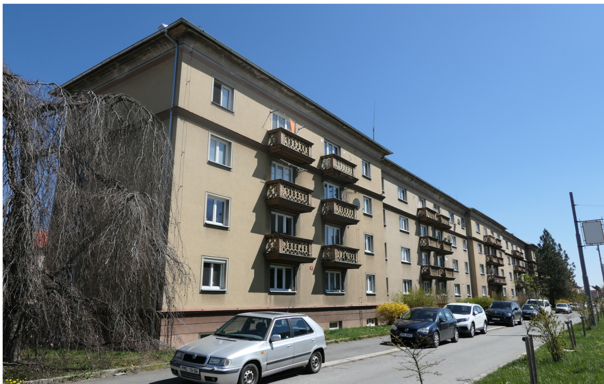
Slovany II, Nepomucká čp. 167/29 – 168/31 a 339/21 – 342/27, pohled od severozápadu.