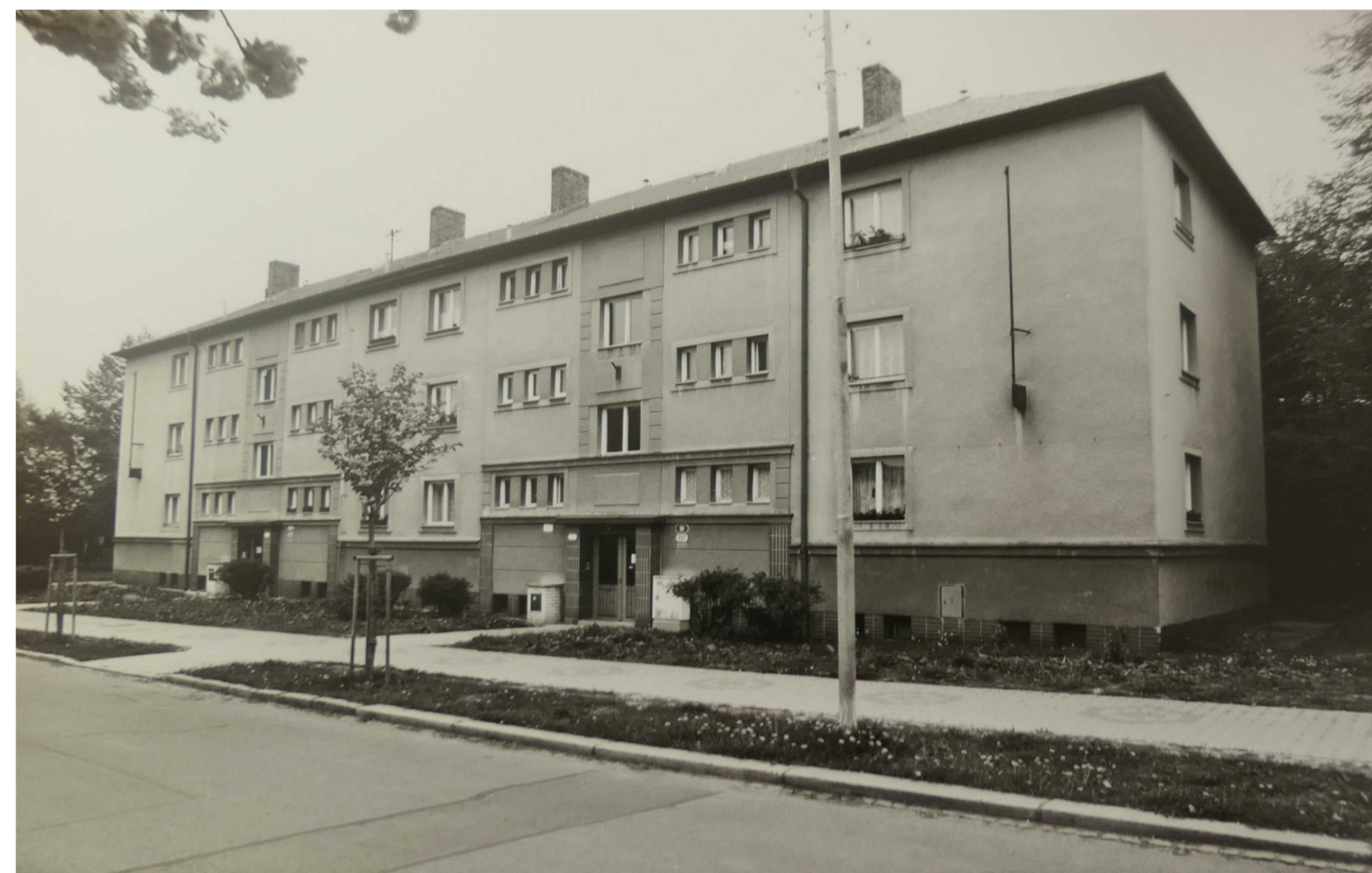
Slovany II, U Školky čp. 317/10 – 318/12, pohled od severozápadu.