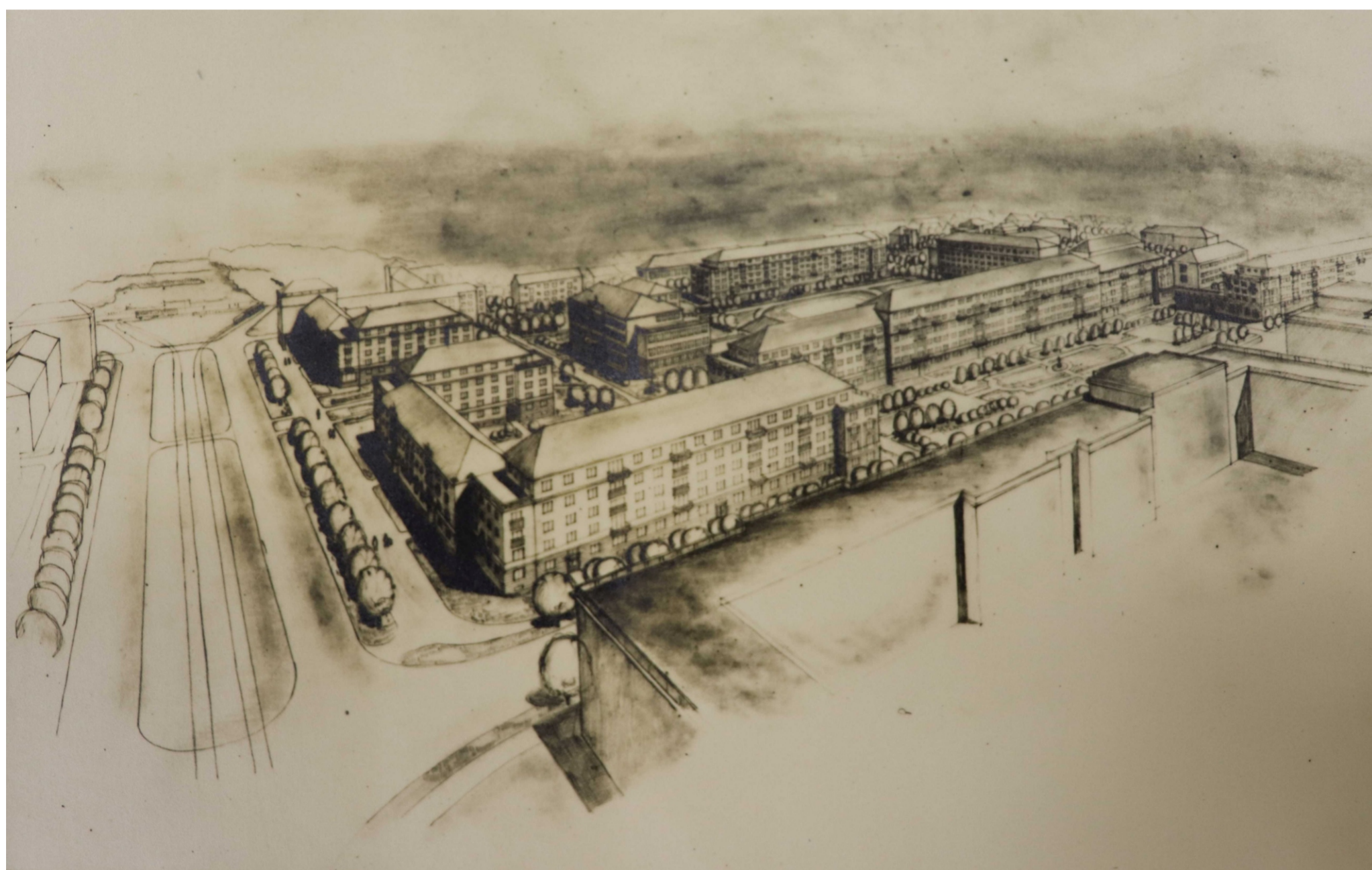
Slovany I, grafický návrh sídliště. (SOA Plzeň, pracoviště Klášter, f. Stavoprojekt Plzeň, kart. N204, inv. č./ev. č. 6055)