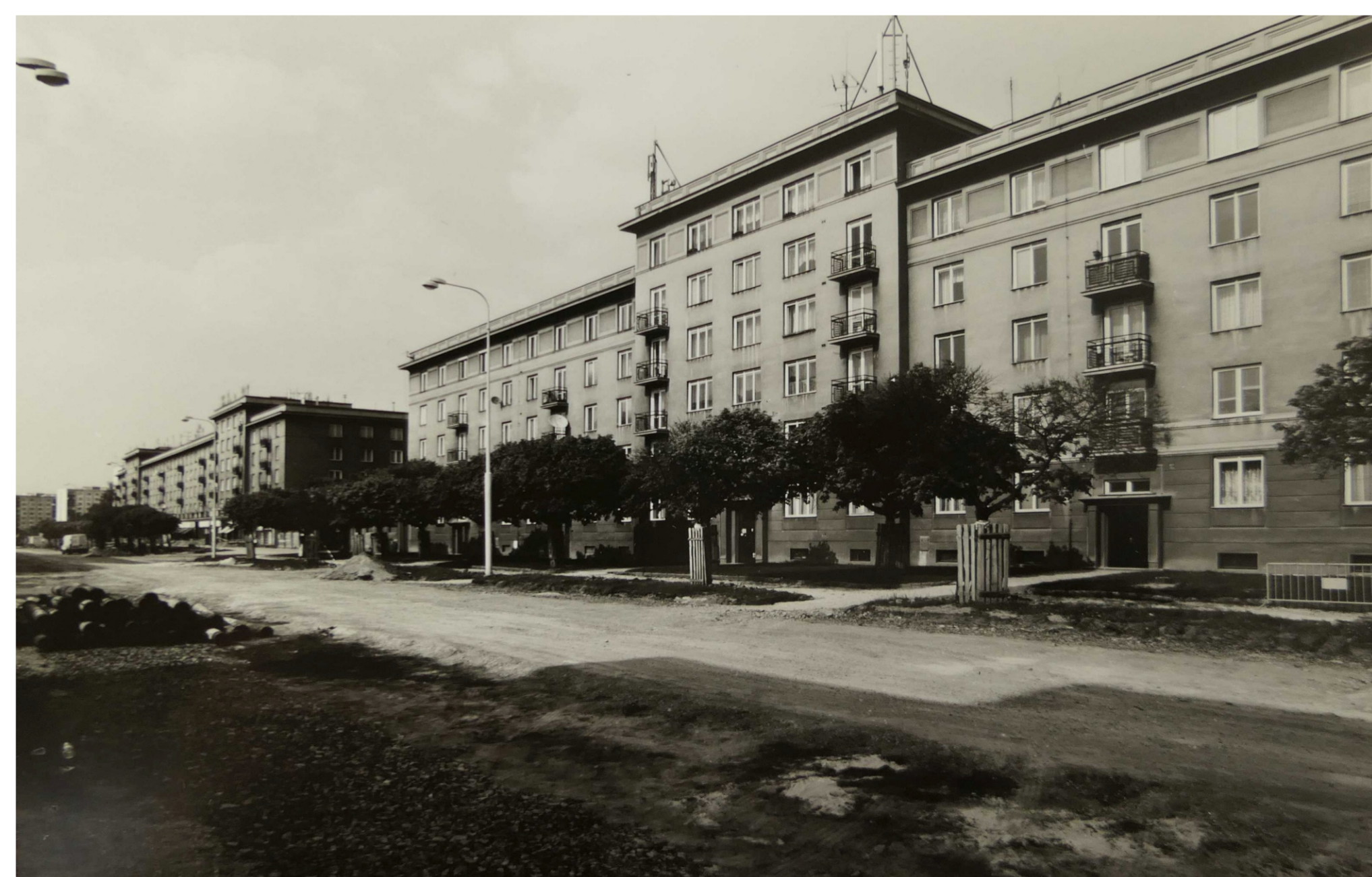
Slovany III, Francouzská třída, pohled od jihozápadu. (Fotoarchiv NPÚ ÚOP v Plzni, Radovan Kodera, 2006, č. neg. 283619)