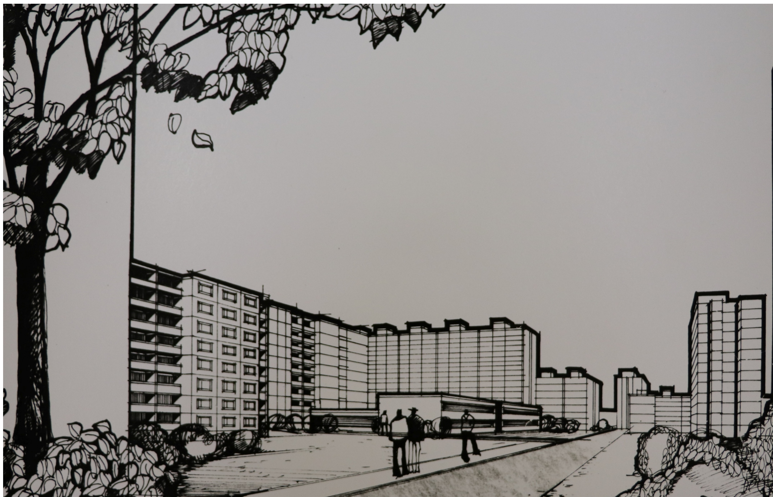
Severní Předměstí, Vinice – jih, obytný soubor – studie. (SOA Plzeň, pracoviště Klášter, f. Stavoprojekt Plzeň, kart. N204, inv. č./ev. č. 6053 – S53)