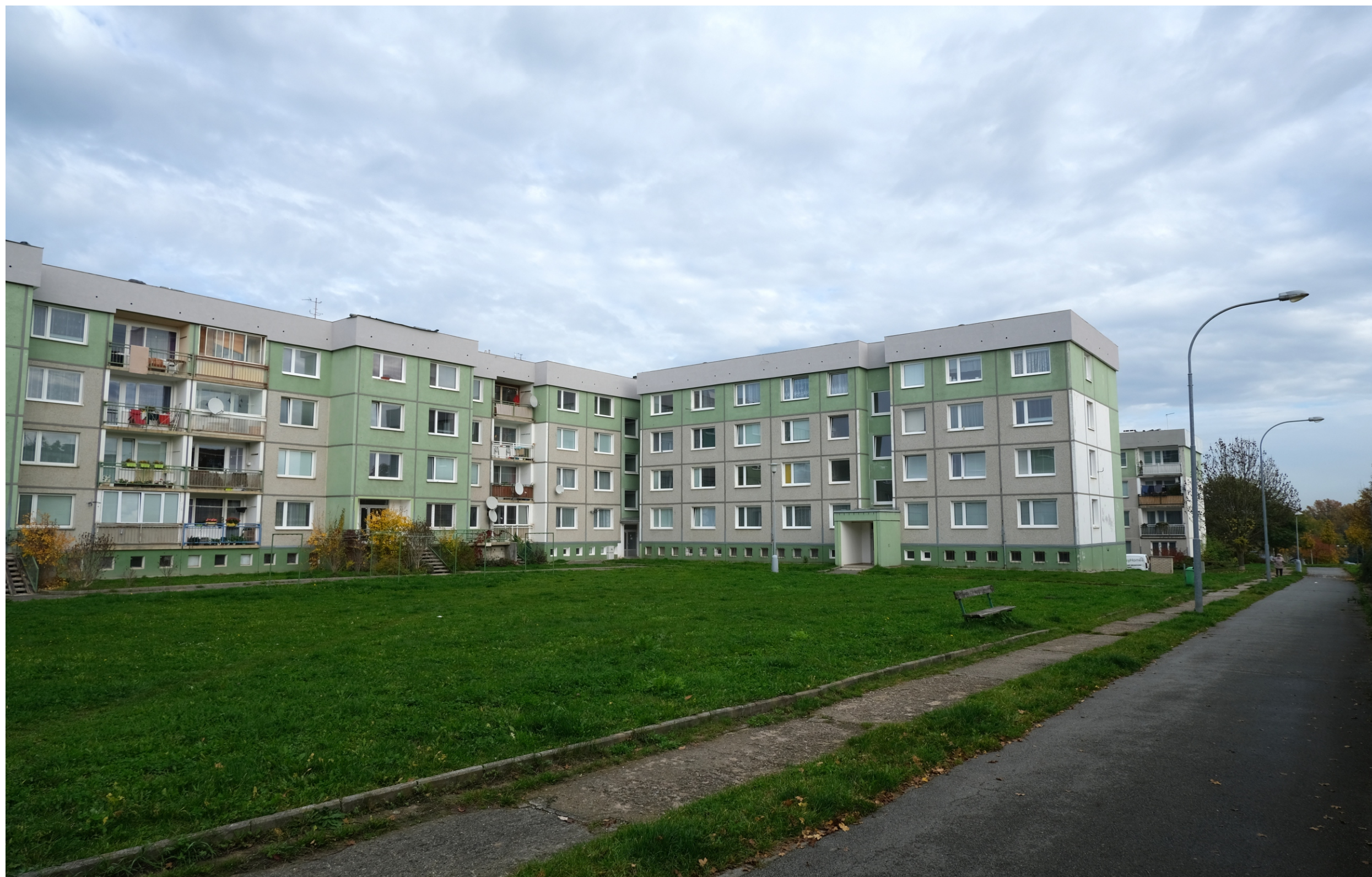
Severní Předměstí, Vinice, Bzenecká čp. 1075/28, 1074/26, 1073/24 a 1072/22, pohled od jihozápadu. (Foto David Tuma, 2022)