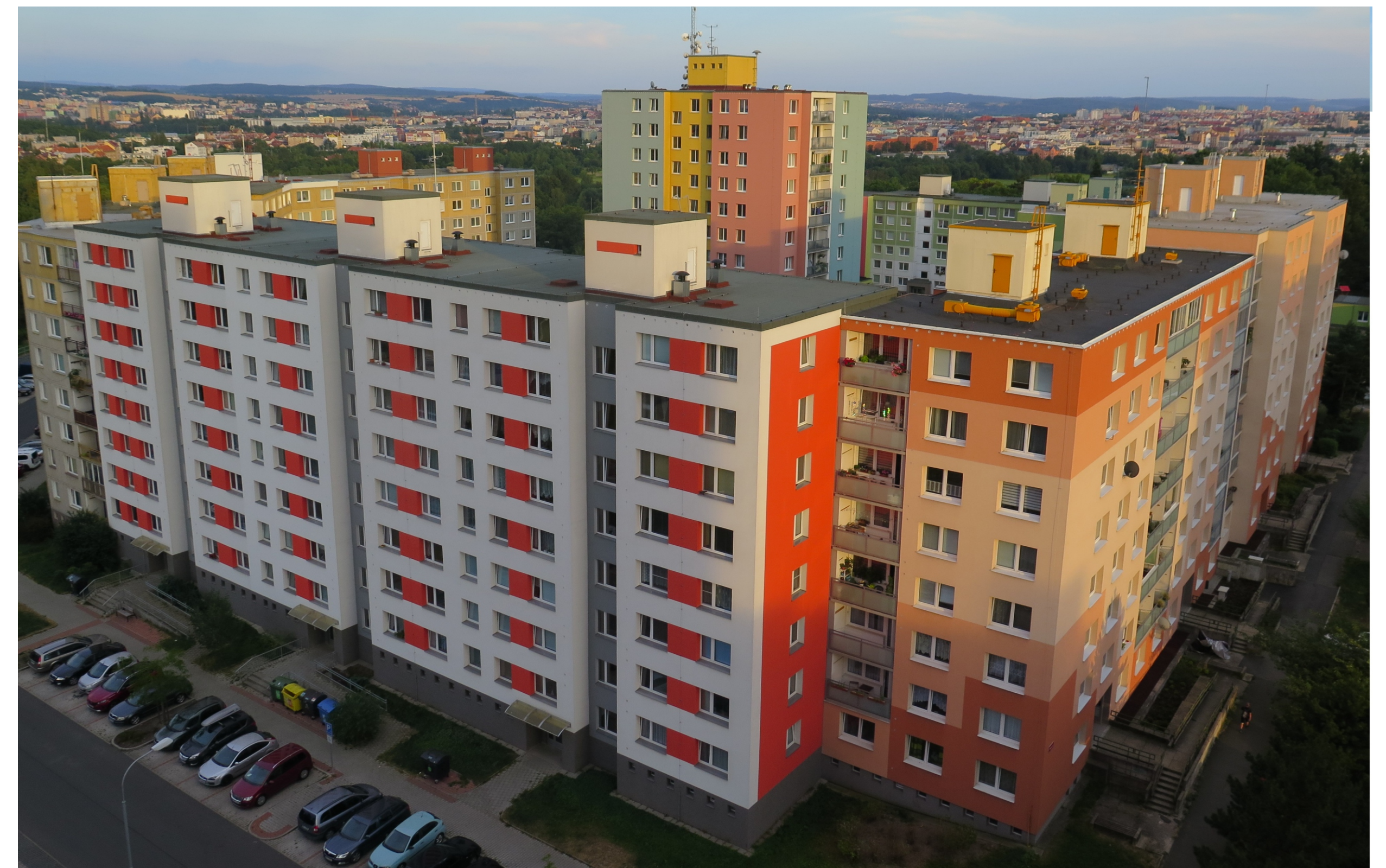
Severní Předměstí, Vinice, Brněnská čp. 957/19 – 954/13 a Břeclavská 963/1 – 966/7, věžový dům Brněnská 948/1, pohled od severozápadu. (Foto David Tuma, 2022)