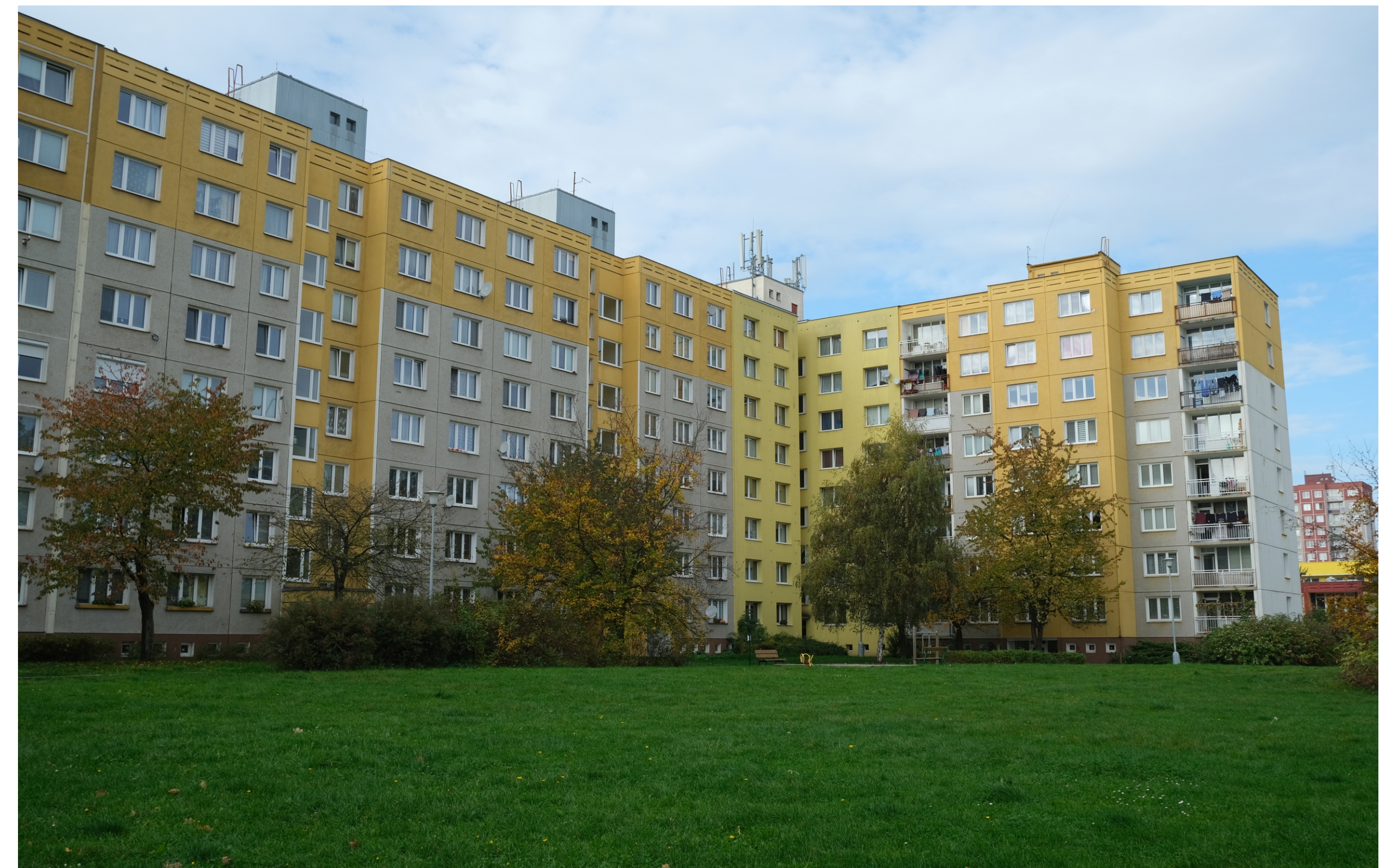
Severní Předměstí, Vinice, Bzenecká čp. 1056/5 – 1054/1 a Brněnská čp. 1054/51 a 1053/49, pohled od jihovýchodu. (Foto David Tuma, 2022)