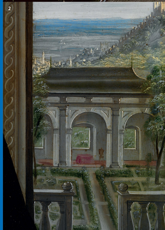
2/ Praha, letohrádek v domě čp. 321/III na Malé Straně na obraze Wolfganga Heimbacha, portrét dámy (dcery Guntakera z Herbersteinu?) z roku 1651. [Muzeum umění Olomouc, inv. č. O 396. Foto: Lumír Čurík]