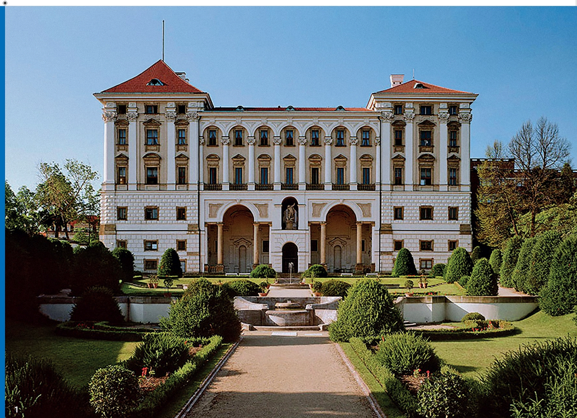
1/ Praha, Černínský palác, loggie. Francesco Caratti, 1669–1682.

Při známkování Valdštejna jako zrádce národa bychom si tak měli uvědomit, že to byl on, kdo bezprecedentním způsobem přispěl právě ke kvalitě národního dědictví, k němuž se můžeme hrdě hlásit. Valdštejn je tak příkladem toho, že dějiny nelze číst černobíle. I když nelze očekávat, že by někdy Valdštejn ohrozil Top 10 soutěže o největšího Čecha, a na hoře Vítkově nedojde k výměně sochy jezdce, bylo by vhodné jeho osobní profil spravedlivě vyvážit jeho nespornými zásluhami o krásu a bohatství naší země.