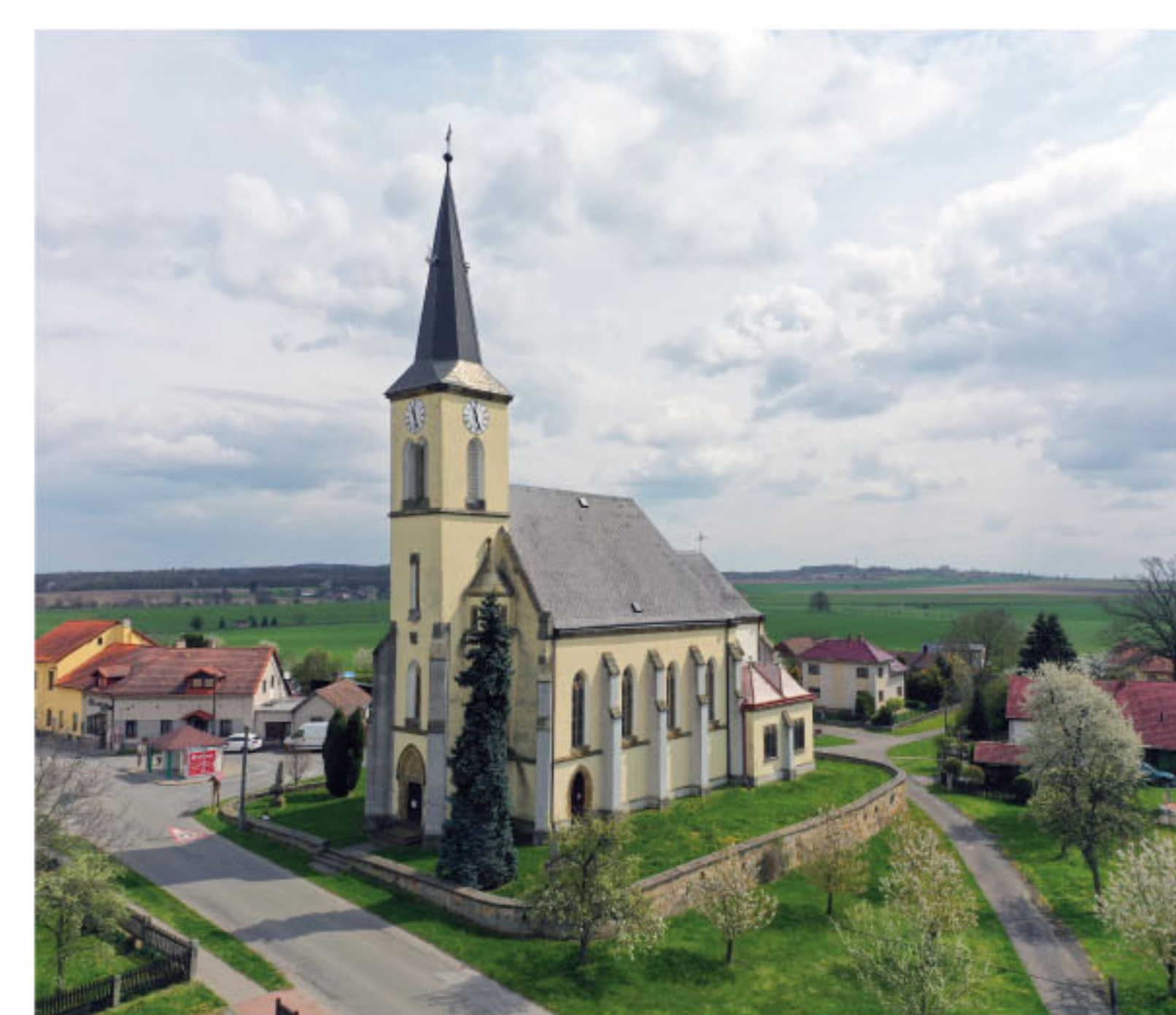
← Současný kostel sv. Jana Křtitele. Vlevo od věže můžete vidět jeden ze dvou obelisků ze štítů polygonální části původního kostela.