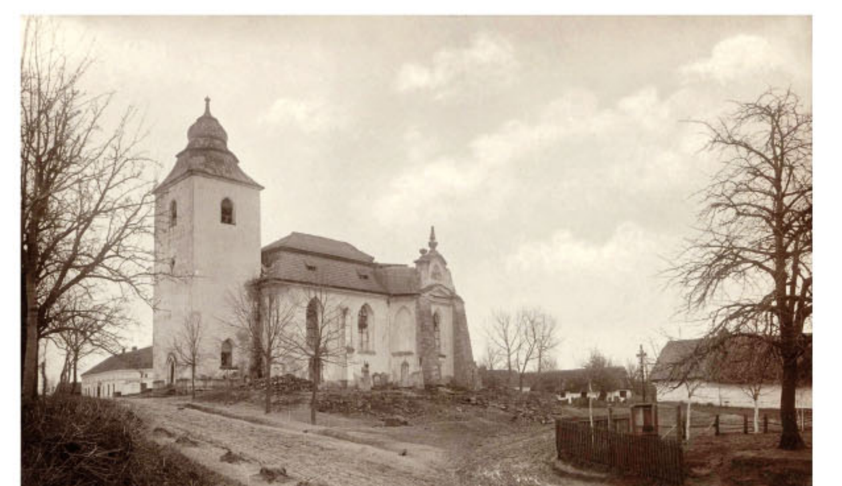
Fotografie kostela sv. Jana Křtitele pořízená po zřícení klenby presbytáře kostela v roce 1888. Nad mansardovou střechou v pravé části kostela již chybí lucerna, jejíž vrchol zdobil santiniovsky výrazný symbol Nejsvětější Trojice.