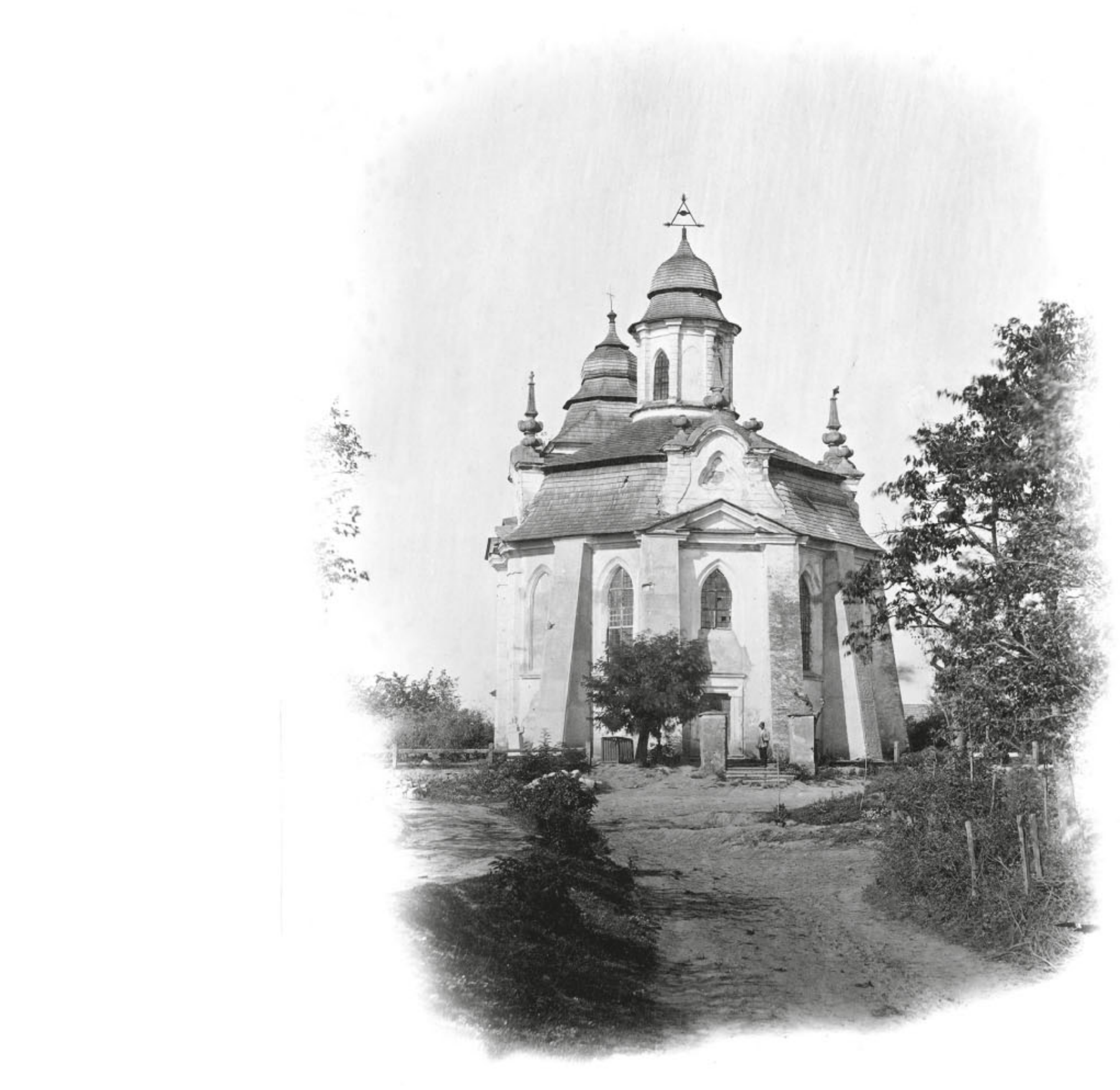
Kostel sv. Jana Křtitele na fotografii před rokem 1888.