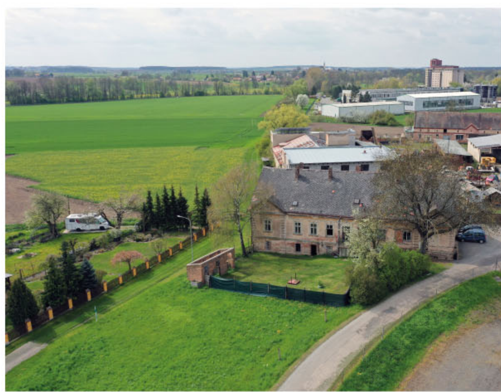
Areál bývalého zámku Sadová. Zámek stál v prostoru louky, na snímku uprostřed vlevo.

Zámek byl postaven nejspíš mezi lety 1723, kdy Santini Sadovou alespoň dvakrát navštívil, a 1728, kdy byla 5. srpna vysvěcena zámecká kaple. V roce 1844 zámek vyhořel a Harrachové, kteří již v nedalekém Hrádku stavěli své nové letní sídlo, se rozhodli sadovský zámek neobnovit. Byl zcela rozebrán a v jeho místě byly vysazeny sady.