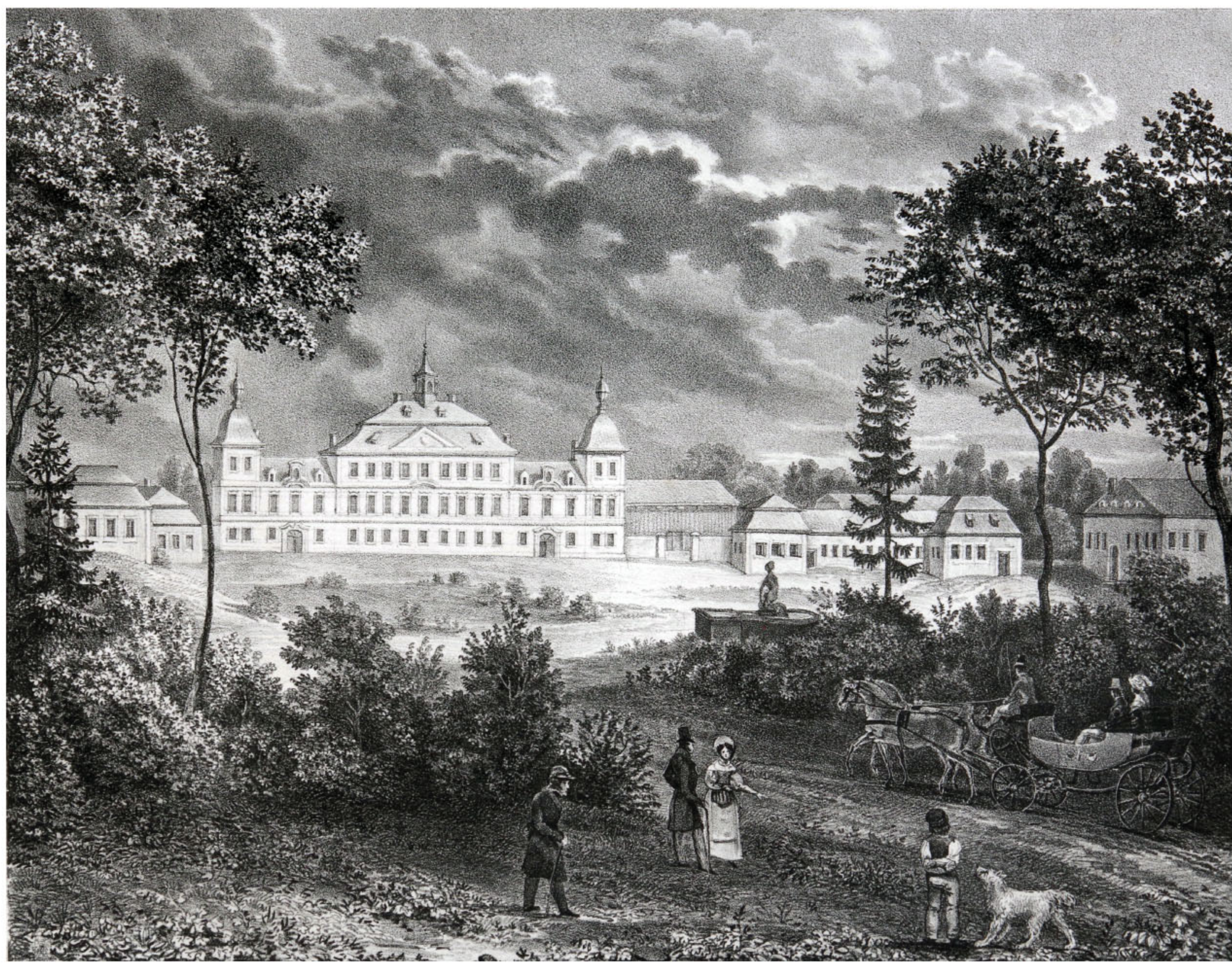
Zámek Sadová na veduté Fr. A. Kunikeho, kolem 1830.