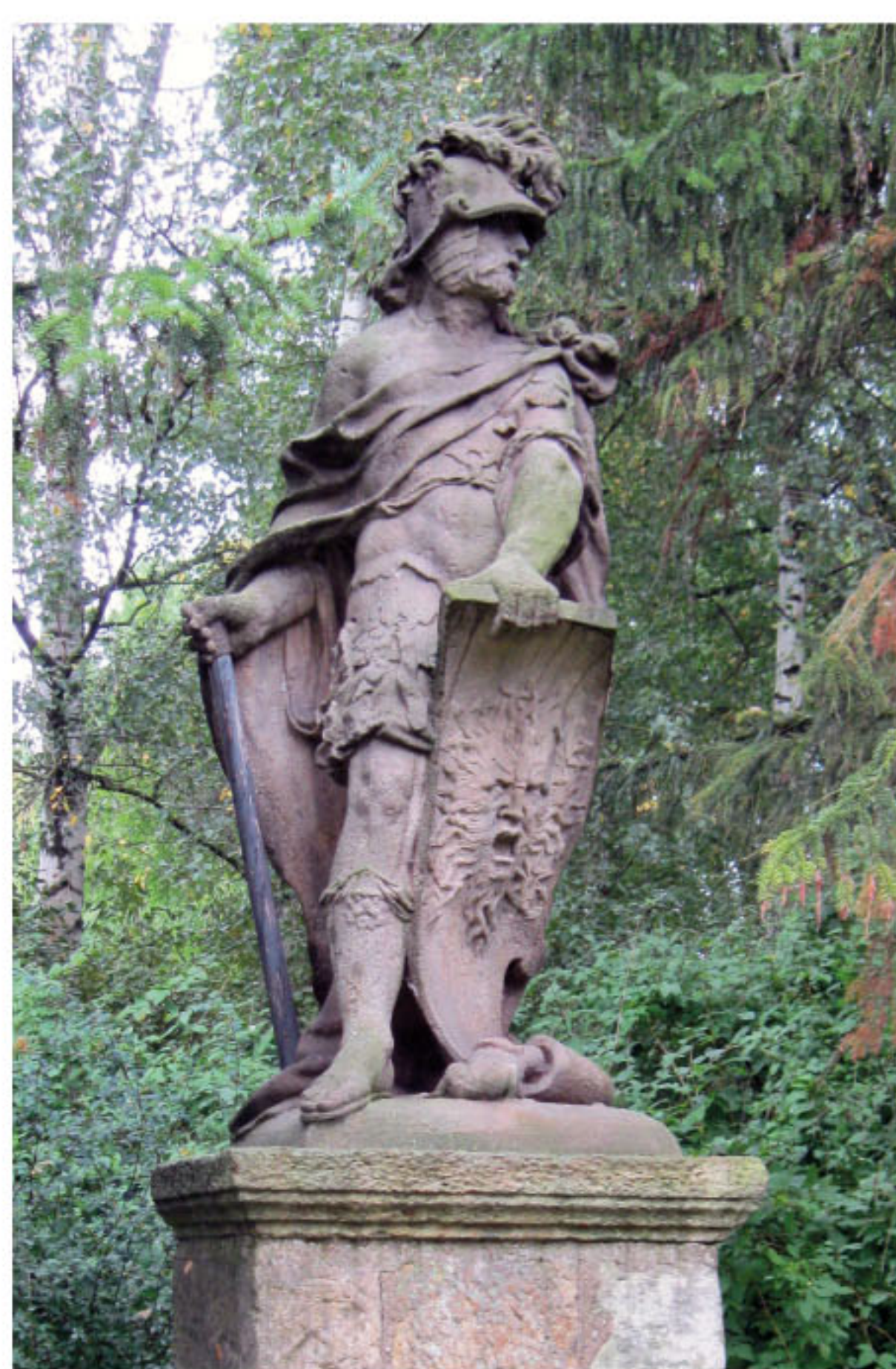
← Socha Persea, jediný známý pozůstatek sadovského zámku. Socha dnes stojí v Dohaličkách.