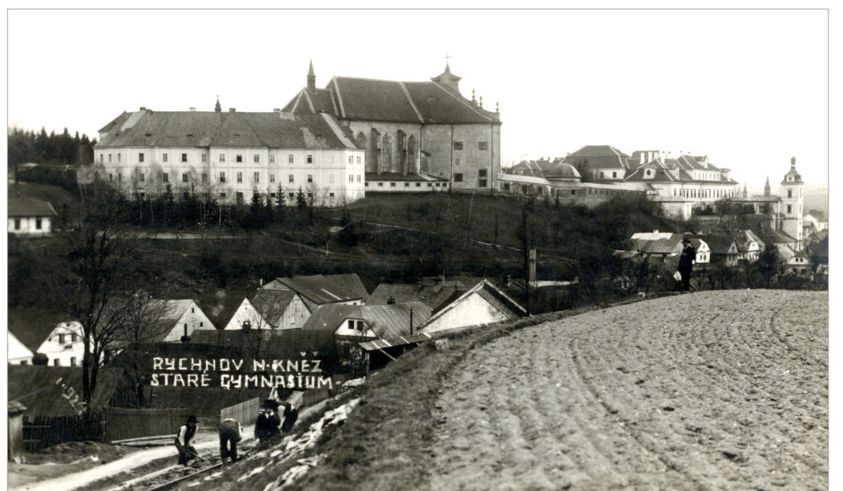
Zámecký areál na fotografii z roku 1918. Vlevo od kostela ještě stojí budova piaristické koleje, adaptovaná v letech 1877 a 1893 na provoz gymnázia. V roce 1918 budova vyhořela a následně byla zbořena. Zůstala jen střední část jižního křídla, které stavebně navazuje na kněžiště kostela Nejsvětější Trojice.