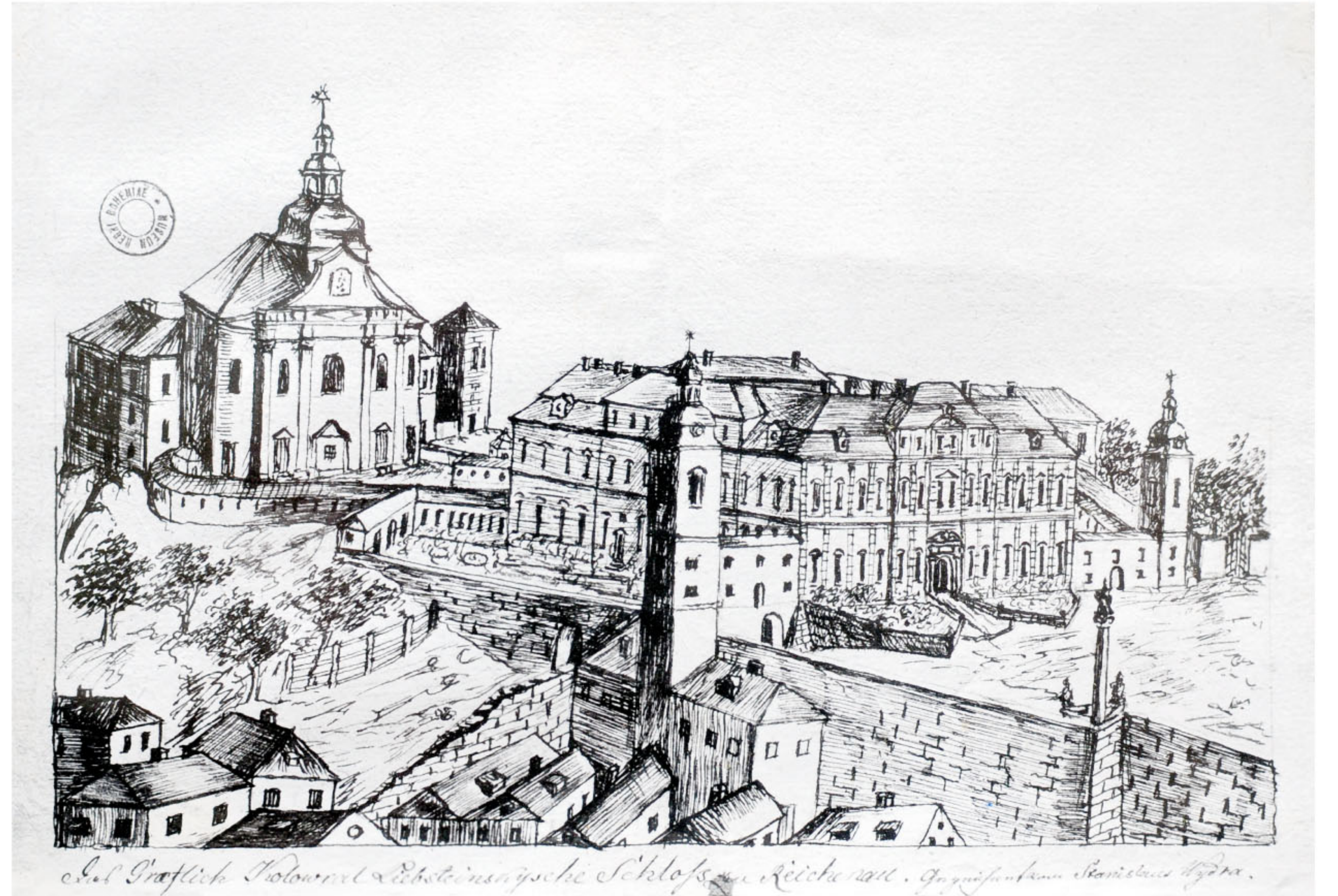
Zámek s kostelem Nejsvětější Trojice a piaristickou kolejí na kresbě Stanislava Vydry z 18. století. Kresba je vzácná tím, že ukazuje kompletní Santiniho řešení. Jde zejména o věžovou nástavbu kostela se symbolem Nejsvětější Trojice ve vrcholu, která bohužel nebyla po požáru kostela v roce 1798 obnovena. Mezi zámek a kostelem je vidět i ohrazení s pavilonovou stavbou, které ohraničovalo prostor před kostelem z východní strany.