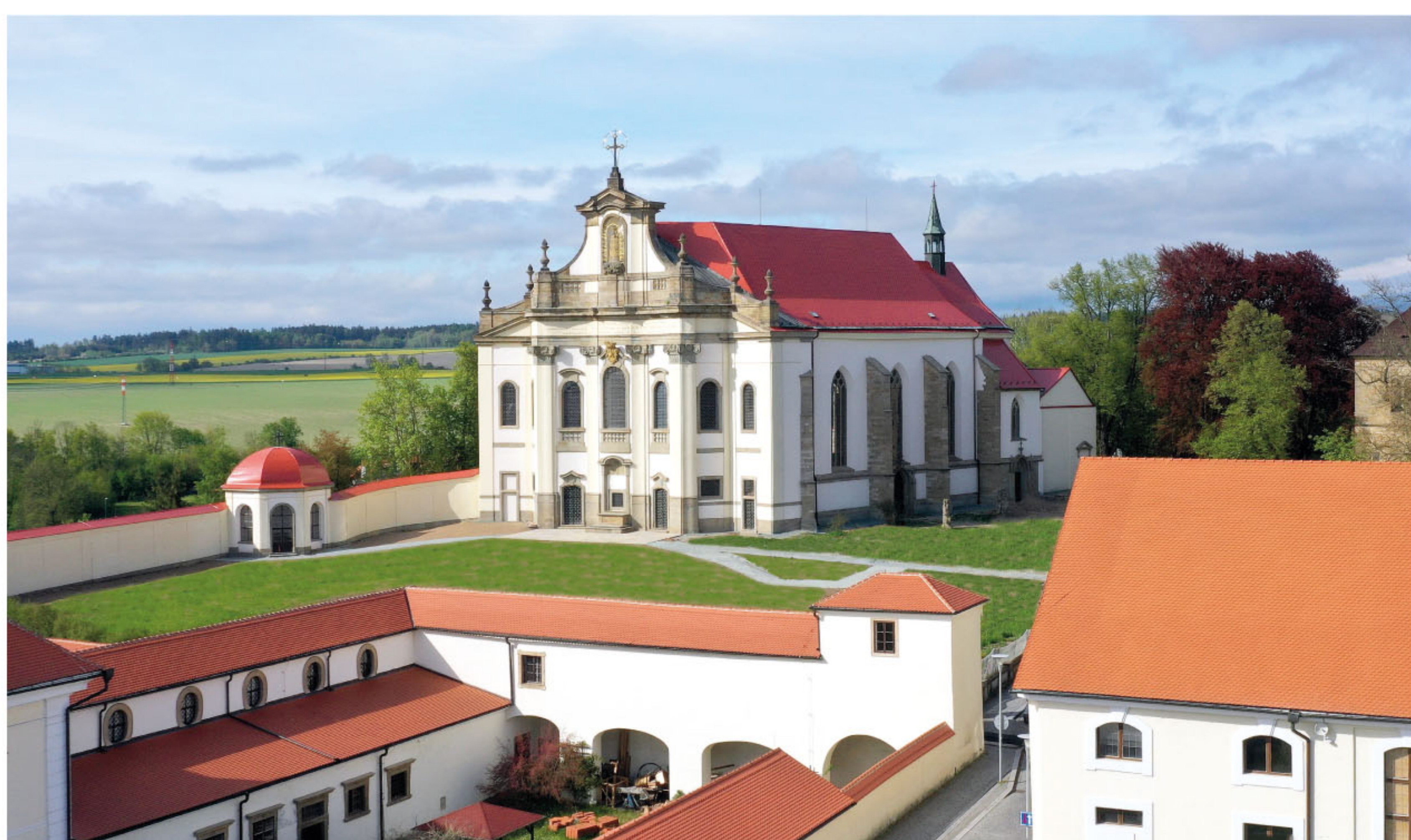
Kostel Nejsvětější Trojice, na který zleva navazuje propojovací chodba se zámek s kaplí vloženou do jejího zalomení. V popředí je vidět těleso další chodby, která spojovala zámek s budovou jízdárny vpravo.

Stavět se začalo nejpozději 1713, tento letopočet nese vstupní brána do prostoru u kostela Nejsvětější Trojice. Od roku 1714 bylo stavěno jeho průčelí s loretánskou kaplí, následovala piaristická kolej, přestavba a rozšíření zámku a stavba jízdárny. Celý areál byl stavěn podle jednotného konceptu.