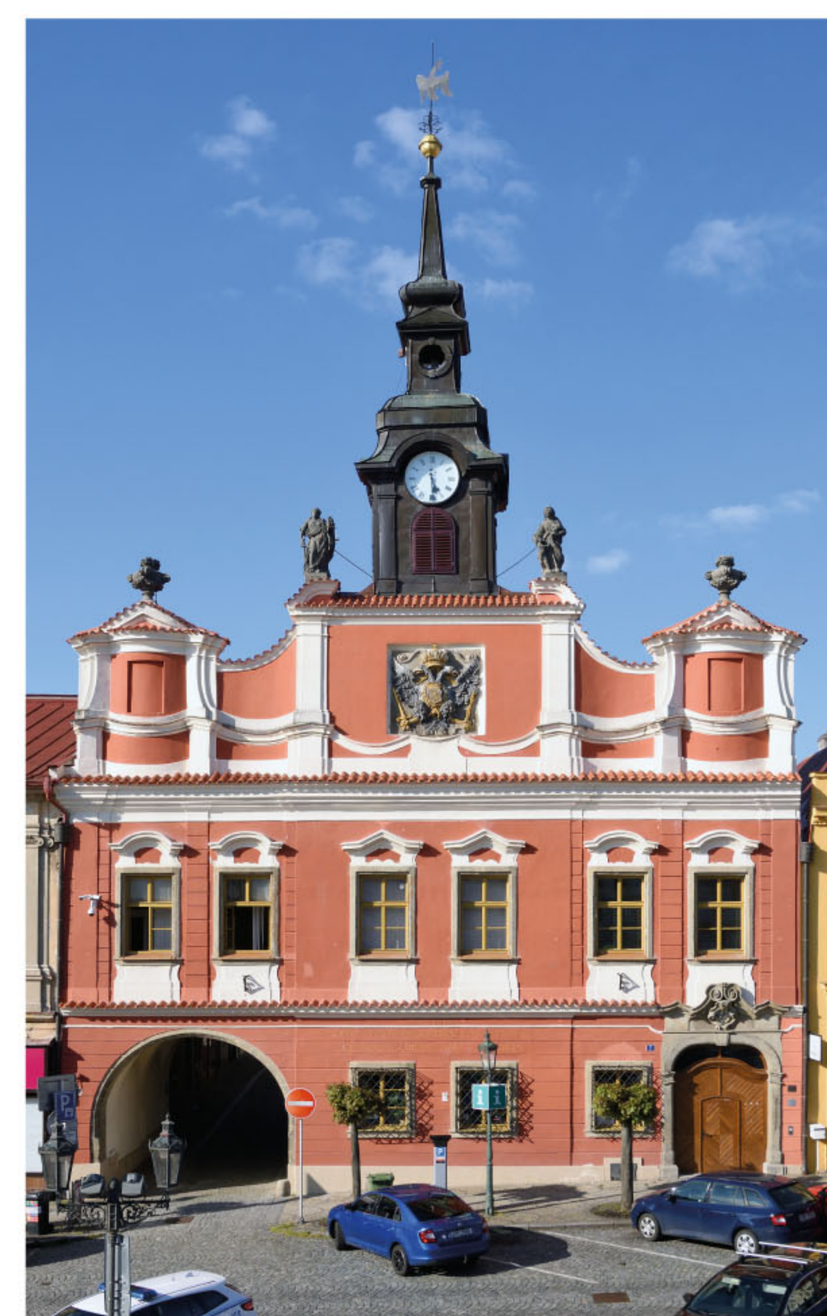
Chrudim, radnice. Stavba z roku 1721 je poučena santiniovskou architekturou, Santinimu ji však nelze přisoudit. Pravděpodobně se jedná o dílo chrudimského stavitele Donata Morazziho, který dle Santiniho plánů stavěl poutní kostel sv. Jana Nepomuckého na Zelené hoře u Žďáru nad Sázavou.