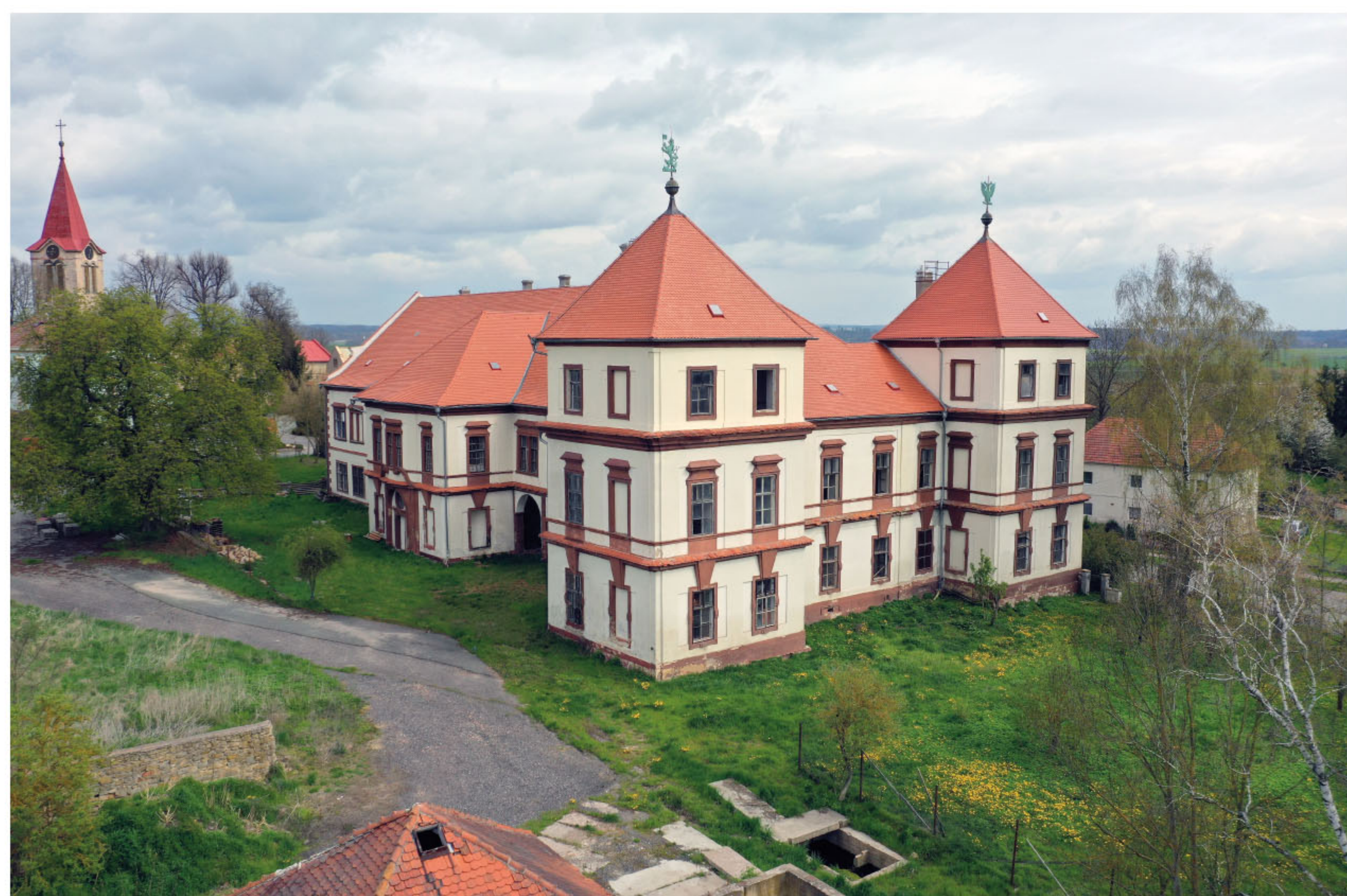
Hoříněves, zámek. Barokní přestavba a přístavba, zadaná Janem Michalem hrabětem Šporkem, proběhla po roce 1720. Nedokončenou přestavbu reprezentuje dvojice nárožních věží, navazující esovitě prohnutá křídla či architektonický detail fasád. Na základě těchto znaků je uvažováno o Santiniho autorství, což podporuje i osoba stavebníka.

Poznání o Santiniho dílu se neustále vyvíjí a prohlubuje. Archivní bádání a uměleckohistorická vyhodnocování staveb přinášejí nové poznatky a jistější názory na to, které stavby byly Santinim prokazatelně navrženy, či mu je lze s vysokou mírou jistoty připisat. Ale také na to, u kterých bylo třeba jeho autorství vyloučit. Věřme, že kolem nás jsou nadále stavby, které Santinimu připíšeme a obohatíme tak úctyhodný soupis staveb, u nichž je jeho autorství jisté nebo jsme o něm přesvědčeni.