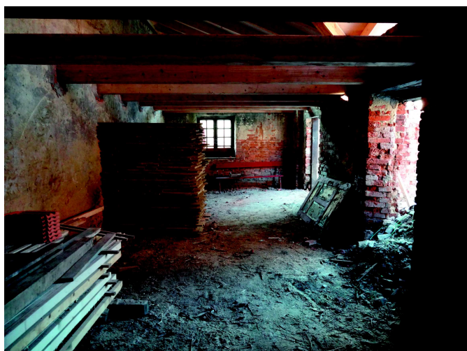
Obnova stropu v hrnčírně, rok 2012