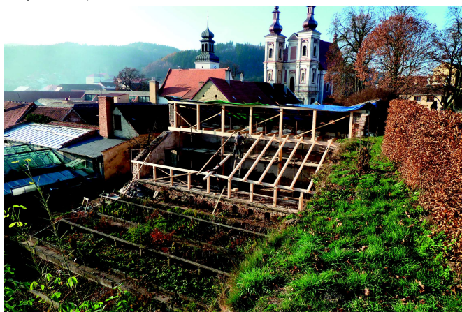
Obnova oranžerie, rok 2011