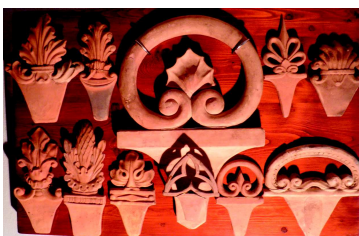
Soubor 11 lemavek po zrestaurování