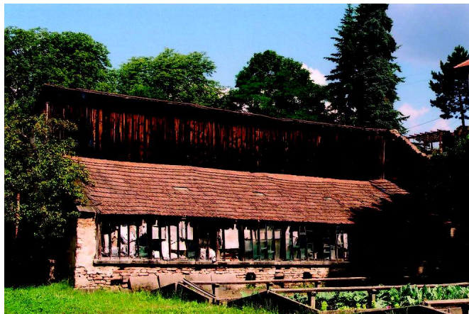
Havarijní stav oranžerie, rok 2005