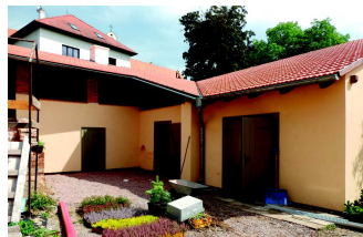
Obnovená hrnčírna a pec, rok 2014