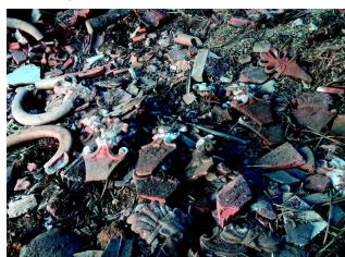
Nález zahradních lemavek 2013