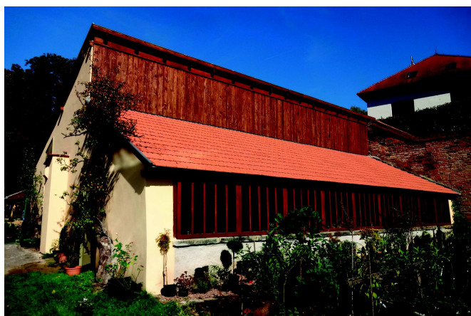
Obnovená oranžerie, rok 2014