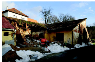
Havarijní hrnčírna a pec, rok 2011