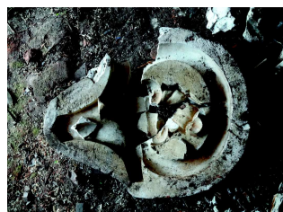
Nález největší sádrové formy pro výrobu lemavek